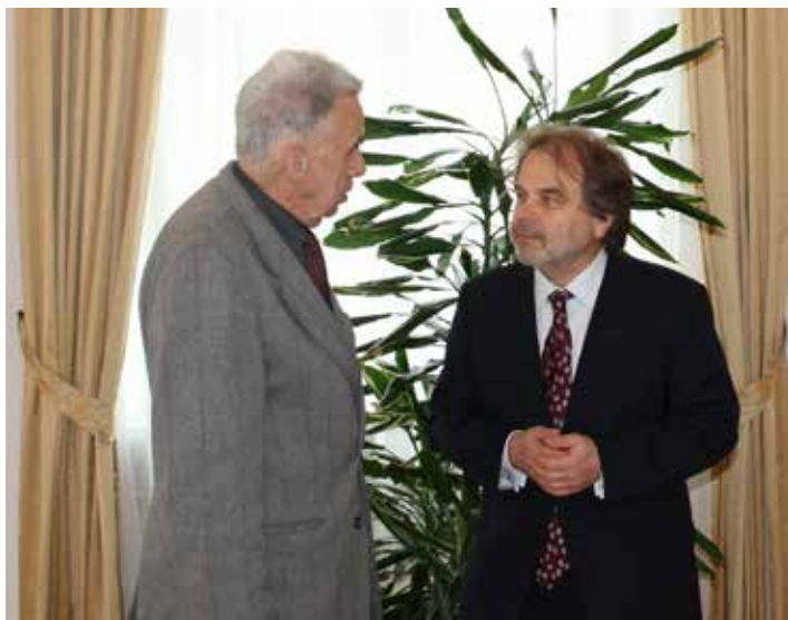
Chwila z ambasadorem