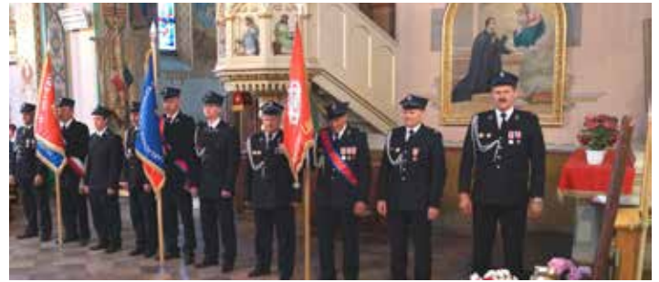
Poczty sztandarowe uczestniczące we mszy św. w intencji strażaków

Tak doniosły Jubileusz to znaczący czas w historii, to okres życia kilku pokoleń, to również okazja do świętowania i licznych wspomnień.