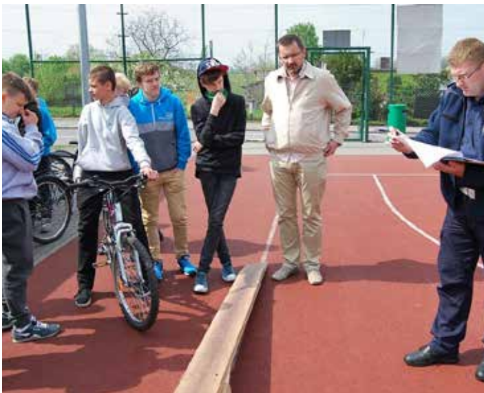
Ostatnie wskazówki przed częścią praktyczną

Znajomość znaków, przepisów ruchu drogowego oraz test sprawności podczas jazdy na rowerze po torze przeszkód. Tym wszystkim musieli się wykazać uczestnicy powiatowych eliminacji Turnieju BRD.