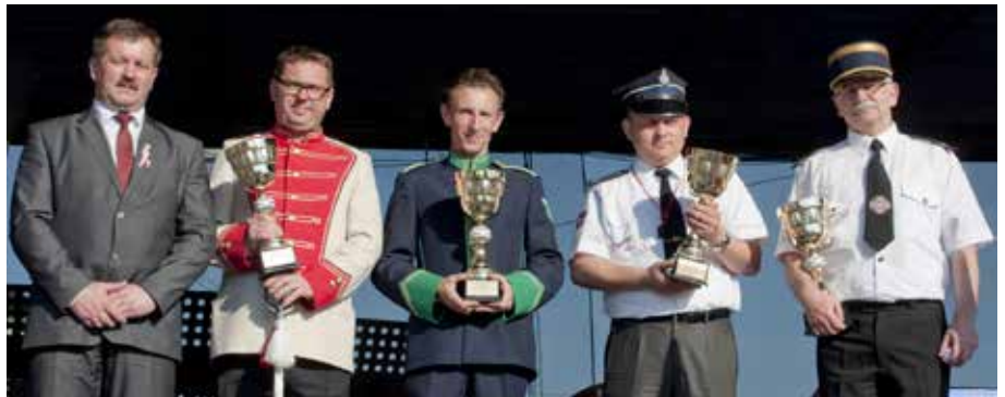
Kapelmistrzowie strażackich orkiestr dętych biorących udział w festiwalu ze Sławomirem Boguckim, burmistrzem miasta