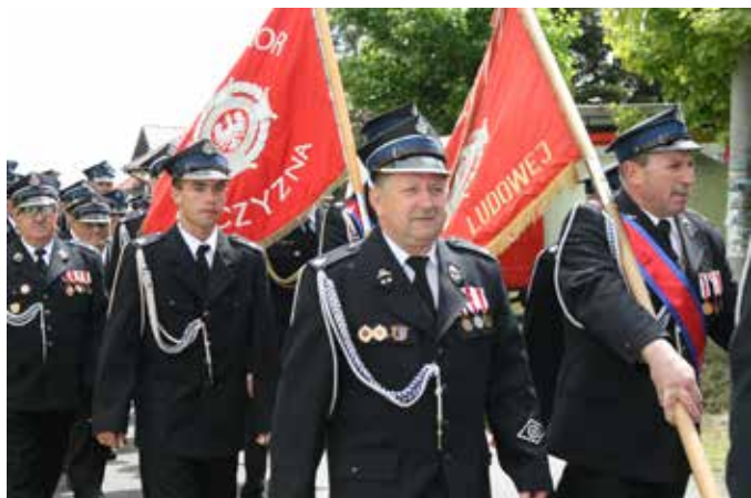
Poczty sztandarowe na tle świętujących strażaków