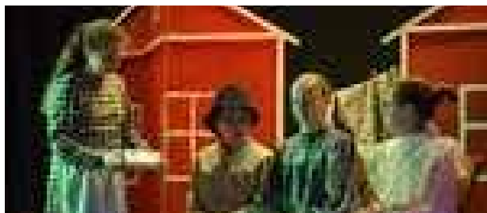
Laureaci I miejsca w czasie występu