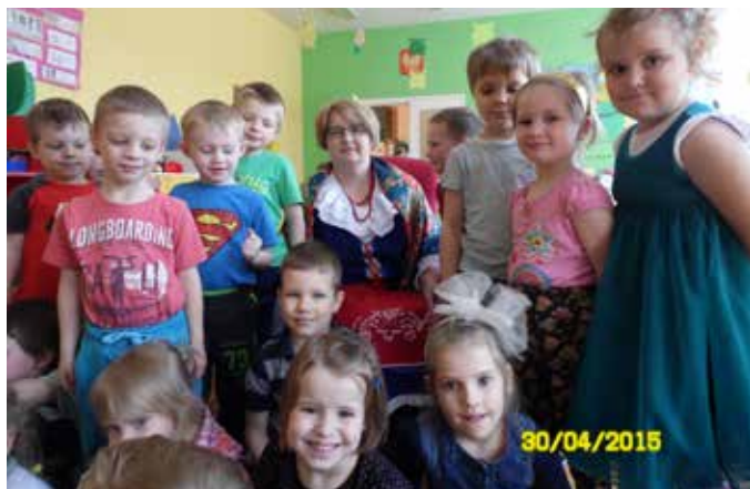
Kujawianka w otoczeniu przedszkolaków

Tekst/Foto: Przedszkole Publiczne w Dobrem