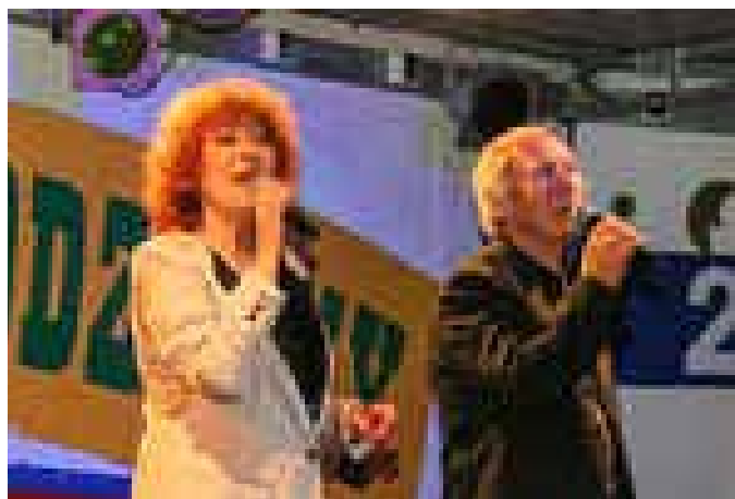
Gwiazda wieczoru zespół PARTITA

Gwiazdą wieczoru był zespół „Partita”, który przypomniał dawne, sławne przeboje. O 21.30 sceną zawładnął zespół „Prezydent”.