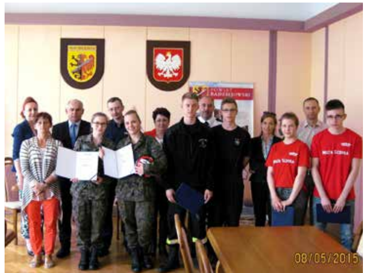
Organizatorzy i uczestnicy Olimpiady

Tekst: Jadwiga Marcinkowska