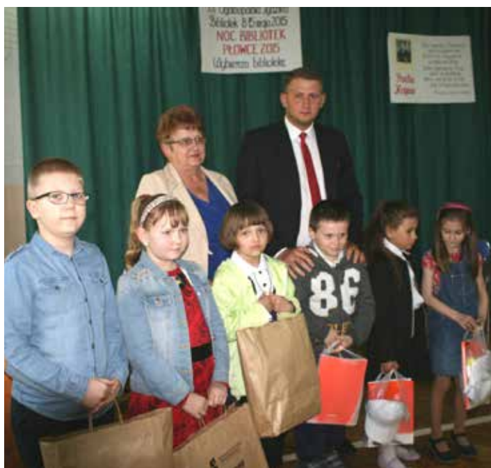
Laureaci konkursu plastycznego „Moja biblioteka” wraz z organizatorami „Nocy Bibliotecznej”