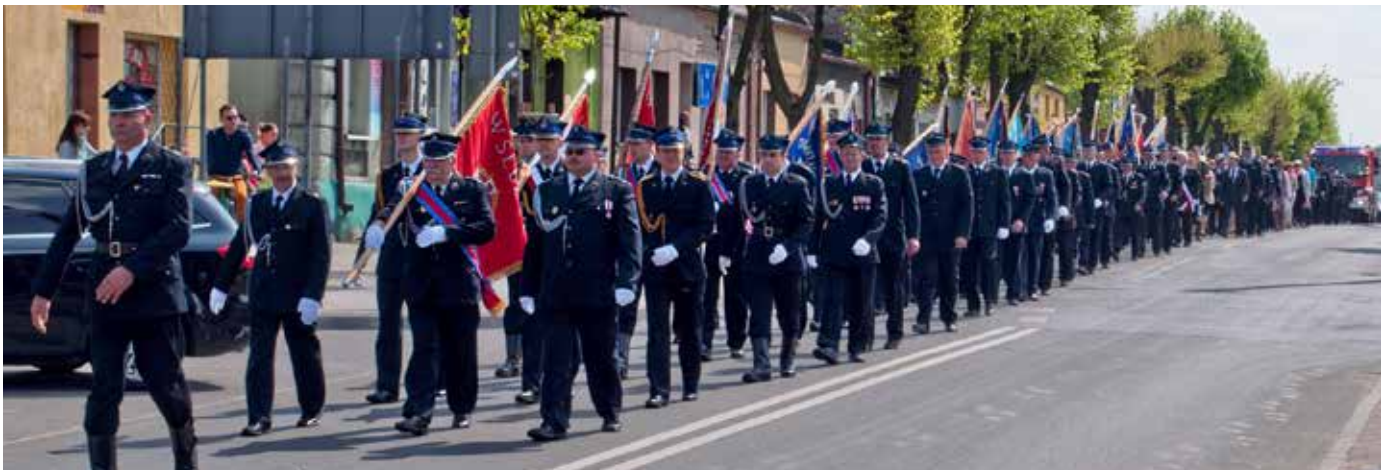
Poczty sztandarowe przemaszerowały ulicami miasta