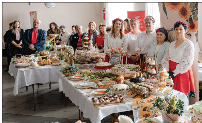
Wyjątkowe potrawy cieszyły oczy i podniebienia zaproszonych gości