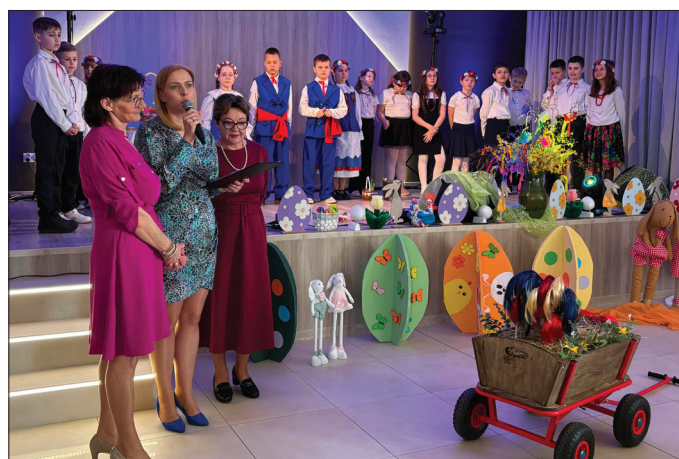
Występ małych artystów na scenie Gminnego Ośrodka Kultury