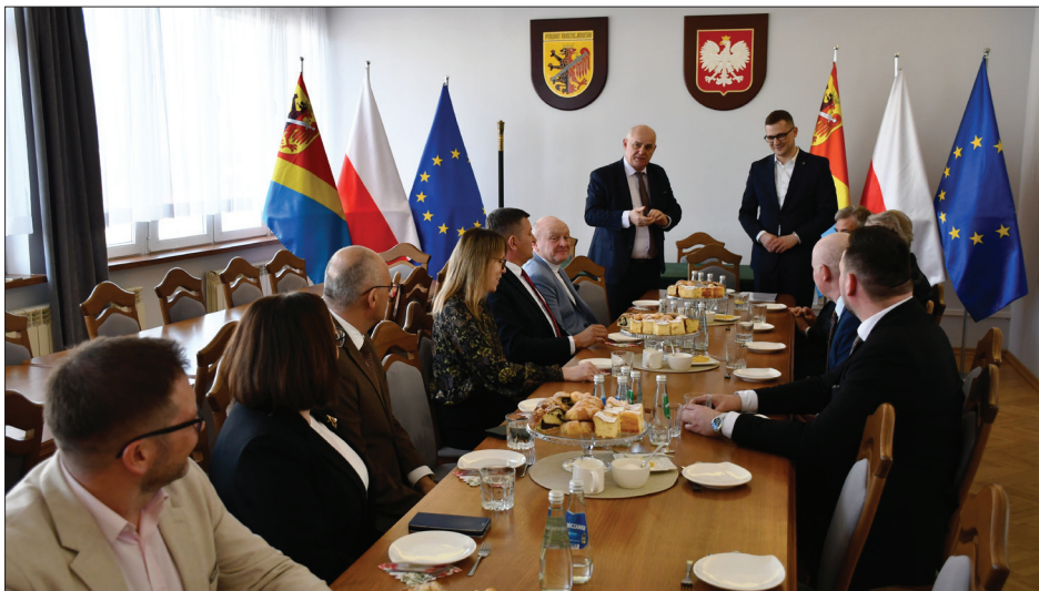
W rozmowach uczestniczyli przedstawiciele lokalnego samorządu