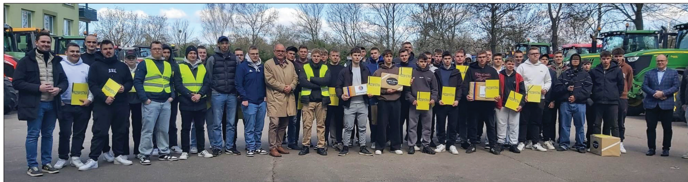
Wydarzenie było okazją do sportowej rywalizacji i integracji społeczności szkolnej

W czwartek, 9 kwietnia w Zespole Szkół Rolniczego Centrum Kształcenia Ustawicznego w Przemystce odbyła się kolejna edycja Traktoriady – wydarzenia, które na stałe wpisało się w kalendarz szkolnych inicjatyw. Dzień upłynął pod znakiem emocji, zdrowej rywalizacji i pasji do rolnictwa, łącząc uczniów, nauczycieli oraz gości.