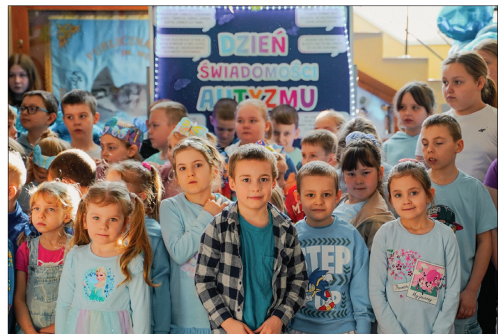
W tym dniu wszyscy na znak solidarności z osobami ze Spektrum Autyzmu ubrani byli na niebiesko

Tekst: Anna Dziubich