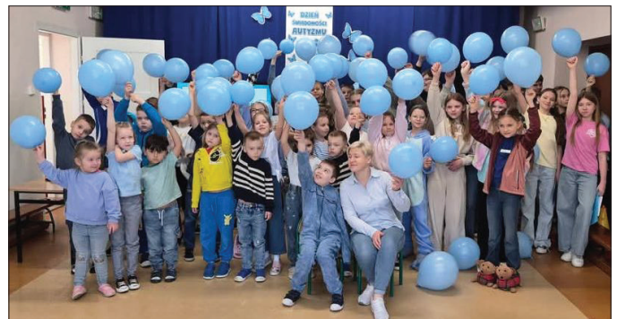
W geście solidarności z osobami w spektrum wszyscy nadmuchali niebieskie balony

Dzień na Opak okazał się świetną okazją do wspólnej zabawy, integracji i wyrażenia siebie. Takie inicjatywy sprawiają, że szkoła staje się miejscem jeszcze bardziej przyjaznym i pełnym radości.