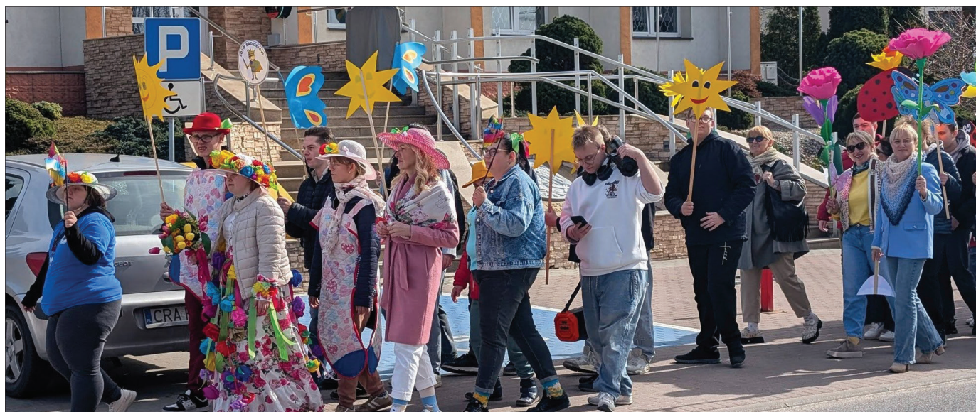
Barwna parada przyciągała uwagę przechodniów