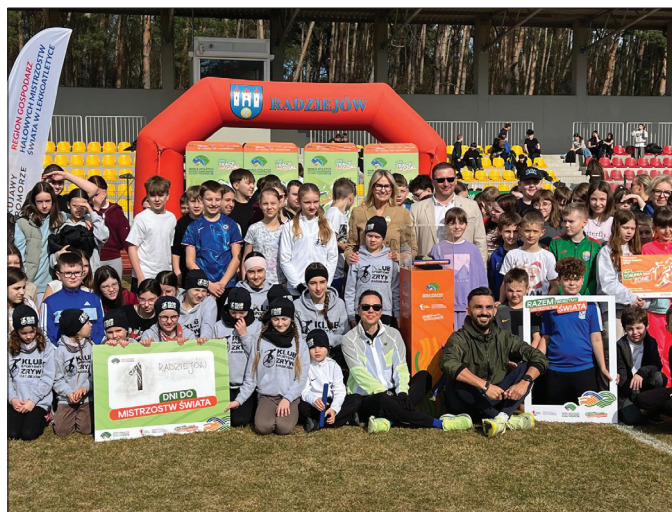
Pamiątkowe zdjęcie z wyjątkowego dnia

Radziejów znalazł się na trasie wyjątkowego wydarzenia towarzyszącego Halowym Mistrzostwom Świata w Toruniu. Miasto było ostatnim, 50. przystankiem sztafety promującej tę międzynarodową imprezę, której współorganizatorem jak i gospodarzem inicjatyw towarzyszących mistrzostwom był Urząd Marszałkowski Województwa Kujawsko-Pomorskiego.