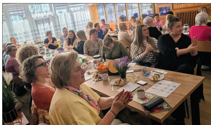
Mieszkanke licznie przybyły na warsztaty

W sobotę, 21 marca kawiarnia Gminnego Ośrodka Kultury w Osiecinach zamieniła się w prawdziwą strefę urody i relaksu.