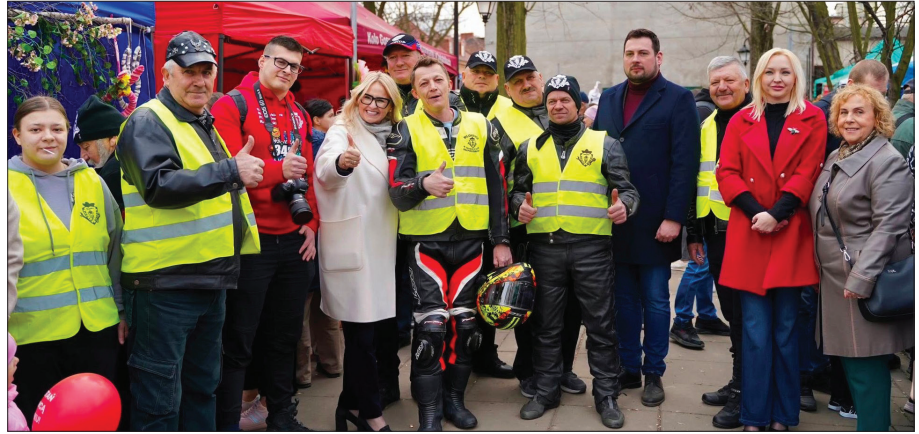
Nie zabrakło rozmów, śmiechu i chwil spędzonych razem

Przez cały czas trwania wydarzenia można było poczuć wyjątkową, ciepłą atmosferę, która pokazała, jak ważne są wspólne