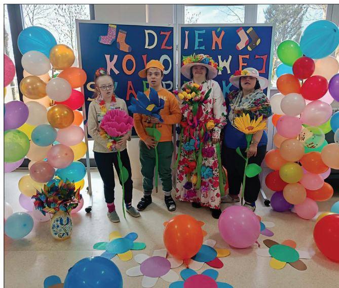
Było barwnie, kolorowo i wesoło

Tekst: Dominika Chmielewska