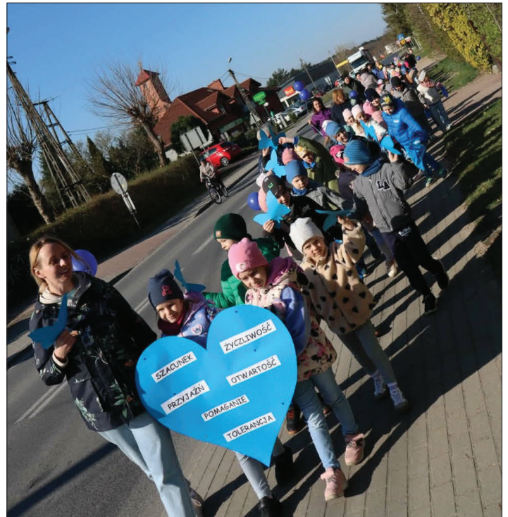
Wspólny pochód grup przedszkolnych

Tekst: Milena Nogiec