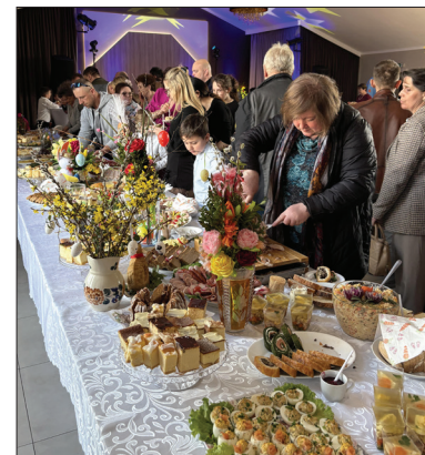
Wspólna degustacja pysznych potraw wielkanocnych

Spotkanie przebiegało w świątecznej atmosferze, wprowadzając uczestników w radosny czas Wielkanocy – pełen nadziei, odrodzenia i wspólnego świętowania.