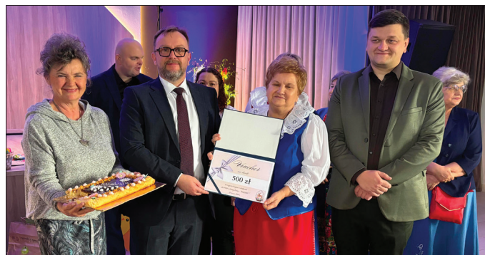
Wręczenie vouchera dla Koła Gospodyń Wiejskich Bodzanowo – laureata konkursu kulinarnego na najlepszy mazurek

22 marca w Gminnym Ośrodku Kultury w Dobrem odbyło się spotkanie wielkanocne, które zgromadziło mieszkańców gminy oraz licznych gości. W wydarzeniu uczestniczyli: wójt gminy