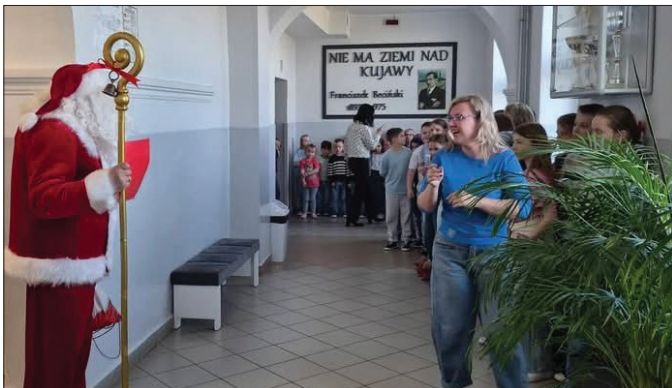
Pojawienie się św. Mikołaja o tej porze roku było niemałym zaskoczeniem

Jedną z nich była zamiana ról- uczniowie wcielili się w nauczycieli i prowadzili lekcje, a nauczyciele zasiedli w ławkach jako uczniowie. Mieliliśmy też nową Panią Dyrektora! Korytarze szkolne z kolei wypełniły się kolorowymi, miękkimi kapciami w najróżniejszych wzorach, a barwne makijaże oraz nietypowe stylizacje wprowadziły prawdziwie wiosenny nastrój. Nie zabrakło również butów i skarpetek nie do pary, co wywołało wiele uśmiechu i pozytywnej energii. Kreatywność uczniów można było podziwiać również gdy przynosili swoje książki i przybory szkolne „w czymś innym” niż tradycyjny plecak. W naszej szkole wydarzyło się coś jeszcze, coś naprawdę niezwykłego... odwiedził nas sam Święty Mikołaj! Choć data mogła sugerować żart, gość był jak najbardziej prawdziwy i sprawił uczniom ogromną radość.