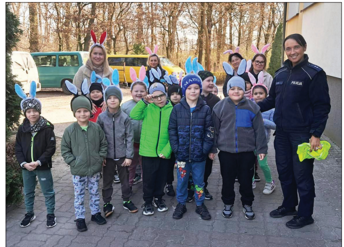
Dzieci dowiedziały się kto to jest policjant, czym się zajmuje i jakie rozwiązuje problemy

Po teorii przyszedł czas na praktykę. Policjanci wybrali się z uczniami na edukacyjny spacer do Osiecin, gdzie mundurowi pokazali dzieciom, dlaczego warto poruszać się po chodniku i po której stronie chodzić, gdy go nie ma. Następnie, udali się na przejście dla pieszych, gdzie funkcjonariusze wyjaśnili, co oznaczają poszczególne znaki i jak bezpiecznie przekroczyć drogę. Potem, pod nadzorem policjantów przyszedł czas na naukę prawidłowego przejścia przez jezdnię. Takie działania edukacyjne mają na celu zwiększenie bezpieczeństwa dzieci, podczas poruszania się po drodze.