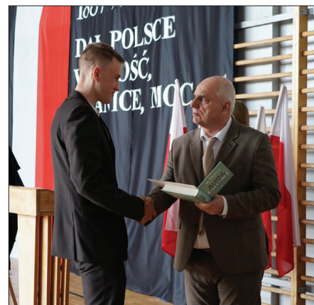
Wspólne świętowanie było okazją do rozdania nagród