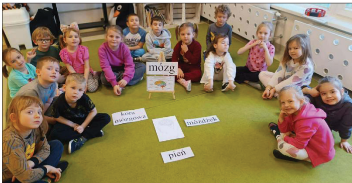
Podczas zajęć dzieci dowiedziały się, że mózg to „magiczna skrzynka”, dzięki której myślimy, czujemy i zapamiętujemy

Z okazji Tygodnia Mózgu w Przedszkolu Samorządowym „Kujawiaczek” przyjrzelśmy się bliżej temu niezwykle „małemu