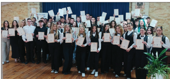
Serdecznie gratulujemy i życzymy dalszych sukcesów!

W dzisiejszym świecie, gdzie rynek pracy nieustannie się zmienia, a konkurencja rośnie, certyfikaty stały się jednym z kluczowych narzędzi, umożliwiających osiągnięcie sukcesu oraz wsparciem dla młodych ludzi w realizacji ich zawodowych marzeń.