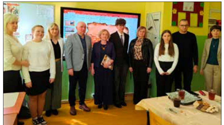
Laureaci i organizatorzy konkursu

Serdecznie gratulujemy laureatom oraz dziękujemy wszystkim uczestnikom za zaangażowanie i zainteresowanie historią regionu.