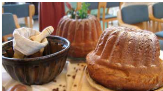
Kujawiok – Wielkanocna baba drożdżowa

Buchty drożdżowe z powidłami: ½ kg mąki pszennej, 4 dag drożdży, 1 szk. mleka, 2 łyżki masła, 3 jajka, 3 łyżki tłuszczu, 3 łyżki cukru, powidła śliwkowe, cukier waniliowy. Drożdże rozrobić w ciepłym mleku, dodać 2 łyżki mąki i łyżeczkę cukru. Podrośnięte drożdże dodać do mąki. Wlać resztę mleka z rozpuszczonym masłem. Na koniec dodać jajka ubite z resztą cukru. Wyrobić ciasto, aż będzie odstawało od ręki. Odstawić w ciepłe miejsce na pół godziny. Następnie wysmarować garnek lub formę okrągłą smalcem. Po wyrośnięciu ciasta nabierać łyżką spłaszczając na dłoni, w środek kłaść powidła śliwkowe. Robić kulki, ręce maczać w ciepłym tłuszczu. Kulki ciasto układać jedna przy drugiej w formie. Po wyrośnięciu wstawić do gorącego piekarnika na 30 minut. Piec na złoty kolor. Do pieczenia posmarować jajkiem i posypać kruszonką. Kruszonka: 1 łyżka masła, 2 łyżki mąki pszennej, 1 łyżka cukru.