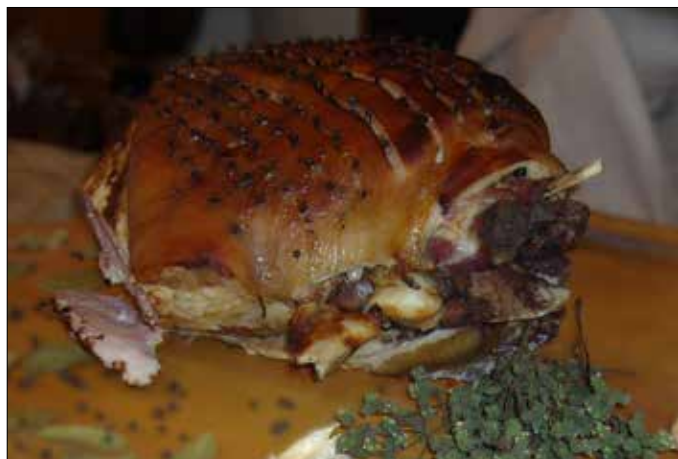
Świąteczna szynka kujawska z kością

Solanka: do przegotowanej, ostudzonej wody dodać tyle soli, aby surowe jajko pływało, potem dodać przyprawy: czosnek, ziele angielskie, liść laurowy, pieprz naturalny i majeranek. Szynkę natrzeć czosnkiem rozartym z solą oraz majerankiem. Pozostawić kilka godzin. Zanurzyć szynkę w przygotowanej solance, przyduścić deseczką i peklować przez 6-7 dni. Po wyjęciu z solanki obmyć, a następnie parzyć na wolnym ogniu tyle godzin ile waży szynka. Po sparzeniu skórę szynki naciąć w kratkę i nabić goździkami, zapiec w gorącym piekarniku, aż skórka się zrumieni i nabierze złocistego koloru. Chrzan do szynki: ½ kg chrzanu, 1 łyżeczka kwasu cytrynowego, ½ kg ugotowanych buraczków czerwonych lub 100 ml słodkiej śmietany 18%, odrobina cukru. Chrzan oczyścić, zetrzeć na tarce o drobnych oczkach, sparzyć gotującą wodą, dodać kwas cytrynowy, cukier – wymieszać. Dodać do buraczków czerwonych lub wymieszać ze śmietaną.