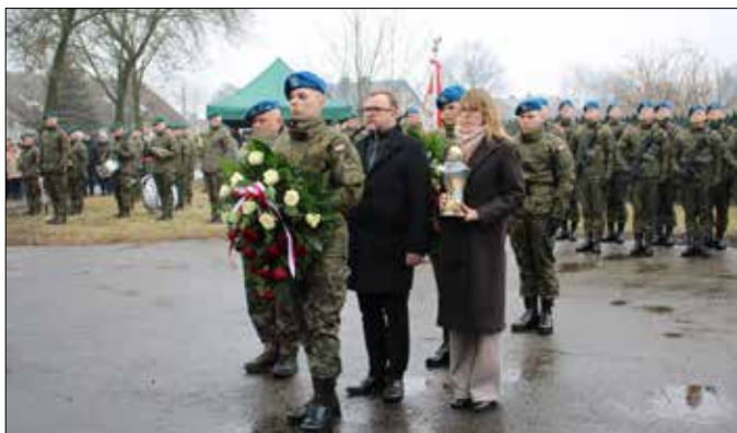
W hołdzie bohaterom – złożenie kwiatów przez delegację władz gminy Dobrego

Przy pomniku odbyła się uroczysta część oficjalna obchodów, która obejmowała meldunek dowódcy uroczystości, przegląd pododdziałów, oddanie honoru sztandarom, przywitanie z żołnierzami, podniesienie flagi państwowej oraz odegranie hymnu państwowego. Następnie miały miejsce wystąpienia okolicznościowe, apel pamięci zakończony salwą honorową, złożenie wiązanek kwiatów oraz defilada pododdziałów.