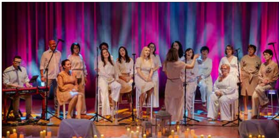
Chór AmberVoice oczarował publiczność swoim występem