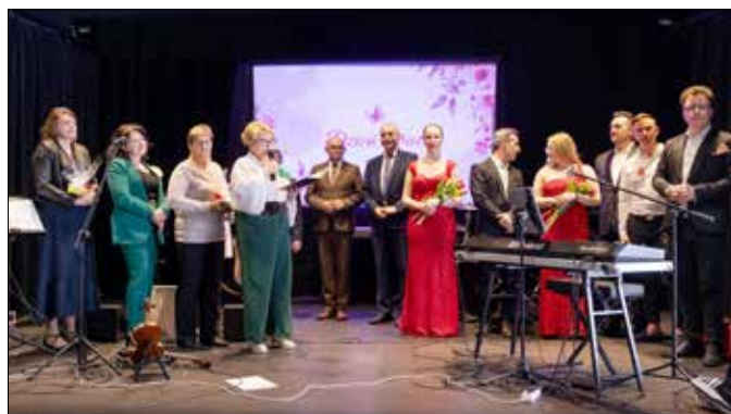
Dla Panów również przewidziano niespodziankę z okazji zbliżającego się Dnia Mężczyzny

Po muzycznych emocjach przyszedł czas na słodki poczęstunek – dla wszystkich uczestniczek przygotowany został pyszny tort, który był miłym dopełnieniem tego wyjątkowego wieczoru.