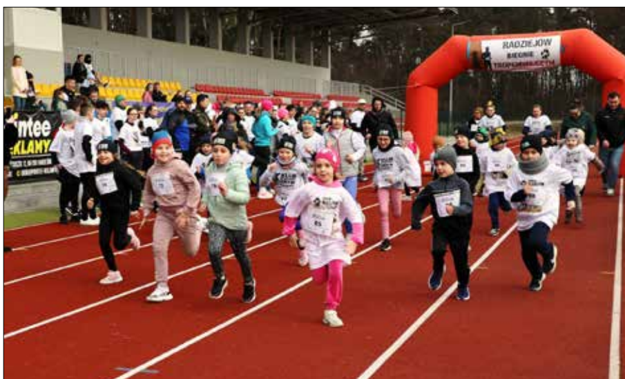
Na starcie stanęli zarówno doświadczeni biegacze jak i najmłodsi uczestnicy

Wydarzenie nawiązuje do obchodów Narodowy Dzień Pamięci Żołnierzy Wyklętych i ma na celu upamiętnienie żołnierzy powojennego podziemia niepodległościowego. W Radziejowie bieg stał się okazją nie tylko do sportowej rywalizacji, ale przede wszystkim do wspólnego oddania hołdu bohaterom.