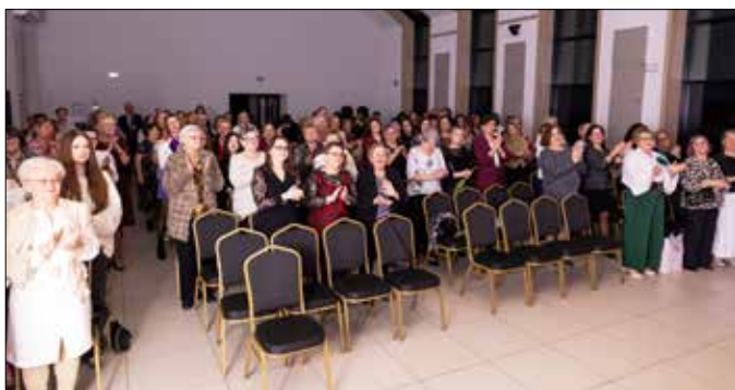
Panie chętnie przyłączyły się do wspólnego śpiewania

Prawdziwą niespodzianką wieczoru był koncert zespołu Infected, który porwał publiczność swoją energią i świetnym wykonaniem. W repertuarze znalazły się znane i lubiane utwory, w tym piosenki Zbigniewa Wodeckiego oraz inne ponadczasowe klasyki. Występ spotkał się z entuzjastycznym przyjęciem, a bisy były najlepszym dowodem na to, jak bardzo koncert przypadł do gustu zgromadzonym Paniom.