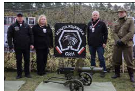
Grupa Rekonstrukcji Historycznej „Reduta Kujawska”

Wyjątkową atmosferę wydarzenia pomogły stworzyć grupy rekonstrukcyjne: Grupa Rekonstrukcji Historycznej Armii Krajowej „Kolumbowie” z Piotrkowa Kujawskiego oraz Grupa Rekonstrukcji Historycznej „Reduta Kujawska” , których obecność przybliżyła uczestnikom realia historyczne i nadała uroczystości szczególny charakter.