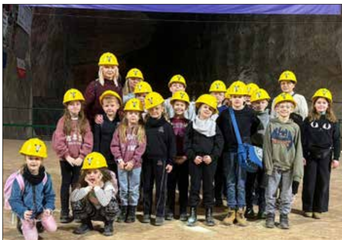
Wycieczka do Kopalni Soli w Kłodawie