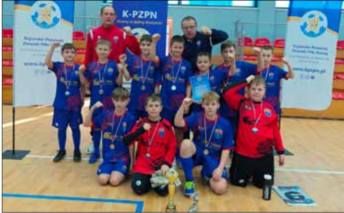
Zawodnicy dumnie prezentują otrzymane medale i puchar

28 lutego w hali sportowej w Cieclocinku przy ul. Lipnowskiej 11c odbył się Finał Turnieju Orlików im. Kazimierza Janeckiego. Wśród uczestników nie zabrakło naszej drużyny – Start Radziejów.