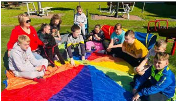
Dogoterapia na łonie natury

Specjalny Ośrodek Szkolno-Wychowawczy w Radziejowie przeznaczony jest dla uczniów niepełnosprawnych intelektualnie w stopniu lekkim, umiarkowanym, znacznym i głębokim, z niepeł-