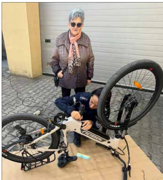
Policjanci zachęcają do znakowania rowerów

Przypominamy, że w każdy pierwszy wtorek miesiąca w godz. 10:00-14:00 w siedzibie Komendy Powiatowej Policji w Radziejowie, istnieje możliwość bezpłatnego oznakowania i zarejestrowania posiadanego roweru, przez mieszkańców powiatu radziejowskiego.