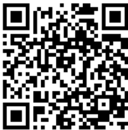
Wirtualny spacer po Liceum

Klasa A – językowa – jeśli jesteś humanistą. Decydując się na naukę w tej klasie, realizujesz na poziomie rozszerzonym język polski, język angielski oraz wybierzesz jeszcze jeden przedmiot może to być: geografia, historia, fizyka, informatyka, wiedza o społeczeństwie . Nauka w klasie językowej urozmaicona bywa rozpoznawaniem i rozwijaniem talentów, zainteresowań. Jeśli okaże się, że masz jakiś niebywały dar, Łokietek zapewni Ci udział w konkursach, przeglądach artystycznych, uroczystościach. Realizuj