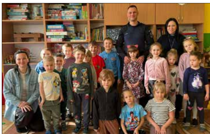
Wizyta funkcjonariuszy sprawiła dzieciom dużo radości