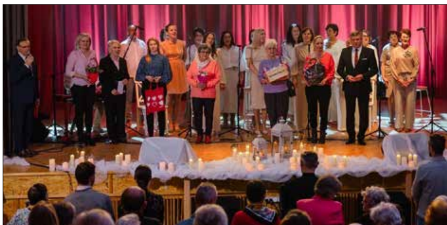
Losowanie upominków wśród Pań obecnych na sali było miłym akcentem wydarzenia