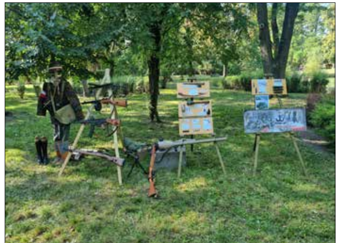
Wystawa okolicznościowa sprzętu wojkowego