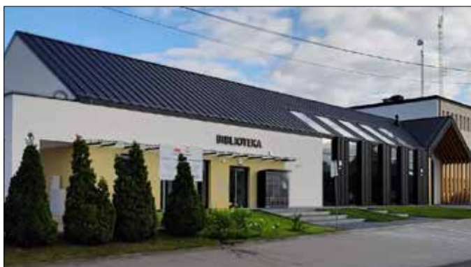
Budynek Biblioteki Publicznej

Z wielką radością pragniemy podzielić się z Państwem relacją z uroczystego otwarcia nowo wybudowanego Gminnego Ośrodka Kultury oraz Biblioteki w Topólce, które odbyło się 21 czerwca. Wydarzenie to było nie tylko momentem symbolicznym, ale także świętem integracji i wspólnoty naszej gminy.