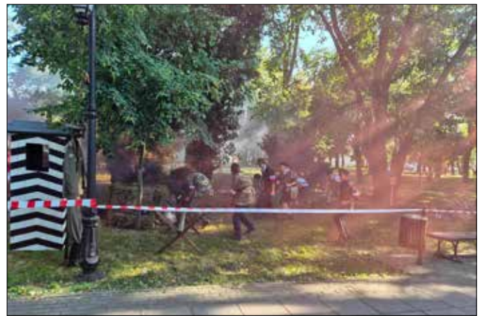
Fragment rekonstrukcji ataku powstańców na posterunek hitlerowski

Tekst: Krzysztof Kowalski