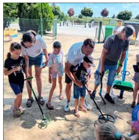
Młodzi poszukiwacze skarbów

Zajęcia plastyczne: malowanie na streczu, robienie łapaczy snów, prace z ciastoliny i modeliny, projektowanie i wykonywanie robotów oraz akwarium z kartonów, ocean jego mieszkańcy – projektowanie i kolorowanie, makiety kartonowe – składanie i malowanie, las w szkle. Zajęcia sportowe: piłka, skakanka, badminton, gry i zabawy na placu zabaw, bilard, piłkarzyki, klocki, słomki i inne.