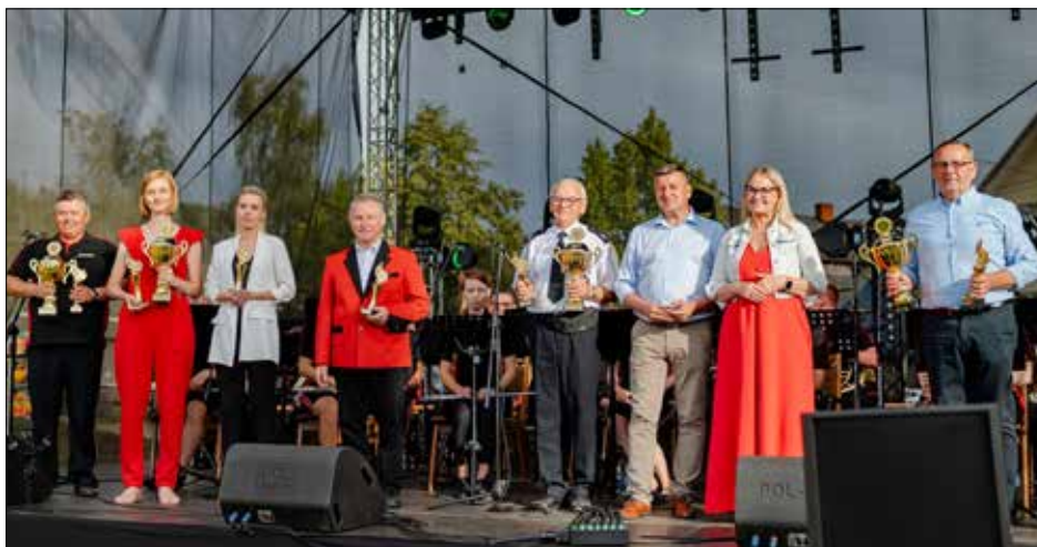
U honorowane orkiestry dęte wraz z władzami lokalnymi i samorządowymi