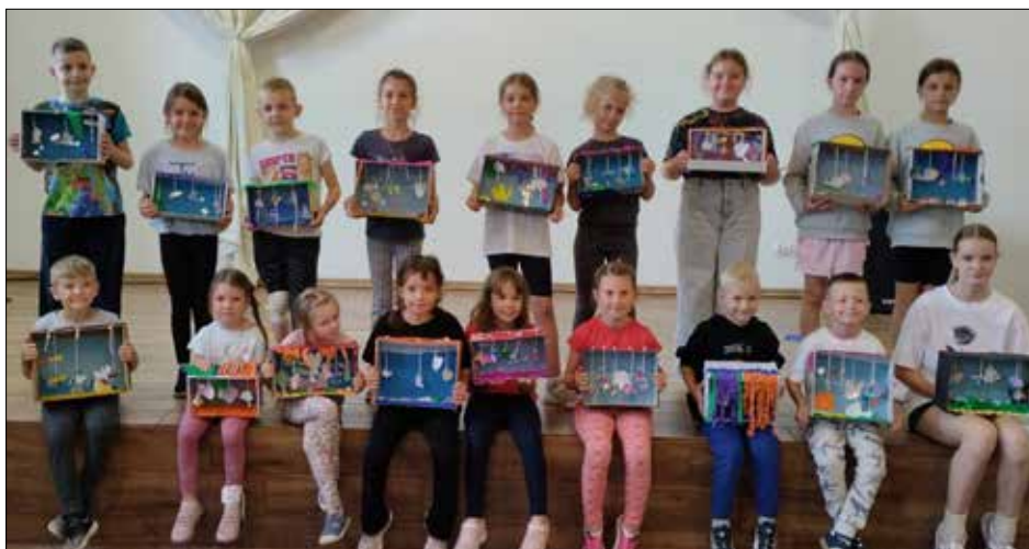
Efekt zajęć plastycznych – akwarium