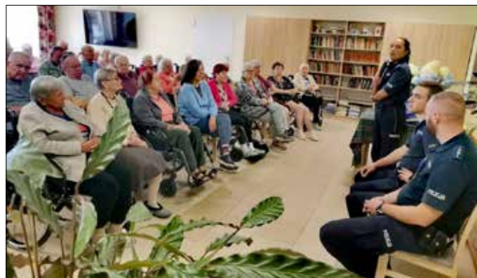
Rozmowy o bezpieczeństwie zawsze przykuwają uwagę seniorów

Policjanci z Komendy Powiatowej Policji w Radziejowie spotkali się z seniorami w Domu Opieki dla Osób Starszych „Dęby”. Tematem przewodnim wizyty było bezpieczeństwo seniorów,