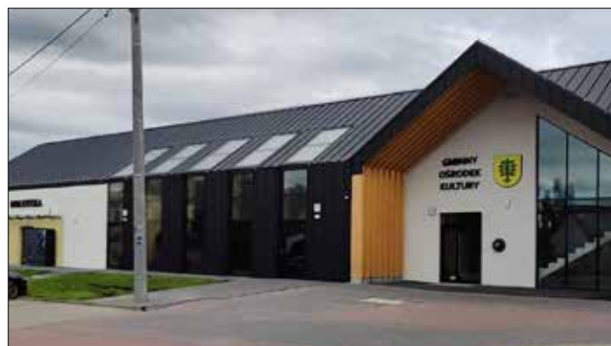
Budynek Gminnego Ośrodka Kultury

Z wielką radością pragniemy podzielić się z Państwem relacją z uroczystego otwarcia nowo wybudowanego Gminnego Ośrodka Kultury oraz Biblioteki w Topólce, które odbyło się 21 czerwca. Wydarzenie to było nie tylko momentem symbolicznym, ale także świętem integracji i wspólnoty naszej gminy.