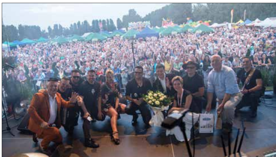
Licznie zgromadzona publiczność na miejskim stadionie