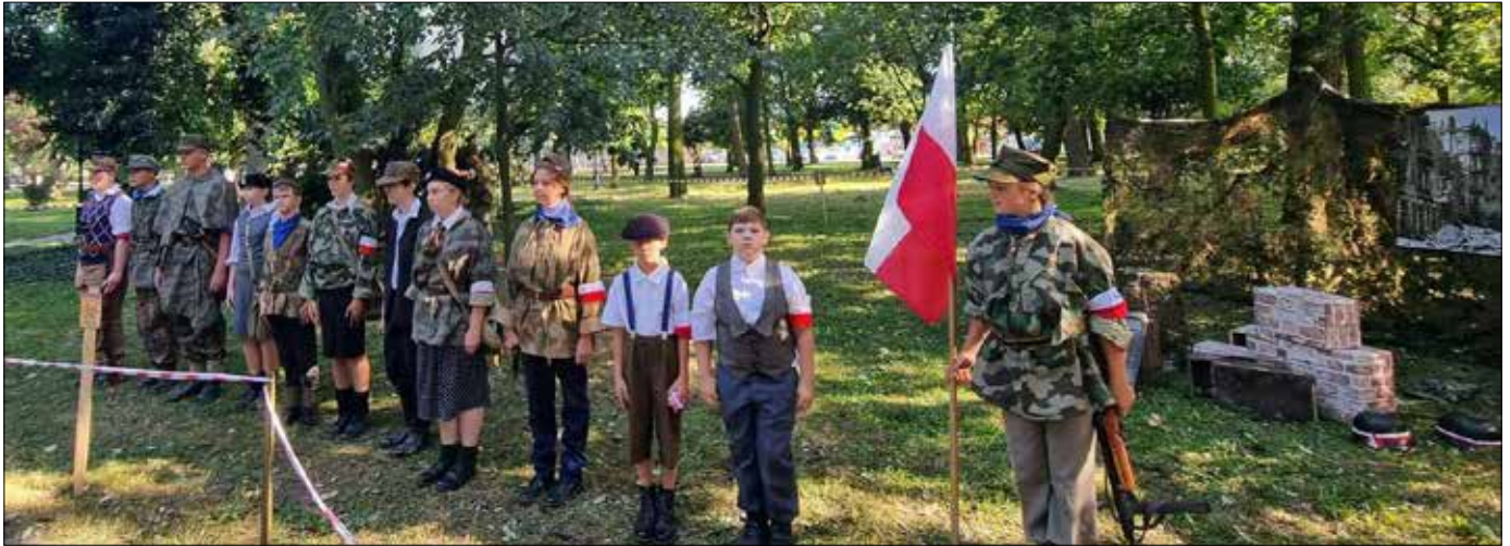
Członkowie GRH AK Kolumbowie