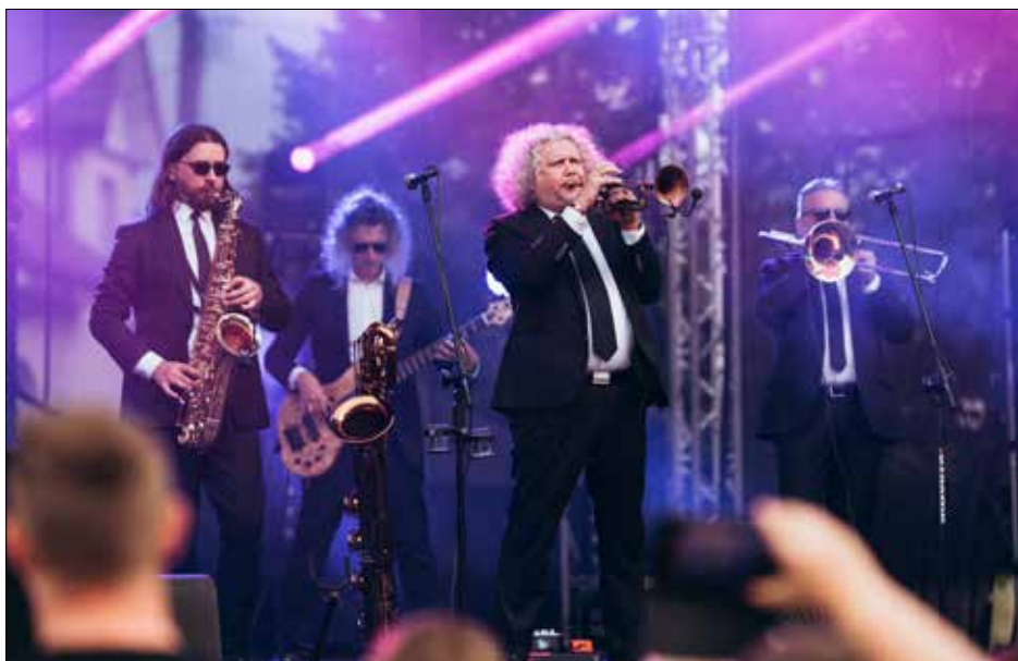
Gwiazda wieczoru zespół „Poparzeni Kawą Trzy”