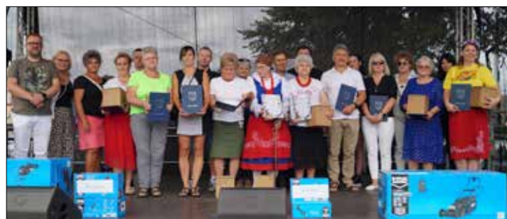
Uczestnicy konkursu „Piękne ogrody w gminie Dobre”

Podczas pikniku rozstrzygnięto dwa konkursy. Pierwszym z nich był konkurs pn. „Piękne ogrody w gminie Dobre” zorganizowany