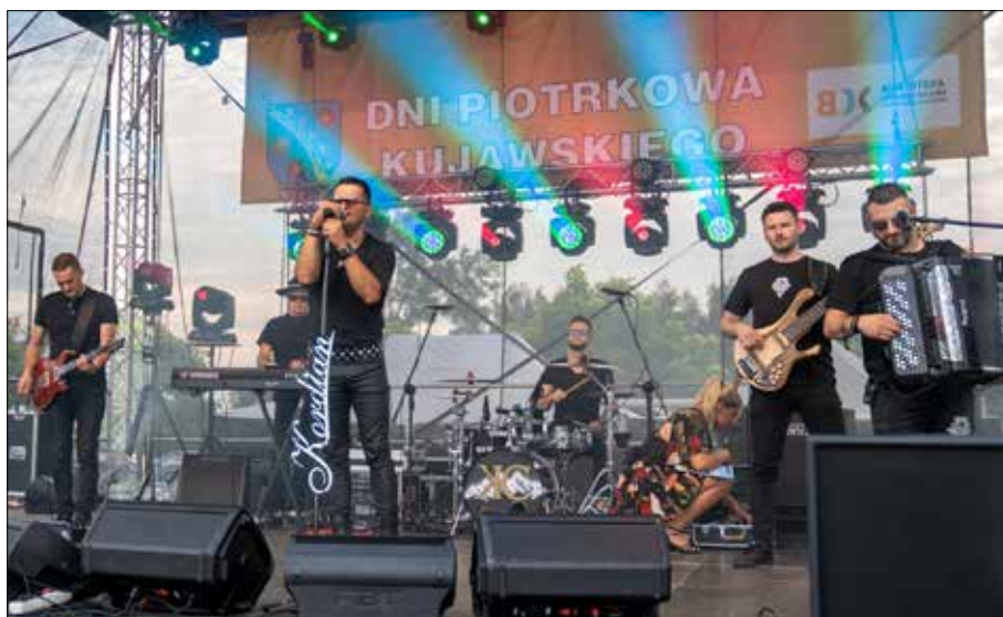
Gwiazda wieczoru Kordian

Część artystyczną rozpoczęły sekcje taneczne: „GWIAZDY”, „MOVE DANCE” i „SPEED”, prezentując na scenie swoją pasję i miłość