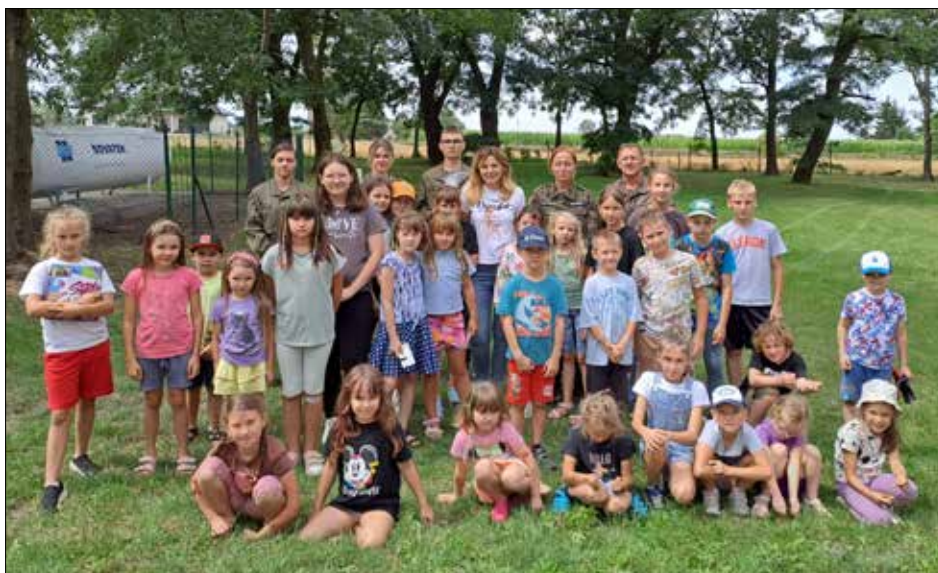
Uśmiechnięci uczestnicy wakacyjnych zajęć