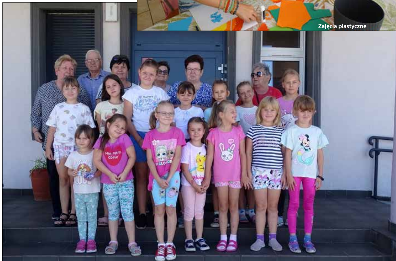
Uczestnicy zajęć z organizatorami