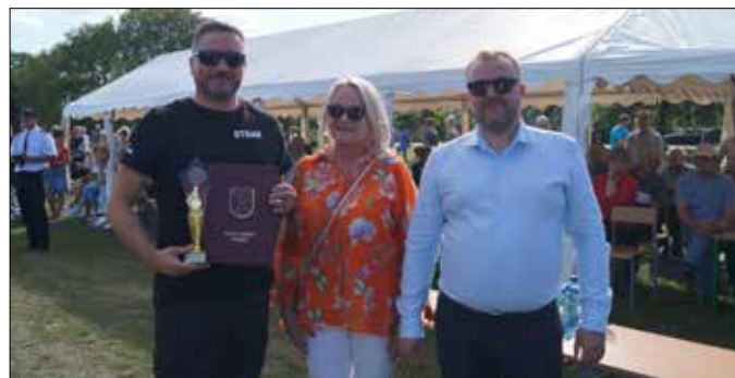
Odbiór nagrody przez zwycięską drużynę OSP Byczyna

Poza emocjami związanymi ze śledzeniem rywalizacji między jednostkami OSP na licznie zgromadzoną publiczność czekały