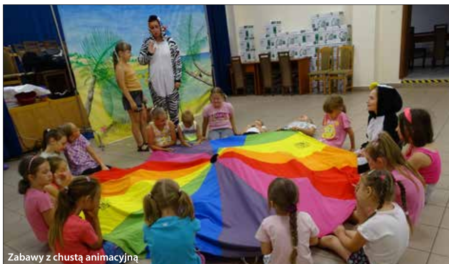
Zabawy z chustą animacyjną