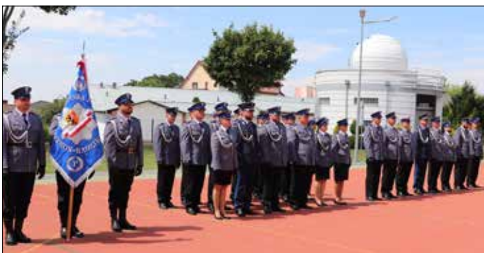
Funkcjonariusze KPP w Radziejowie