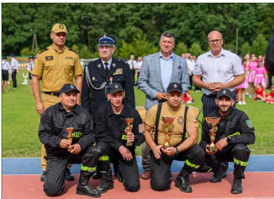
Wyroznione drużyny OSP w zawodach sportowo-pożarniczych