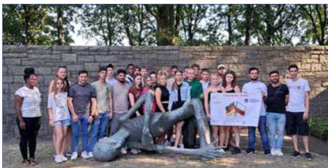
Młodzież z Przemystki z wizytą w niemieckim Minden

Początek roku szkolnego 2023/2024 zaczął się dla niektórych uczniów ZSRCKU w Przemystce intensywnie i bardzo ciekawie. Bowiemy w dniach 11–17 września 2023 r. 17 młodych ludzi z klas 3 TE, 3TS, 4TE, 5TE i 4LO uczestniczyło w spotkaniu młodzieży w niemieckim Minden. Podczas trwającej 5 dni wymiany młodzież pracowała w grupach nad projektami z pogranicza historii, literatury i kultury. Tematyka projektu odwoływała się do zainteresowań współczesnej młodzieży fantastyką na przykładzie „Wiedźmina” Andrzeja Sapkowskiego i do trudnej polsko-niemieckiej historii czasów II wojny światowej. Młodzież zapoznała się z pojęciem i historią „pracy przymusowej” w regionie Minden-Lübbecke podczas wizyty w kopalni Besucher-Bergwerk w Kleinenbremen, w której w czasie II wojny światowej około 700 Polaków pracowało niewolniczo w nieludzkich warunkach oraz w miejscu pamięci KZ-Gedenk-und Dokumentationsstätte w Porta Westfalica, u stóp wzgórza, na którym wzniesiono pomnik cesarza