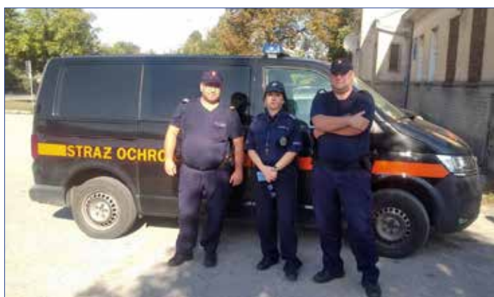
Wspólne działania na rzecz poprawy bezpieczeństwa

wi z posterunku w Piotrkowie Kujawskim, zebrali materiał dowodowy, który pozwolił na zatrzymanie 22-letniego mieszkańca gminy, podejrzanego o ten czyn. Nie potrafił wytłumaczyć swego zachowania. Mężczyzna usłyszał zarzut uszkodzenia mienia. Przepięstwo to zagrożone jest karą od trzech miesięcy do pięciu lat pozbawienia wolności. Dodatkowo będzie musiał pokryć koszty naprawy uszkodzonych nagrobków.