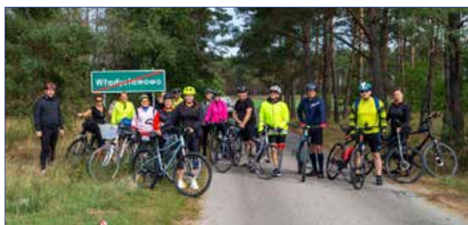
Chwila na wspólne zdjęcie na trasie rajdu rowerowego

Kolejnym miejscem na mapie, które odwiedzili cykliści to miejscowość Synogać. Dojeżdżając tam przez m.in. Ośno Podleśne, Belny czy Spólnik (obok zabytkowego dworku z drugiej połowy XIX w.) uczestnicy dotarli do głównego skrzyżowania, gdzie zrobili chwilę przerwy. Następnie grupa rowerowa udała się w kierunku miejscowości Chle-