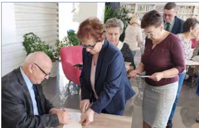
Pierwsze wpisy w indeksie w nowym roku akademickim

Tekst: Wanda Wiatrowska