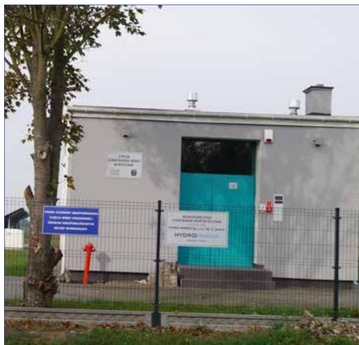
Stacja uzdatniania wody w Byczynie po modernizacji

Przedsięwzięcie dofinansowane przez Bank Gospodarstwa Krajowego objęło przebudowę Stacji Uzdatniania Wody w Byczynie wraz z budową studni, przebudowę Stacji Uzdatniania Wody w Dobrem oraz modernizację kanalizacji sanitarnej na terenie gminy Dobre. W ramach zadania dokonano również zakupu samochodu asenizacyjnego niezbędnego do opróżniania szamb.