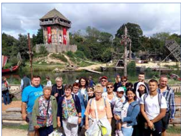
Pobyt w parku rozrywki Puy du Fou – spektakl Wikingowie

W czasie tegorocznego wakacji, w sierpniu br., 37-osobowa grupa mieszkańców powiatu radziejowskiego uczestniczyła w wyjeździe do Francji. W międzynarodowej wymianie wzięli udział członkowie Stowarzyszenia Partnerskiego „Kujawy” wraz z rodzinami. Tegoroczny nasz pobyt we Francji trwał 9 dni. Mieszkając w domach zaprzyjaźnionych rodzin i uczestnicząc we wspólnych wyjazdach i spotkaniach, mieliśmy możliwość poznać życie i codzienność rodzin francuskich, ich zwyczaje i kulturę.