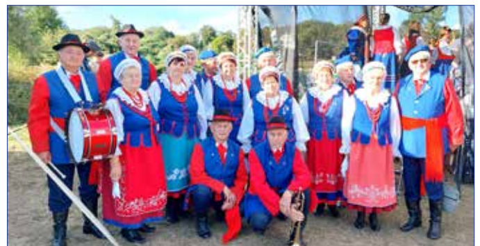
Kujawy Bachorne Nowe z Osiecin, laureaci w kategorii teatru obrzędu ludowego (foto archiwalne)