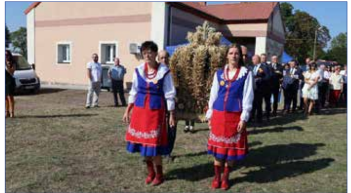
Korowód dożynkowy z tradycyjnym wieniec uplecionym z tegorocznych zbóż