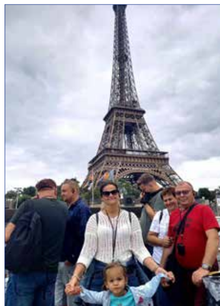
Paryż rejs po Sekwanie, widok na wieżę Eiffela

Pobyt we Francji to lekcja tolerancji, okazja do obcowania z inną kulturą, akceptacji innych zwyczajów, to również najlepszy sposób poznania historii i kultury tego kraju. Wspólny