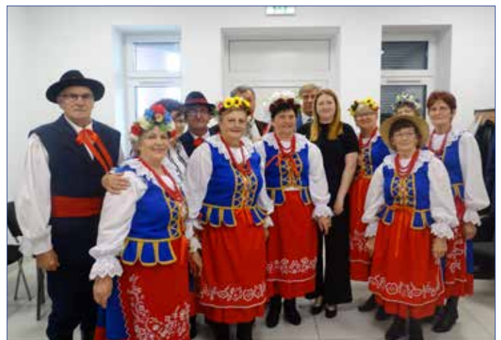
Członkowie Koła Gospodyń Wiejskich przy Klubie Seniora w Stróżewie

Wiejskie Centrum Kultury i Biblioteka Publiczna w Bytoniu wraz ze współorganizatorem Narodowym Instytutem Kultury i Dziedzictwa Wsi zorganizowała w dworcu w Stróżewie, 5 października br., inscenizację fragmentu wesela kujawskiego.