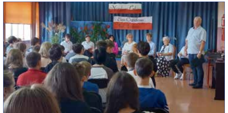
Spotkanie z klasyką polskiej prozy w ramach akcji Narodowe Czytanie

Wspólna lektura „Nad Niemnem” dostarczyła wiele czytelniczej satysfakcji i była doskonałą okazją do spotkania z rodzinami Bohatorów, Korczyńskich i innymi postaciami tak pięknie przedsta-