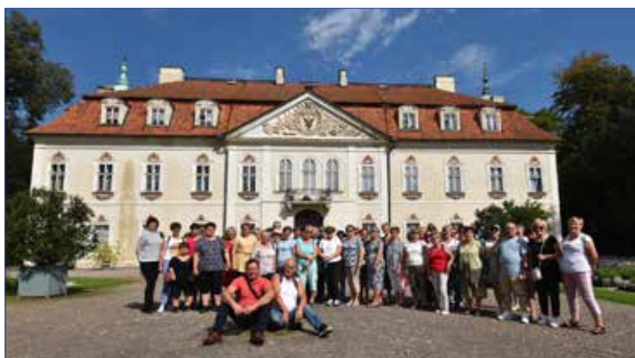
Uczestnicy wycieczki przed pałacem Radziwiłłów w Nieborowie