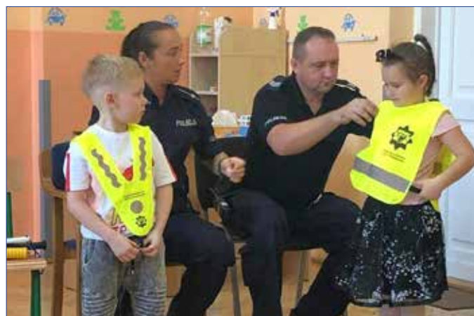
Nauka poprawnego noszenia kamizelek odblaskowych

Jej celem jest przypomnienie i uświadamianie o potrzebie korzystania z elementów odblaskowych. Ostatnio spotkali się z przedszkolakami z Krzywosądku. Przypomnieli podstawowe zasady bezpiecznego poruszania się po drodze publicznej. Mówili, jakie zagrożenia mogą spotkać dzieci w drodze do szkoły oraz podczas powrotu do domu. Policjanci przypomnieli o obowiązku noszenia elementów odblaskowych poza terenem zabudowanym. Szczególnie teraz w okresie jesiennym, gdy zmrok zapada szybko i nieoświetleni piesi, są niewidoczni dla kierowców aut.