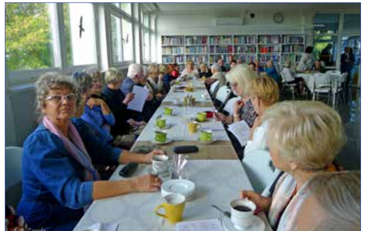
Spotkanie inauguracyjne oddziału radziejowskiego K-DUTW