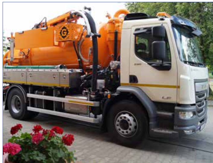
Pojazd do opróżniania zbiorników na nieczystości ciekłe

Gmina Dobre zrealizowała przedsięwzięcie pn. „Modernizacja infrastruktury wodno-kanalizacyjnej na terenie gminy Dobre”. Inwestycja została przeprowadzona w ramach Rządowego Funduszu Polski Ład: Program Inwestycji Strategicznych.