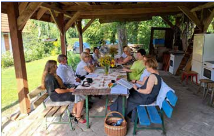
Uczestnicy Narodowego Czytania