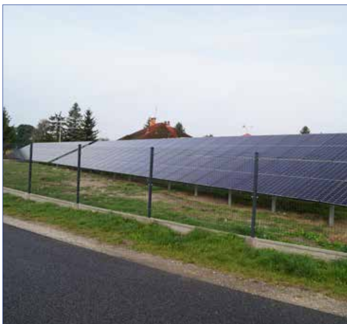
Zielona energia na oczyszczalni ścieków w Dobrem

Łączna moc zamontowanych paneli fotowoltaicznych to ponad 200 kWp. Całkowity koszt zielonej inwestycji wynosi blisko 730 000,00 zł.