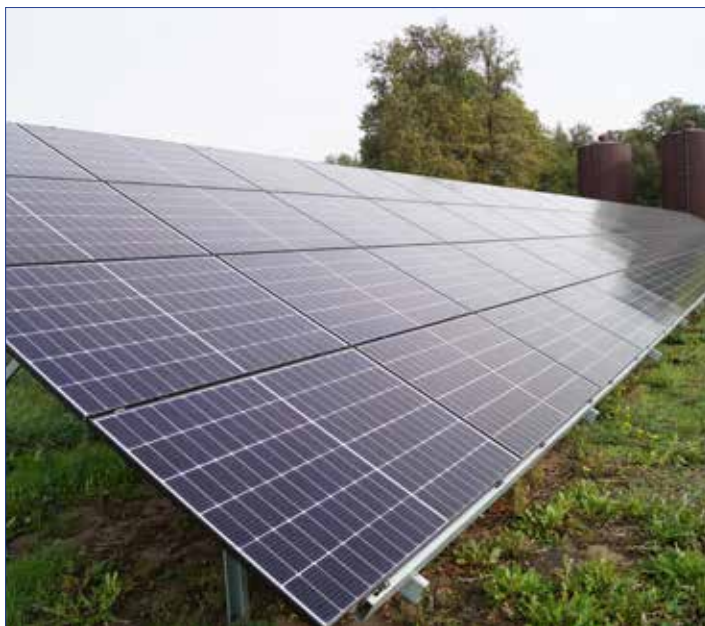
Panele fotowoltaiczne na stacji uzdatniania wody w Dobrem

W ramach przedsięwzięcia sfinansowanego ze środków własnych samorządu zamontowano 5 instalacji fotowoltaicznych. Ogniwa fotowoltaiczne zostały zainstalowane na Stacji Uzdatniania Wody w Byczynie, Stacji Uzdatniania Wody w Dobrem, Stacji Uzdatniania Wody w Krzywosądzcy, na budynkach Urzędu Gminy Dobre oraz na obiekcie Gminnej Oczyszczalni Ścieków w Dobrem.