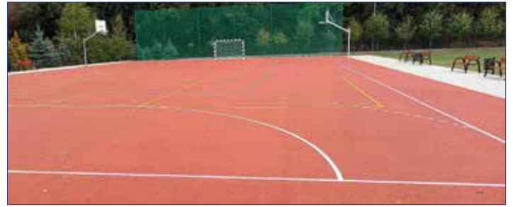
Nowe boisko do gier zespołowych