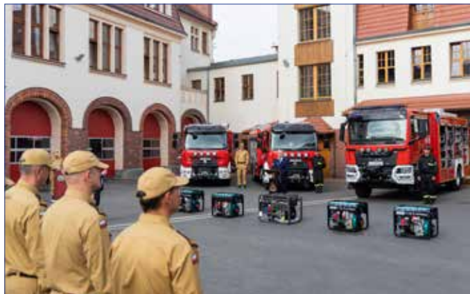
Przekazanie nowego sprzętu pożarniczego jednostkom ratowniczo-gaśniczym

3 października 2023 roku , na placu w Jednostce Ratowniczo-Gaśniczej Nr 1 w Bydgoszczy, strażakom PSP z regionu przekazano nowe pojazdy – średnie, ratowniczo-gaśnicze, z systemem piany sprężonej oraz ciężkie ze zwiększonym potencjałem ratownictwa drogowego. Wszystkie są finałem realizacji Pro-