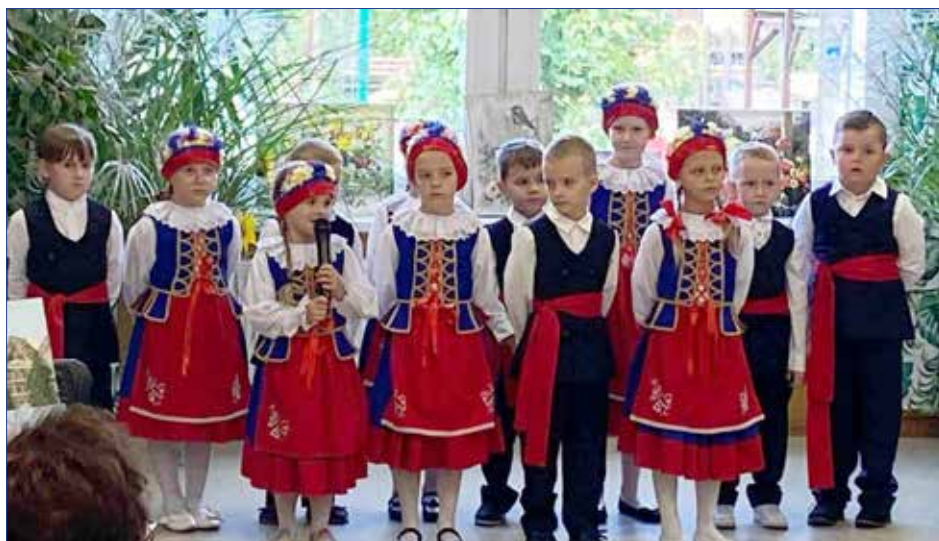
Mali kujawiacy w programie artystycznym