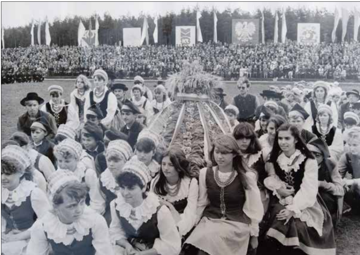
Wieniec dożynkowy – Dożynki Centralne Radziejów 1984 r.