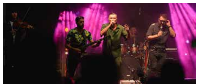
Występ gwiazdy wieczoru

Wierzymy, że wszyscy dobrze się bawili i każdy znalazł atrakcję dla siebie, a naszym mieszkańcom nie zabraknie zapału i determinacji do dalszej współpracy.