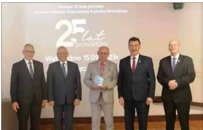
Starosta radziejowski z okolicznościową statuetką

Minutą ciszy uczczono zmarłych samorządowców. Po okolicznościowych wystąpieniach wręczono starostom i prezydentom okolicznościowe statuetki.