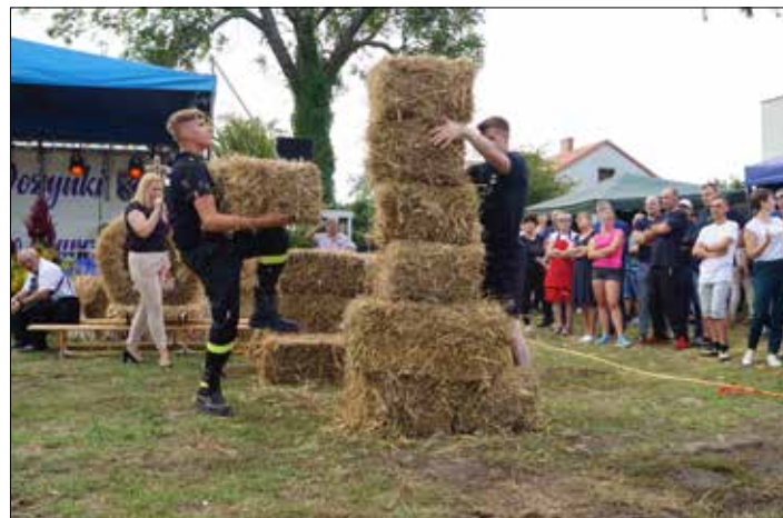
Rywalizacja podczas II edycji turnieju sołeckiego

dożynkowe wykonane były z największą starannością. W konkursie wzięło udział 12 sołectw i wykonano łącznie 45 witaczy. Po długich obradach komisja wyłoniła zwycięzcę: I miejsce i nagrodę 1500 zł otrzymało sołectwo Bronisław za witacz wykonany przy plebanii, II miejsce i nagrodę 1000 zł otrzymało sołectwo Dobre Kolonia , witacz wykonany na przeciwko posesji państwa Wszółek, III miejsce i nagrodę 500 zł otrzymało sołectwo Koszczały za witacz wykonany na polu państwa Makuch.