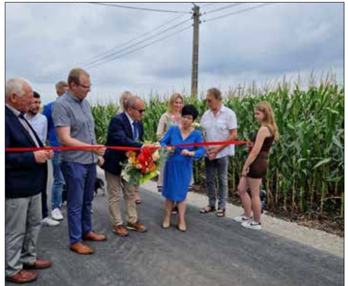
Symboliczne przecięcie wstęgi