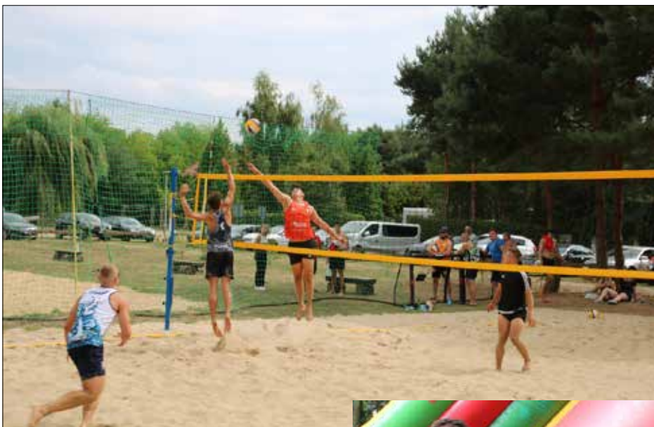
Zawodnicy grali z ogromnym zaangażowaniem i poświęceniem