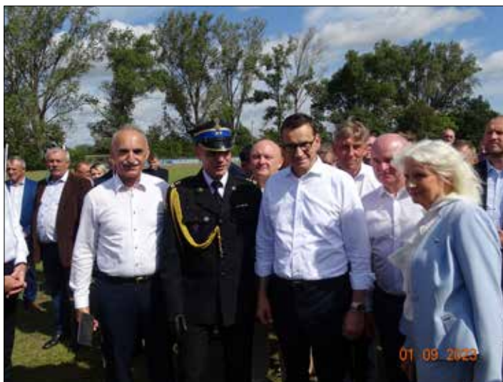
Otwarte spotkanie premiera Morawieckiego z mieszkańcami gminy

Wizyta związana była z inwestycją rozbudowy Szkoły Podstawowej im. Marii Konopnickiej w Morzycach i budowy hali sportowej. Pan premier zobaczył postępy w realizacji budowy hali, która powstaje dzięki programowi Polski Ład. Otrzymał w sumie 14 mln zł z programów rządowych: Polski Ład i Rządowego Funduszu Inwe-