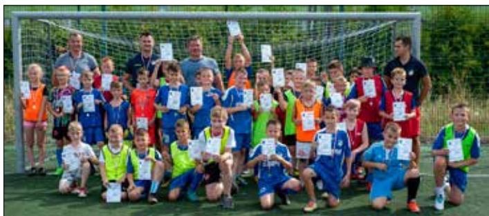
Zawody młodzieżowe na Orliku

O godz. 14.00 na boisku ORLIK rozpoczęły się zawody sportowe dzieci roczników 2012-2016. Po dwóch godzinach emocjonujących zmaganiach, wszyscy najmłodszy otrzymali od burmistrza pamiątkowe medale oraz dyplomy. Organizatorzy na zakończenie przygotowali dla wszystkich kielbasę z grilla.