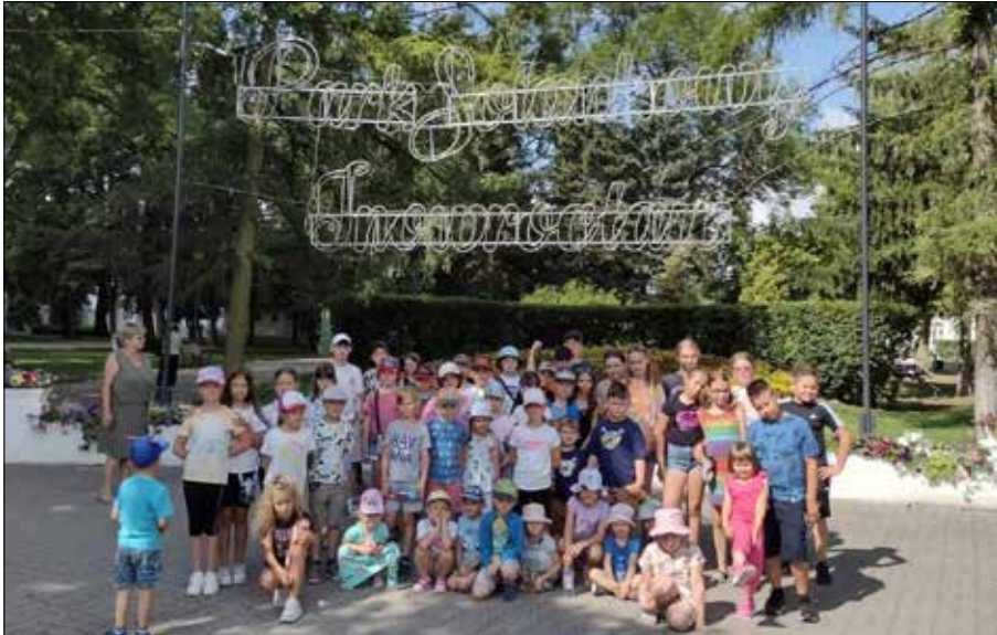
Wycieczka do Inowrocławia

Gminny Ośrodek Kulturalno-Biblioteczny w Skibinie, jak co roku, był organizatorem zajęć wakacyjnych dla dzieci i młodzieży, które otrzymały pozytywną dawkę zabawy, ciekawych warsztatów i wycieczek. W zajęciach uczestniczyło około 70 dzieci, w tym 30 z projektu „Aktywni i zintegrowani w powiecie radziejowskim”.