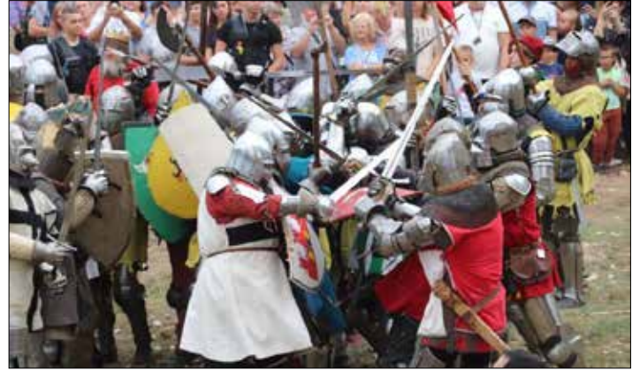
Inszenizacja Bitwy pod Płowcami

Niedzielną inscenizację poprzedziły owocne poszukiwania „Stowarzyszenia Poszukiwawczo-Historycznego Łokietek”, które swoje odkrycia zaprezentowało na stoisku wystawienniczym w dniu inscenizacji. Nie zabrakło również wielu atrakcji dla dzieci i młodzieży oraz licznych stoisk handlowych. Było wesołe miasteczko, a także konkursy z nagrodami sponsorowanymi przez Firmę Wiatrakową EDP Renewables. W części artystycznej wystąpił chór „Mi Alegria” ze Zgłowiączki, a zaraz po nim zespół „Verdis”. Wieczorem przed pu-