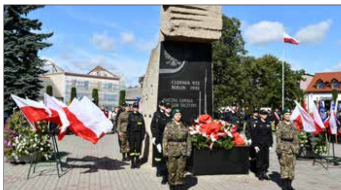
Warta honorowa przy pomniku Chwały Oręża Polskiego