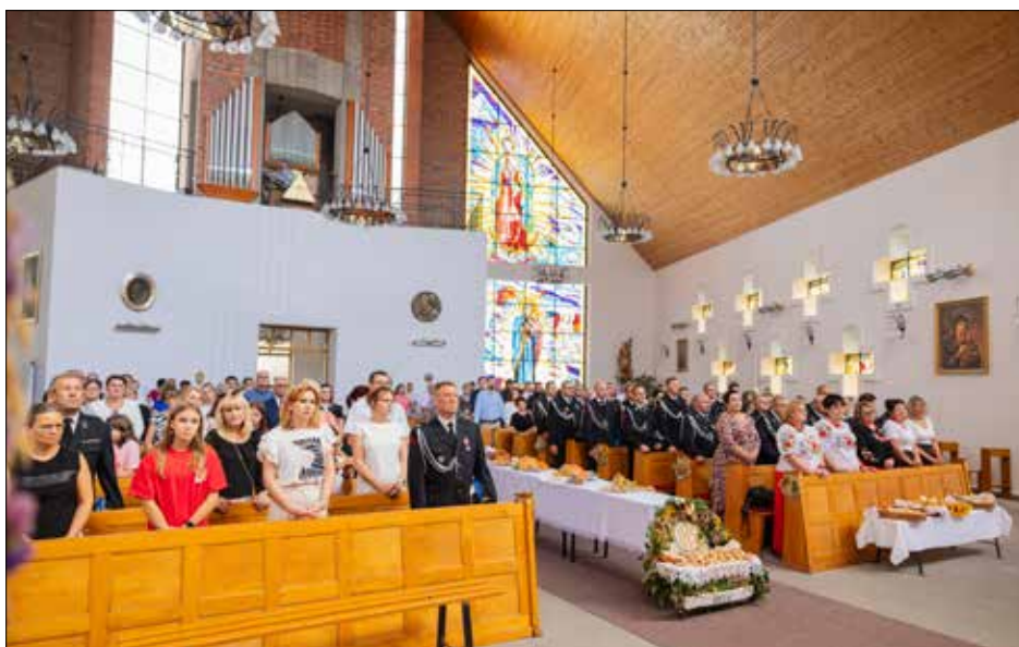
Uroczysta msza dziękczynna

Tekst: Iwona Waszak