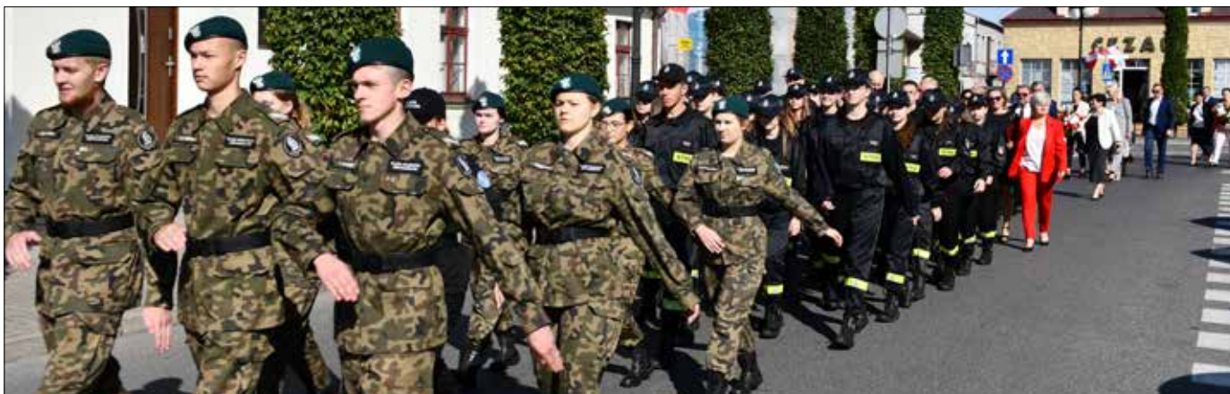
Młodzież z klas mundurowych w przemarszu ulicami Radziejowa