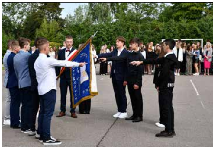
Ślubowanie klas pierwszych – ZSRCKU Przemystka