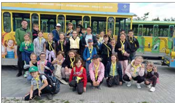
Wycieczka do ZOO w Borysewie

Wakacyjne zajęcia rozpoczęły się od spotkania z policjantkami z Posterunku Policji w Piotrkowie Kujawskim pogadanką na temat bezpieczeństwa