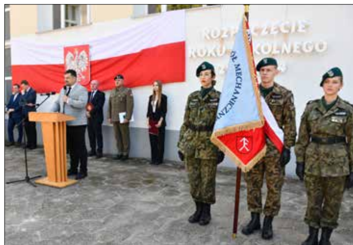
Dyrektor szkoły wita uczniów po wakacyjnej przerwie – ZSM Radziejów