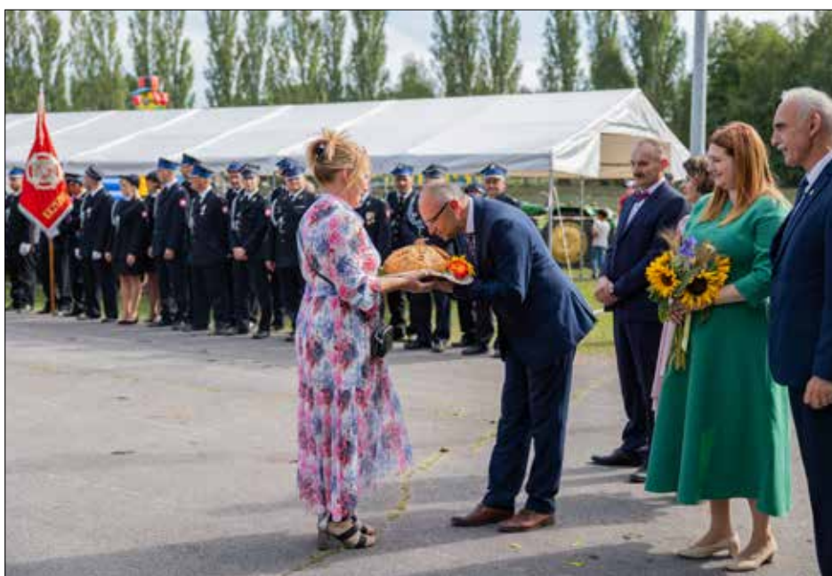
Przekazanie tradycyjnego bochna chleba wójtowi gminy