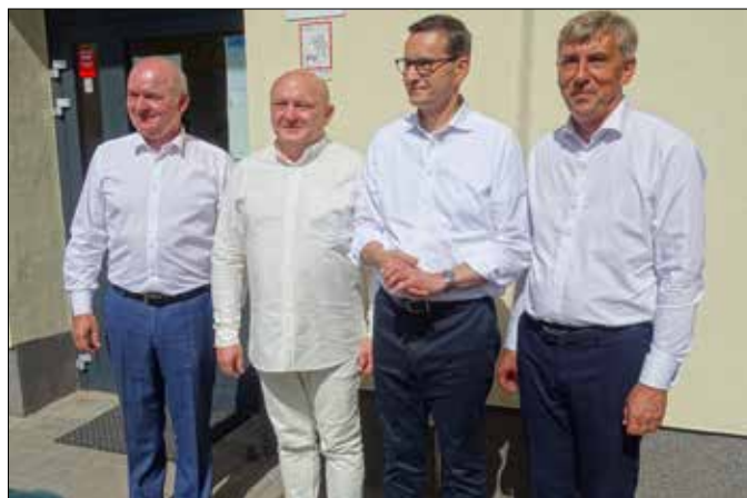
Premier RP w towarzystwie przedstawicieli samorządu powiatowego i gminnego

stycji Lokalnych. Hala widowiskowo-sportowa posiadać będzie pełnowymiarowe boisko umożliwiające grę w siatkówkę, koszykówkę i tenisa. Ponadto w obiekcie znajdować się będzie boisko do piłki ręcznej oraz fuksalu o wymiarach 30 na 20 metrów.