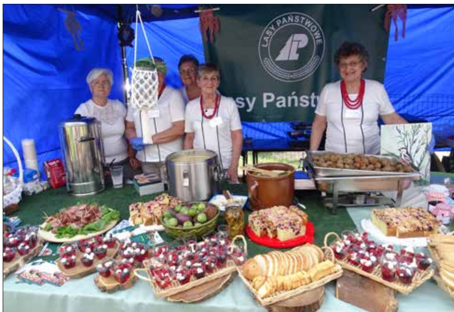
Panie z Koła Gospodyń Wiejskich przy Klubie Seniora w Stróżewie

Specjalnie na tę okazję zostały przygotowane liczne atrakcje dla całych rodzin – pokazy strażackie, wystawa rękodzieła, animacje dla dzieci, pokaz ogni, zabawa taneczna. Gospodynie wiejskie, dzięki wsparciu finansowemu Lasów Państwowych, przygotowały stoisko promujące żywność pochodzenia leśnego. Pięknie udekorowany stół kusił przepysznymi potrawami z dziczyzny i deserami z owocami leśnymi. Uczestnicy pikniku mogli skosztować leśnych przysmaków, tj.: zupy grzybowej, kielbasy z dziczyzny, pulpetów z dziczyzny podanych z kaszą i sosem grzybowym, deserów z owocami leśnymi. Oprócz degustacji przepysznych potraw, panie chętnie dzieliły się przepisami kulinarnymi na dania z wykorzystaniem „darów z lasu”. Promocję Lasów Państwowych wsparło również Nadleśnictwo z Kutna. Pracownicy nadleśnictwa na swoim stanowisku przygotowali dla najmłodszych wiele konkursów o florze i faunie leśnej, m. in. rozpoznawanie gatunków drzew po liściach czy tropów zwierząt leśnych. Na uczestników konkursów czekały nagrody.