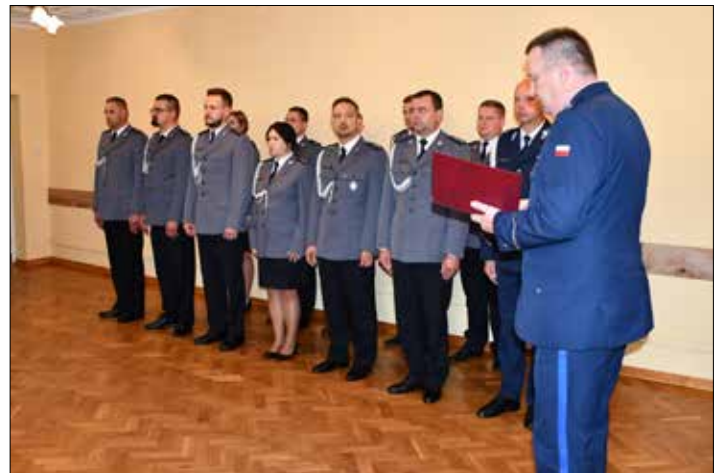
Awanse i wyróżnienia z okazji Święta Policji