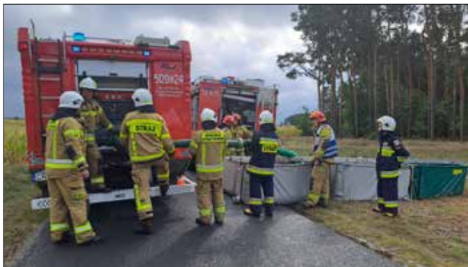
Ćwiczenia plutonu gaśniczego