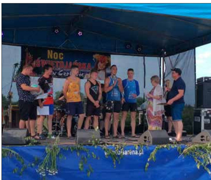
Wszyscy uczestnicy otrzymali dyplomy, a medaliści piłki i okolicznościowe statuetki