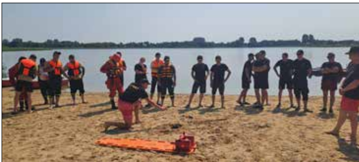
Ćwiczenia z ratownictwa wodnego

Na Jeziorze Głuszyńskim w miejscowości Głuszyn, gm. Bytoń, 20 czerwca br., odbyły się ćwiczenia z zakresu ratownictwa wodnego z terenu powiatu radziejowskiego dysponujących sprzętem pływającym. Celem ćwiczeń było wypracowanie koncepcji