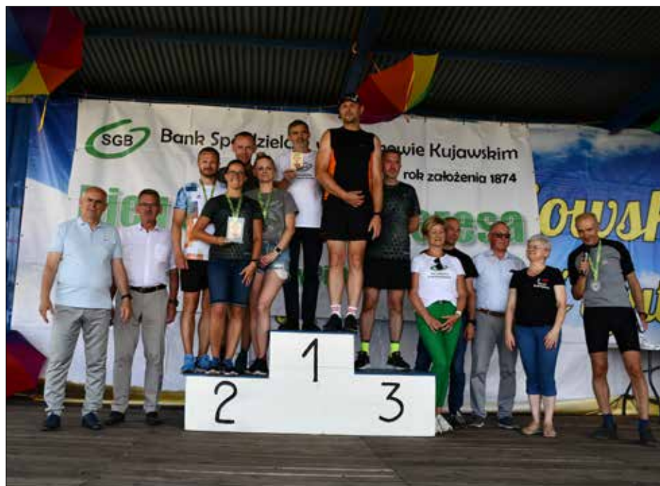
VII Bieg o Puchar Prezesa Banku Spółdzielczego w Piotrkowie Kujawskim