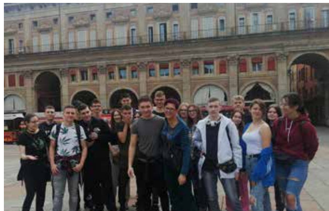
Uczestnicy projektu we Włoszech

W Zespole Szkół Mechanicznych w Radziejowie, 30 marca br., zakończony został drugi projekt z obszaru kształcenia zawodowego, finansowany przez Unię Europejską poprzez program Erasmus+.