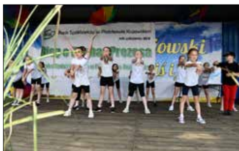
Występ zespołu tanecznego