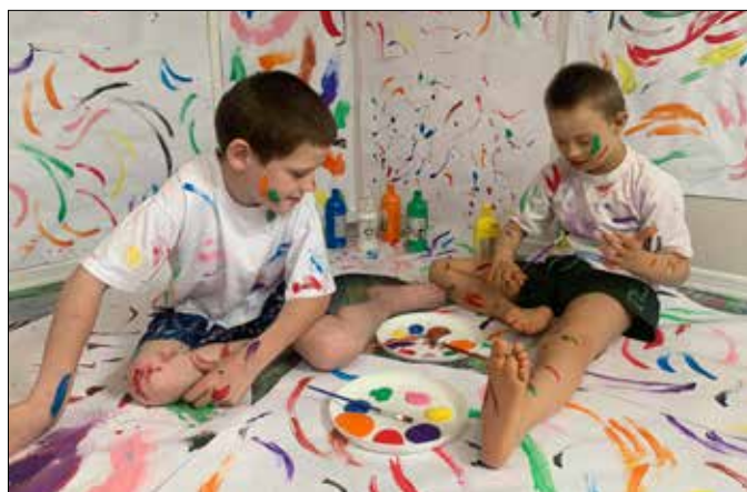
Dzieci chętnie uczestniczyły w zajęciach, brały w nich aktywny udział

Realizacja programu miała wyzwać u dzieci potrzebę naturalnego dążenia do poznawania świata na miarę ich możliwości psychofizycznych oraz naturalną potrzebę obcowania z drugą osobą. Wykazywały się twórczą postawą, dociekliwością i wytrwałością potrzebną do osiągnięcia celu. Rozwijały kreatywne, logiczne i abstrakcyjne myślenie, wyobraźnię, doskonaliły pamięć, koncentrację. Innowacja pedagogiczna „W krainie barw” została zrealizowana i uznana