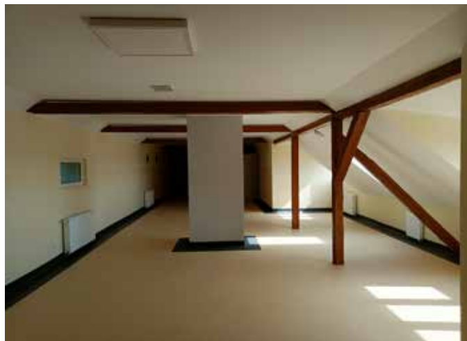
Nowe pomieszczenie jadalni i świetlicy