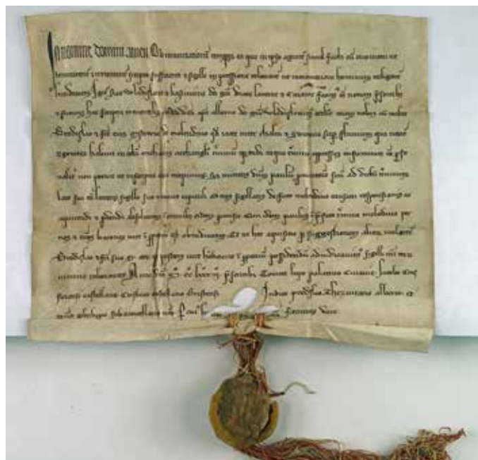
Wyrok książeży z 1282 r. AGAD

XIX stulecie, zwane wiekiem pary i wynalazków, przyniosło powolny zmierzch młynów wodnych. Na tym obszarze spowodował go przede wszystkim niedobór wód, wywołany wycinaniem lasów oraz melioracjami terenów podmokłych. Niejako w zamian nastąpił w tym okresie wyraźny rozwój młynarstwa wietrznego, ale to już temat na odrębny artykuł.