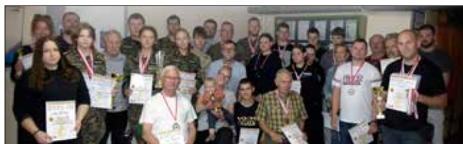
Zwycięzcy zawodów w sześciu konkurencjach

Na strzelnicy w Zespole Szkół Mechanicznych w Radziejowie, 17 czerwca br., odbyły się Otwarte Zawody Strzeleckie o Puchar Starosty Powiatu Radziejowskiego. Celem zawodów było włączenie się w obchody Święta Powiatu Radziejowskiego. Uczestnicy sportowych rozgrywek mieli okazję potrenować celność oka w strzelaniu do tarcz strzeleckich i sprawdzić swoje umiejętności.