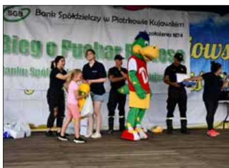
Loteria firmy Danone