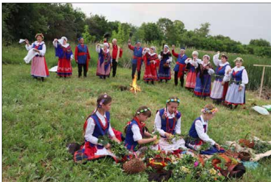
Inscenizacja słowiańskiego obrzędu

Noc świętojańska – najkrótsza noc w roku, zwana także nocą Kupały, już za nami. 17 czerwca w Czołowie przy muzyce i wspólnym biesiadowaniu połączono tradycję z zabawą i świętowano słowiański obrzęd.