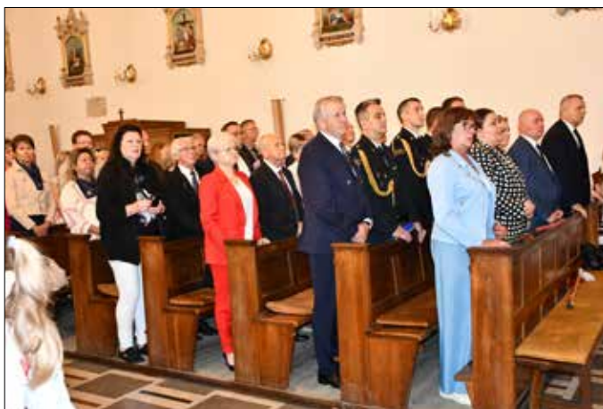
Msza święta w intencji mieszkańców powiatu

Tradycyjnie obchody rozpoczęła msza święta w intencji mieszkańców powiatu, odprawiona w kościele farnym pw. Wniebowzięcia NMP w Radziejowie. Po liturgii zgromadzeni udali się na dziedziniec Liceum Ogólnokształcącego im. Wł. Łokietka, gdzie wzięli udział w drugiej edycji Dnia Integracji pod hasłem „Każdy inny, wszyscy równi”. Celem wydarzenia było szerzenie wśród dzieci zrozumienia i akceptacji osób z niepełnosprawnościami. Na placu poza przybyłymi gośćmi stawiły się delegacje dzieci ze szkół podstawowych z całego powiatu, a także naszych szkół średnich. Na scenie wystąpili podopieczni m.in. Specjalnego Ośrodka Szkolno-Wychowawczego w Radziejowie czy Środowiskowego Domu Samopomocy w Radziejowie. Przedstawili utwory znanych polskich artystów. Dodatkowo na młodszych mieszkańców powiatu czekały atrakcje w postaci dmuchanych zamków, malowania twarzy, tatuaży i wiele innych. Dzieci mogły także skorzystać ze stanowisk Komendy Powiatowej Policji w Radziejowie oraz Komendy Powiatowej Państwowej Straży Pożarnej.