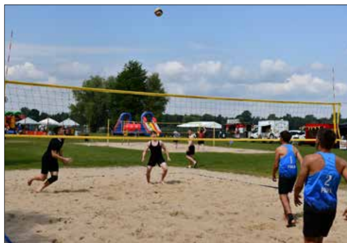
Turniej młodzieżowej siatkówki plażowej