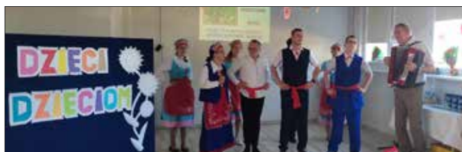
Młodzież śpiewająca w stroju ludowym

Tradycyjnie, od 2000 roku, w taką formę pomocy włączyły się okoliczne szkoły, przedszkola, drużyny harcerskie i inne instytucje, którym bliski jest los w/w uczniów. Organizują one na terenie swoich placówek zbiórki materiałów, które potem przekazują podopiecznym ośrodka. Spotkanie integracyjne podsumowuje akcję oraz jest okazją do wspólnej zabawy i do nawiązywania nowych znajomości. Podczas spotkań wszyscy doskonale bawią się, oglądając występy artystyczne uczniów SOSW w Radziejowie oraz delegacji przybyłych z placówek oświatowych i instytucji, które włączyły się do akcji. (Szczegółowa lista darczyńców ( radziejow.edu.pl )). W dół wdzięczności corocznie przygotowane są dla obdarowujących