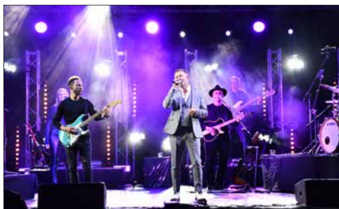
Gwiazdy, które uświetniły piątkowy wieczór na dziedzińcu liceum

Tegoroczne Dni Powiatu były pełne atrakcji. Każdy mógł znaleźć coś dla siebie i miło spędzić czas. Dziękujemy za tak liczne uczestnictwo i już teraz zapraszamy Państwa na kolejne święto powiatu w przyszłym roku! Składamy również serdeczne podziękowania darczyńcom i sponsorom za życzliwość i pomoc.