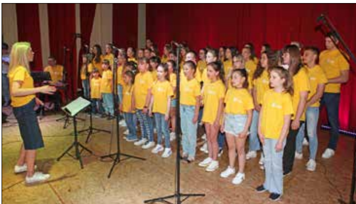
Występ artystyczny wychowanków Akademii Wokalu

4 czerwca był dniem owocującym w liczne atrakcje dla najmłodszych i tych nieco starszych, za sprawą zorganizowanego przez Gminny Ośrodek Kultury Dnia Dziecka.