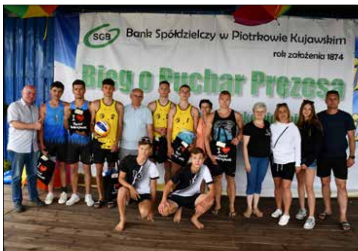
Zawodnicy turnieju piłki plażowej o nagrodę starosty radziejowskiego