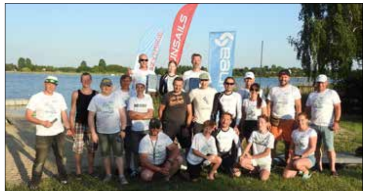
Uczestnicy pierwszych regat windsurfingowe na Jeziorze Głuszyńskim