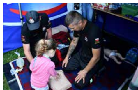
Nagdołańskie WOPR – zasady udzielania pierwszej pomocy