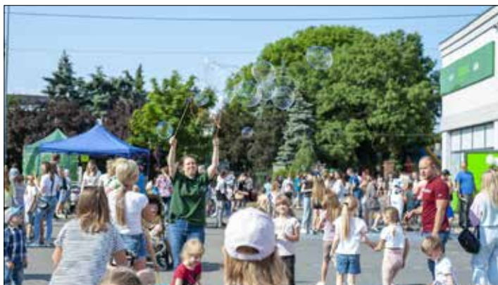
Gry i zabawy dla najmłodszych

W weekend, 3–4 czerwca, w Piotrkowie Kujawskim obchodziliśmy święto wszystkich dzieci – Międzynarodowy Dzień Dziecka. Organizatorami wydarzenia byli: burmistrz Miasta i Gminy Piotrków Kujawski, właściciele sklepu „ŻABKA” w Piotrkowie Kujawskim, Biblioteka i Ośrodek Kultury oraz klub MLKS Zjednoczeni Piotrków Kujawski. Na najmłodszych czekały liczne atrakcje i niespodzianki.