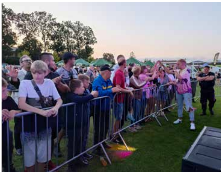
Koncert zespołu BAJOREK

Tekst: Natalia Szatkowska