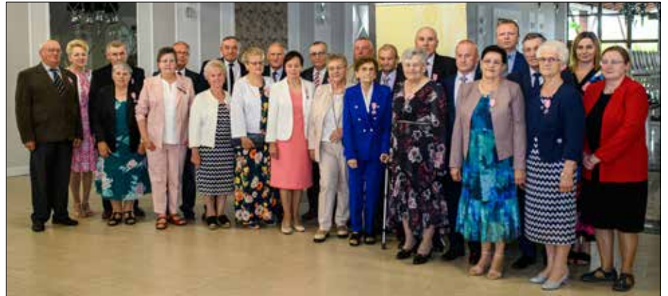
Jubilaci z przedstawicielami Urzędu Gminy w Osiecinach