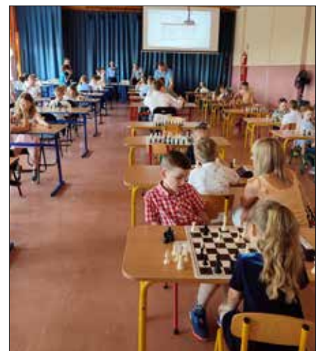
Turniej szachowy dla dzieci