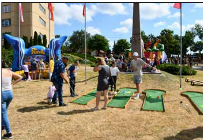
Dzień integracji Każdy inny, wszyscy równi

Równocześnie trwał piknik edukacyjny. Ogłoszono wyniki konkursu na opracowanie logo powiatu wraz ze spotem promującym powiat radziejowski. Brali w nim udział uczniowie klas IV–VI szkół podstawowych. Uczestnicy i laureaci dostali podziękowania za pomysłowość oraz zostali nagrodzeni za pierwsze trzy miejsca dronami dla swoich szkół. Uczniowie otrzymali upominki. I miejsce zdoby-