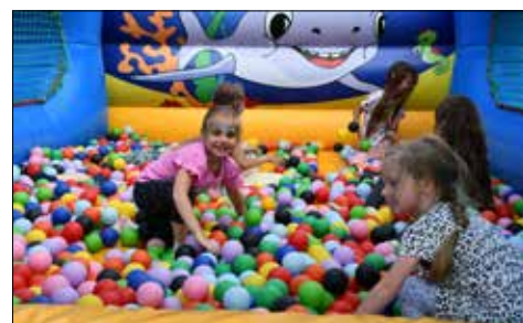
Dmucane atrakcje dla dzieci