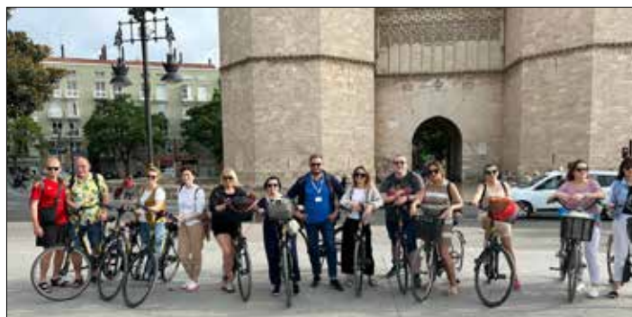
Walencja – wycieczka rowerowa

Nie zabrakło również atrakcji i czasu wolnego, a Walencja jest tak pięknym miastem o bogatej historii i tradycji, że nie sposób było się nudzić. W towarzystwie lokalnych przewodników uczestnicy mobilności zwiedzili Miasteczko Sztuki i Nauki, dawną Giełdę Jedwabiu, Katedrę, Mercado Central czyli modernistyczny Targ Główny Walencji, miasteczko El Palmar znane z plantacji ryżu i hodowli węgorki. W czasie wycieczki rowerowej po tym rozległym mieście, odwiedziliśmy jego ciekawe zakątki. Nie można wyjechać z Walencji bez