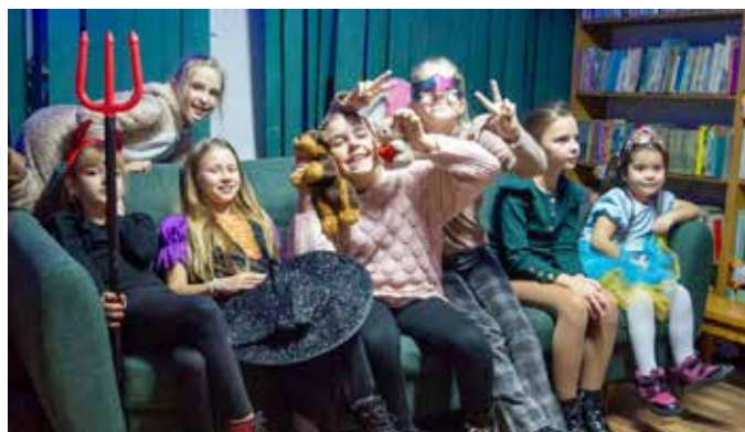
Wieczór przebiegał w wesołej atmosferze

Pierwsza grupa dzieci rozpoczęła zabawę od wspólnego tańca do piosenki „Duchy tu są”. Następnie zainicjowano wróżby, specjalnie przygotowane na tę okazję – kubeczki, a każdy wylosowany przedmiot miał swój symbol dla losującego, serce z imionami i losy: „Kim będę w przyszłości?” i „Czy wiesz, że...?” W tej edukacyjnej zabawie dzieci dowiedziały się skąd pochodzi zwyczaj andrzejkowy, co oznacza imię Andrzej i wiele innych ciekawych informacji. Była galeria wizażu, andrzejkowe kalambury, które wniosły wiele radości i kreatywności i znany taniec Lambada. Nie zapomniano o tradycyjnym laniu wosku przez srebrny „magiczny” klucz. Każdy uczestnik zabrał do domu swoją woskową figurkę. Uczestnicy zabawy wyszli z propozycją zorganizowania tanecznego wyzwania – chętne dzieci wykonywały własny układ choreograficzny do znanych utworów muzycznych. Na wszystkich czekał wspólny positek.