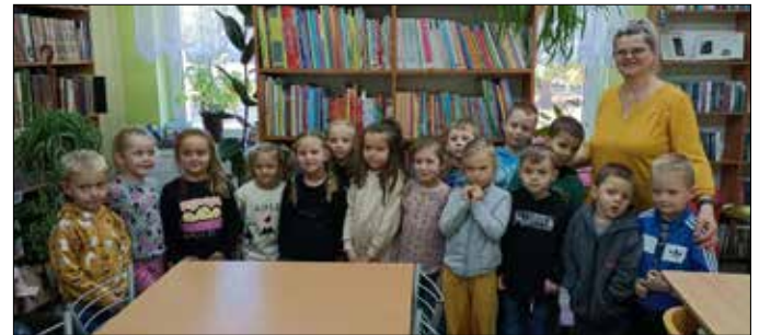
Zapoznanie się z księgozbiorem biblioteki w Płowcach

Spacer ścieżkami historii rozpoczęliśmy od pomnika, upamiętniającego bitwę pod Płowcami. Najmłodszy dowiedzieli się o królu Łokietku, Krzyżakach i rycerzach, walczących na płowieckim polu bitewnym. Następnie spacerkiem przeszliśmy na cmentarz rycerski, gdzie dzieci zobaczyły kamień, w którym, według legendy, strudzony po skończonej bitwie król Łokietek obmył miecz i ręce oraz wysłuchały legendy o stawie „Wdowina”.