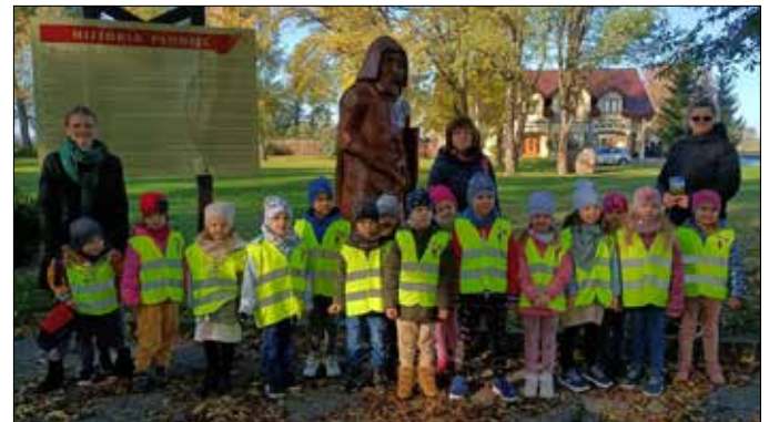
Spacer po polach bitewnych