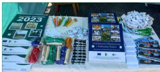
Gadżety dla uczestników na stoisku LGD