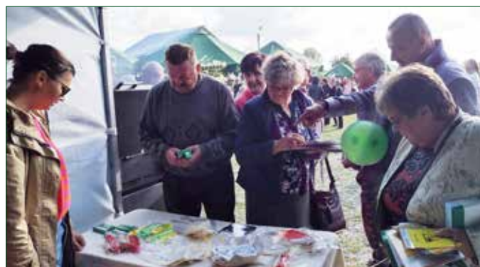
Dożynki w sołectwie Kwilno-Kłonówek