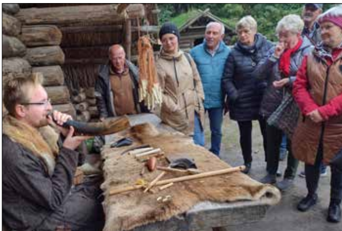
Zwiedzanie Muzeum Archeologicznego w Biskupinie