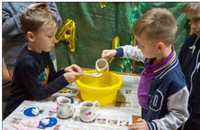
Tradycyjne andrzejkowe lanie wosku

29 listopada w piotrkowskiej bibliotece odbyła się zabawa andrzejkowa. Dzieci powitały wróżki: Szczęścia, Kolorowych Snów i Cyganka. Bardzo dziękujemy naszym wspaniałym gościom i cieszymy się, że razem bierzemy udział w kultywowaniu tradycji, która jest ogromną wartością, a przy okazji dobrą zabawą.