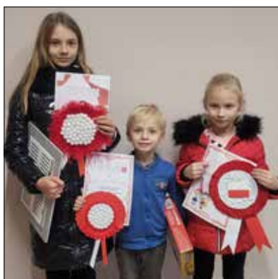
Nagodzeni w konkursie na Kotylion Niepodległościowy

Tekst: Natalia Szatkowska