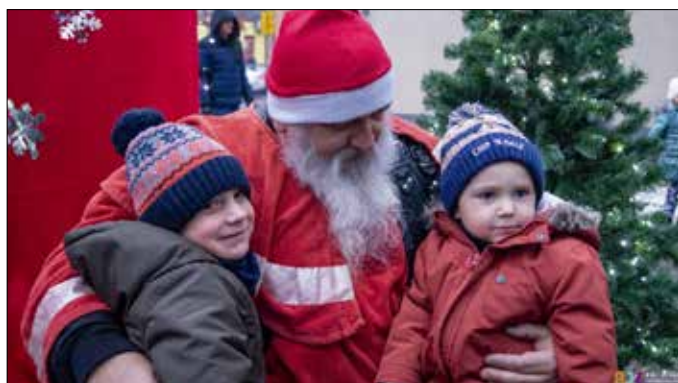
Pamiątkowe zdjęcie ze zmotoryzowanym Mikołajem

Dziękujemy za wsparcie przy organizacji tego wydarzenia: burmistrzowi, radnym Rady Miejskiej w Piotrkowie Kujawskim oraz członkom klubu motocyklowego Born To Ride MC Poland oddział Piotrków Kujawski.