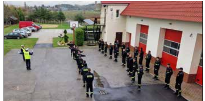
Podczas szkolenia OSP

1. 12 listopada 2022 roku komisja egzaminacyjna powołana przez Komendanta Powiatowego PSP w Radziejowie przeprowadziła egzamin końcowy szkolenia podstawowego strażaka ratownika OSP. Jego celem było przygotowanie członków OSP do wykonywania podstawowych czynności ratowniczych (gaśniczych, prawnego i bezpiecznego wykonywania podstawowych czynności ratowniczych, sprawnego i bezpiecznego wykonywania zadań podczas prowadzenia łączności na sieciach radiowych UKF PSP). Zrealizowano również szkolenie doskonalące dla strażaków KSRG z zakresu współdziałania z SP ZOZ Lotnicze Pogotowie Ratunkowe. Szkolenie obejmowało 133 godziny zajęć teoretycznych i praktycznych. Ponadto strażacy uczestniczący w szkoleniu przeszli testy w komorze dymowej, znajdującej się w Ośrodku Szkolenia KW PSP w Toruniu. Egzamin pozytywnie ukończyło 33 druhów (w tym 5 druhen), strażacy w znaczący sposób wzmacniają szeregi podziału bojowego poszczególnych jednostek OSP z terenu powiatu radziejowskiego.