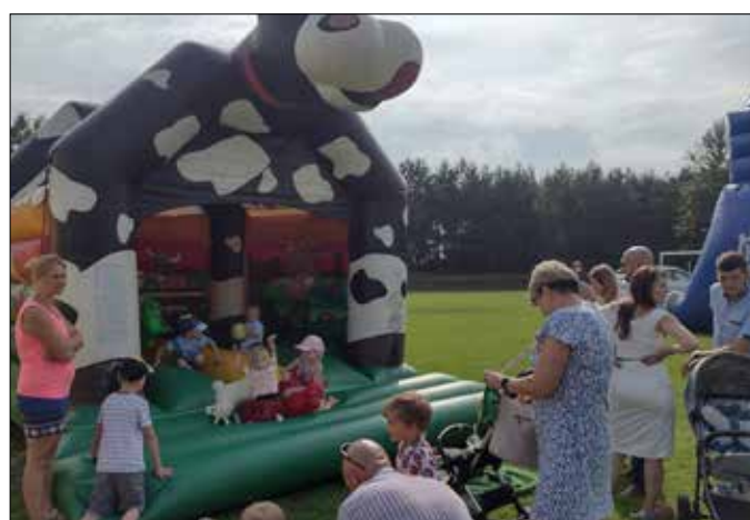
Dożynki gminno-parafialne w Dębiankach - zjeżdźalnie dla dzieci