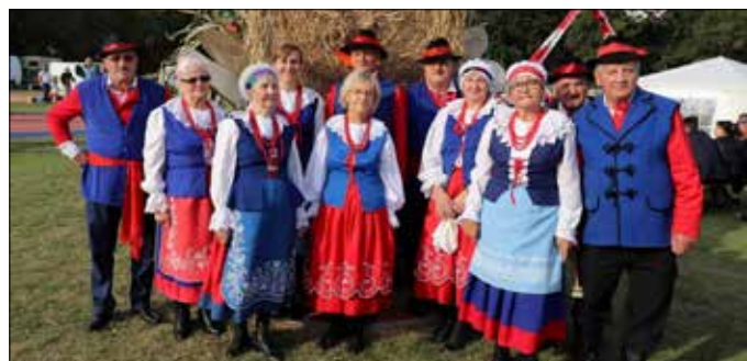
Zespół Pieśni i Tańca „Kujawy”

Podczas swojej działalności zespół brał udział w przeglądach folklorystycznych, organizowanych w: Bydgoszczy, Ciechocinku, Kazimierzu Dolnym, Włocławku, Golubiu Dobrzyńskim, zdobywając tam liczne nagrody i wyróżnienia. Najbardziej prestiżową nagrodą była nagroda otrzymana w 1977 r. w Kazimierzu Dolnym na Ogólnopolskim Festiwalu Kapel i Śpiewaków Ludowych. Potem Grand Prix w 2007 r. na Międzywojewódzkim Przeglądzie Folklorystycznym w Bydgoszczy. Wspomnieć należy, że zespół nie tylko występował na festiwalach w Polsce, ale również wyjeżdżał za granicę. W 2004 r. występował z serią koncertów „Szlakiem Bursztynowym” na Litwie i Łotwie.