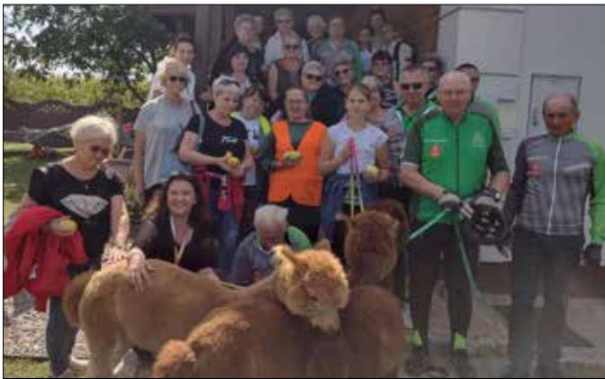
Wizyta w punkcie rekreacyjno-terapeutycznym „Puchate Niebo” na trasie rajdu rowerowego