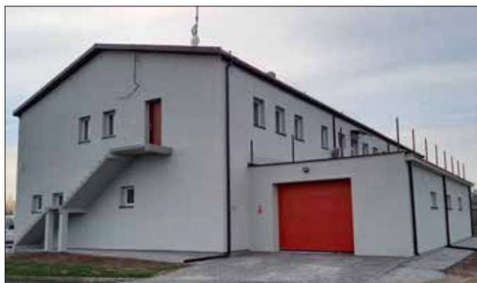
Budynek remizy po rozbudowie

Jednostka OSP Orle jest wpisana do Krajowego Systemu Ratowniczo-Gaśniczego. Ze względu na bliskość jeziora i duży napływ turystów w okresie letnim posiada w wyposażeniu łódź do ratownictwa wodnego. Rozbudowa budynku remizy będzie miejscem