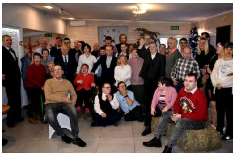
Podopieczni radziejowskiego ŚDS-u

Tekst: Marta Tomaszewska