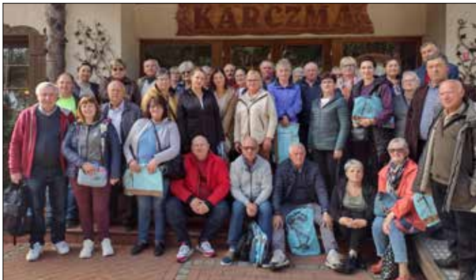
Uczestnicy wizyty studyjnej w Osadzie Karbówku