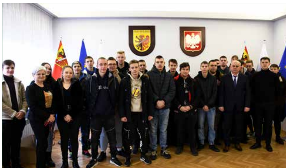
Młodzież w towarzystwie starosty