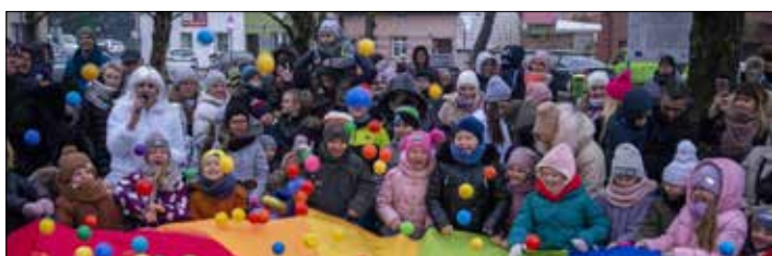
Zabawa z animatorem

Dzieci wraz ze Śnieżynką bawiły się przy dźwiękach świątecznej muzyki. Na rozgrzewkę milusińscy mogli skosztować gorącej czekolady oraz pierniczków i słodyczy. Nie zabrakło wspólnego ubierania choinki oraz wręczania prezentów przez Świętego Mikołaja. Przez cały ten czas towarzyszyli nam motocykliści z klubu Born To Ride MC Poland, którzy przywieźli ze sobą słodkie upominki. Święty Mikołaj przyjmował od dzieci ich świąteczne życzenia i chętnie stał do wspólnego pamiątkowego zdjęcia.