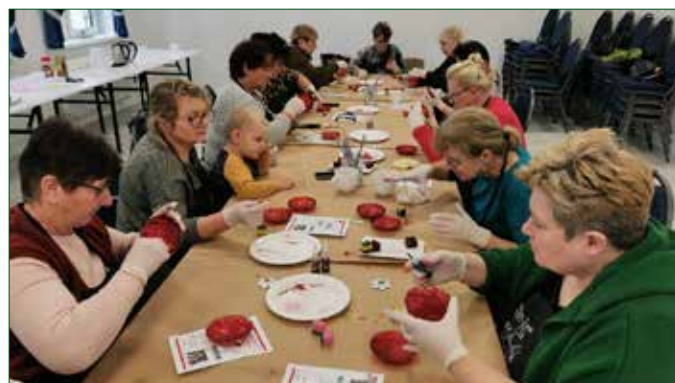
Uczestnicy warsztatów decoupage w Znaniewie