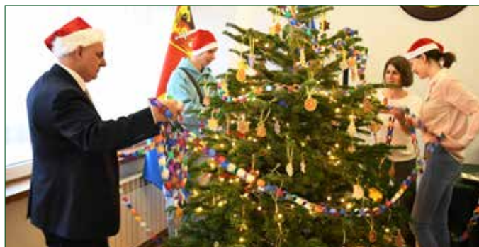
Zielone drzewko w świątecznej szacie