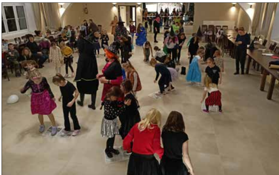
Andrzejkowy konkurs taniec na gazecie

Radosnych i spokojnych Świąt Bożego Narodzenia, spędzonych w gronie najbliższych, w miłości, radości i ciepłej atmosferze.