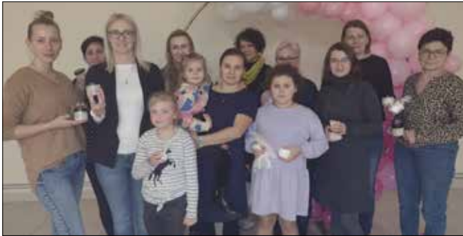
Uczestnicy warsztatów kosmetycznych w Czamaninie