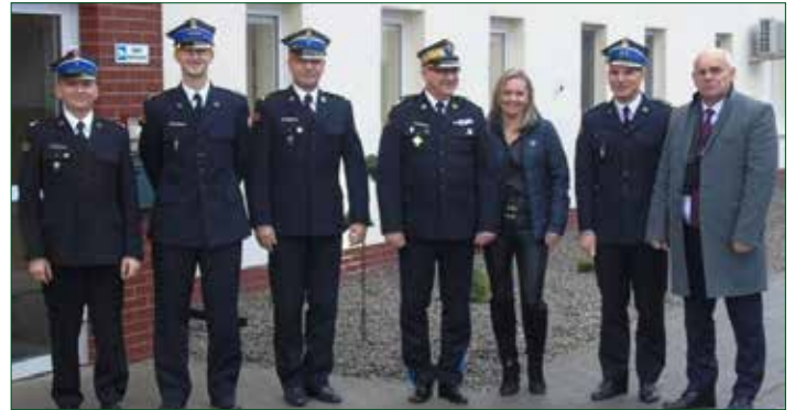
Spotkanie starosty z przedstawicielami PSP

Podziękowania za zaangażowanie w modernizację budynku komendy złożył Komendant Powiatowy Państwowej Straży Pożarnej bryg.