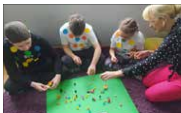
Zabawa na dywanie

Tego dnia najmłodszy uczniowie mieli ubrania w kropki. Sale lekcyjne również wypełnione były kolorowymi kropkami. Uczniowie oglądali film o małej Vashti. Powstały także „kropkowe” dzieła sztuki. Były również zabawy przy piosence „O kropce”. Na koniec dzieci otrzymały okrągłą słodką niespodziankę. Był to wspaniały i niezapomniany dzień. Wywołał dużo radości i uśmiechów.