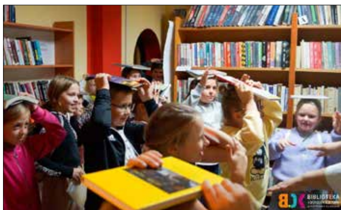
„Ćwiczenia” z książką

Noc Bibliotek już za nami. 5 października 2022 w piotrkowskiej bibliotece odbyła się 8. ogólnopolska edycja tego wydarzenia pod hasłem „To się musi powieść...”