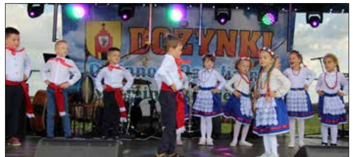
Przedszkolaki ze Skibina

gospodarzowi gminy i proboszczowi parafii, którym – zgodnie z tradycją – podzielono się przybyłymi gośćmi. Słowo o chlebie przygotowała młodzież ze Szkoły Podstawowej im. Władysława Łokietka w Płowcach, a obrzęd dożynkowy przedstawił zespół „Kujawy” z Radziejowa. Po przemówieniach gospodarza gminy i zaproszonych gości, scenę opanowały dzieci z Przedszkola Gminnego w Skibinie, a następnie młodzież ze Szkoły Podstawowej im. Kazimierza Wielkiego z Bieganowa.