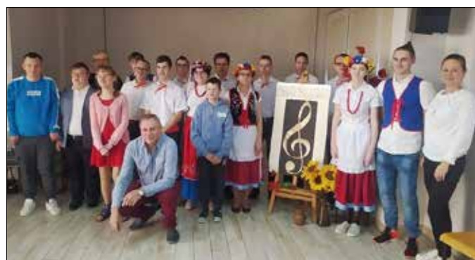
Był to ciekawy dzień, rozbrzmiewający muzyką.

Muzyka jest wszędzie – łagodzi obyczaje, rozwesela i relaksuje. 7 października 2022 r. obchodzimy Międzynarodowy Dzień Muzyki, ustanowiony po raz pierwszy w 1975 r. z inicjatywy amerykańskiego wirtuoza skrzypiec i dyrygenta Yehudiego Menuhina. Specjalny Ośrodek Szkolno-Wychowawczy w Radziejowie włączył się w uroczystości celebrowane ten dzień. Społeczność szkoły wysłuchała koncertu muzycznego w wykonaniu gości z Miejskiego Zespołu Szkół w Radziejowie oraz Szkoły Muzycznej w Radziejowie. Wystąpili również gospodarze, prezentując repertuar kujawski.