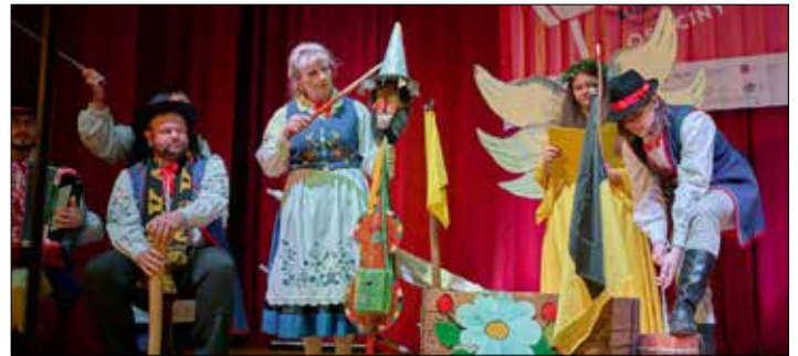
Fragment występu scenicznego