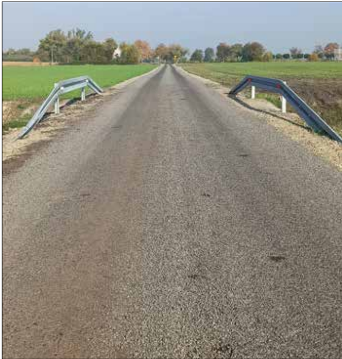
Fragment drogi po przebudowie