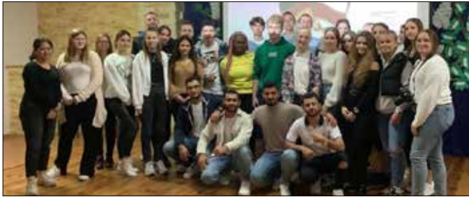
Wspólne zdjęcie uczestników młodzieżowego spotkania