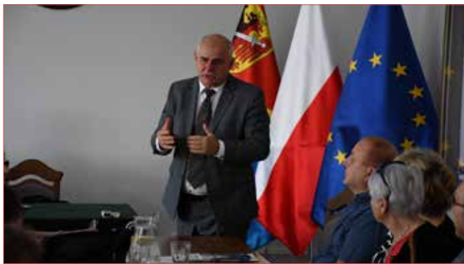
Gospodarz powiatu powitał zebranych studentów-seniorów