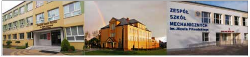
Powiatowe szkoły średnie

Zespół Szkół Rolnicze Centrum Kształcenia Ustawicznego w Przemystce utworzył 5 nowych klas, w których uczy się 132 nowych uczniów. Młodzież ma możliwość kształcić się w zawodach: technik ekonomista, technik spedytor, technik rolnik, technik mechanizacji rolnictwa i agrotechniki, technik żywienia i usług gastronomicznych oraz technik hotelarstwa. Nadal w Przemystce funkcjonuje liceum ogólnokształcące z innowacją pożarnictwo i ratownictwo medyczne.