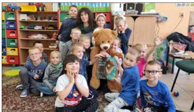
Uczestnicy spotkania z pluszowym przyjacielem

Z inicjatywy Polskiej Izby Książki w 2001 roku 29 września ogłoszono Ogólnopolski Dzień Głośnego Czytania. Patronką wybrano wybitną pisarkę książek dla dzieci Janinę Porazińską. Celem święta jest propagowanie czytelnictwa wśród najmłodszych.