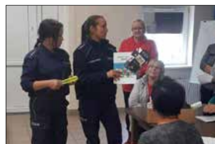
Seniorzy z zainteresowaniem wysłuchali pogadanki

kładu Ubezpieczeń Społecznych „Bezpiecznie, zdrowo, bezgotówkowo”. Policjantki zapoznały uczestników spotkania z zasadą bezpiecznych form korzystania z bankowości elektronicznej, stron internetowych czy robienia zakupów w „sieci”. Seniorzy dowiedzieli się, jak mogą wygłądać fałszywe pisma, wysyłane do nich drogą elektroniczną przez oszustów, którzy chcą wyłudzić dane. Przypomniły też, że zasada „ograniczonego zaufania” do nieznanym obowiązuje także dorosłych, którzy często o niej zapominają, stając się ofiarami oszustów. Na zakończenie policjantki rozdały uczestnikom spotkania odbłaski i ulotki.