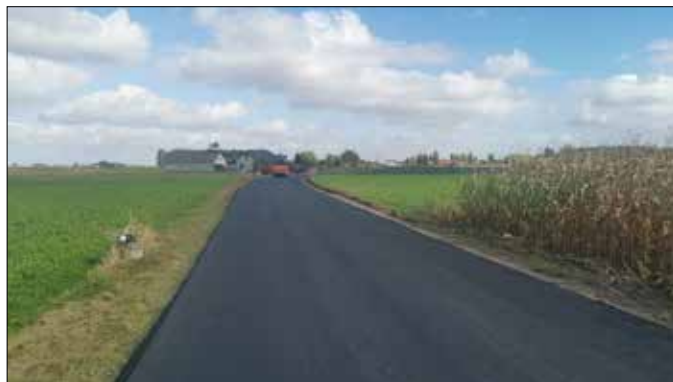
Ułożona pierwsza warstwa asfaltu na drodze gminnej 180103C Morawy – Narkowo

sny samorządu, który stanowi 5% wartości całego przedsięwzięcia. Zakończenie inwestycji przewidziano na październik przyszłego roku.