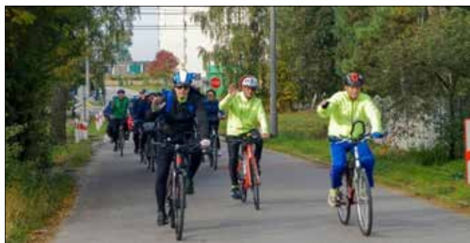
Na trasie rajdu