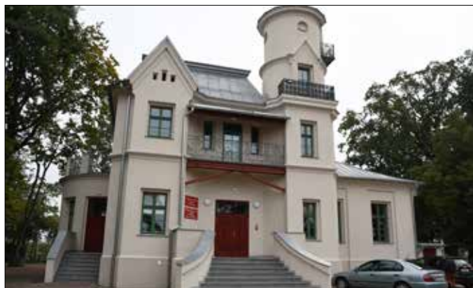
Główne wejście do pałacu, w którym mieści się filia szkoły muzycznej