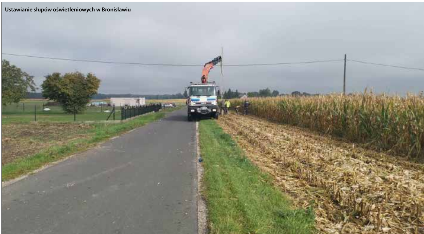
Ustawianie słupów oświetleniowych w Bronisławiu