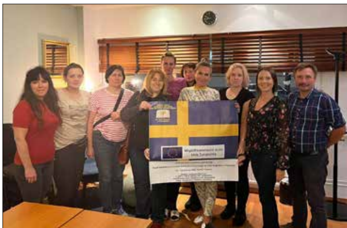
Nauczyciele z „Przemystki” uczestniczący w szwedzkim spotkaniu