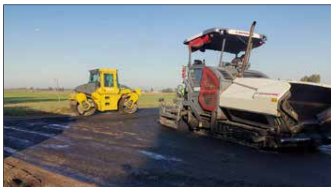
Układanie pierwszej warstwy asfaltu na drodze gminnej 180109C Kobielice – Smarglin