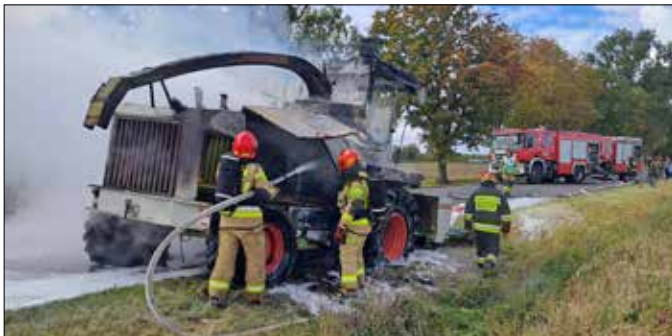
Gaszenie płonącej maszyny rolniczej

1. 22 września 2022 r. o 12:10 SKKP przyjęło zgłoszenie o pożarze siewczkarni samojezdnej Claas Jaguar na drodze krajowej DK 62 w Płowcach Drugich. Na miejsce przybył patrol policji. Kierujący opuścił pojazd przed przybyciem straży pożarnej, nie odniósł żadnych obrażeń. Miejsce zdarzenia zabezpieczono pod względem ppoż. Ruch został zablokowany w obu kierunkach, Policja wyznaczyła objazdy. Działania zastępów polegały na podaniu jednego prądu piany ciężkiej i jednego prądu wody w natarciu na palący się pojazd. Po ugaszeniu, maszyna została odholowana na teren pobliskiej posesji. Dalsze działania zastępów polegały na uprzątnięciu drogi z pozostałości konstrukcyjnych uszkodzonej maszyny oraz zneutralizowaniu rozlanych na drogę płynów eksploatacyjnych. Ze względu na uszkodzenia w infrastrukturze drogowej na miejsce zdarzenia został zadysponowany przez SKKP PSP w Radziejowie przedstawiciel zarządcy drogi. Na miejscu działały zespoły ratownicze z PSP Radziejów oraz OSP Osiećciny.