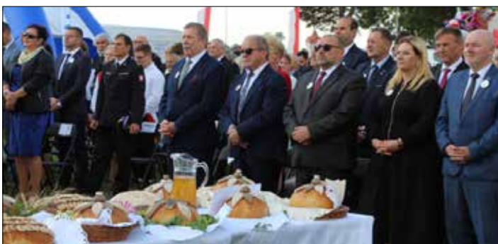
Gospodarze i goście dożynkowej uroczystości