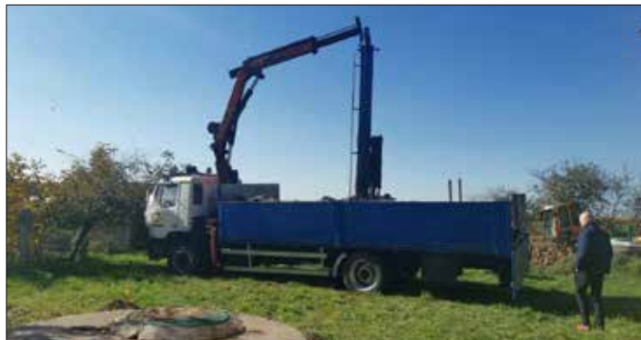
Wiercenie studni dla SUW w Byczynie

Przebudowa stacji uzdatniania wody w Byczynie wraz z budową studni, przebudowa stacji uzdatniania wody w Dobrem, zakup samochodu asenizacyjnego niezbędnego do opróżniania szamb oraz modernizacja kanalizacji sanitarnej na terenie gminy Dobro – to zakres inwestycji, na którą gmina pozyskała środki z pierwszej edycji Programu Inwestycji Strategicznych. Całkowita wartość projektu to 4 000 000,00 zł. Na sfinansowanie inwestycji gmina otrzymała środki zewnętrzne w kwocie 3 800 000,00 zł. Pozostała kwota to wkład wła-