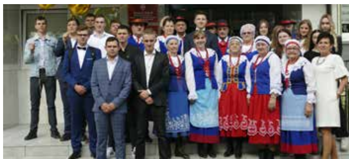
Młodzież szkolna z zespołem folklorystycznym „Kujawy”