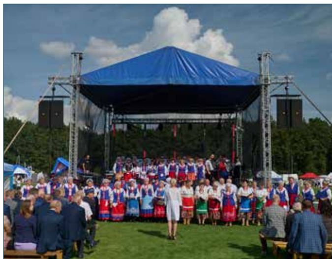
Wspólny występ zespołów folklorystycznych