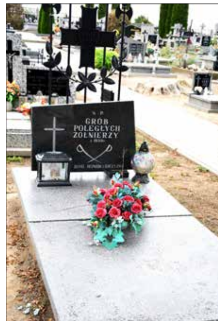
Mogiła żołnierzy z 1939 r. na cmentarzu w Witowie