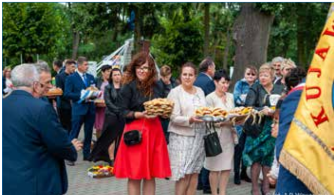
Mieszkańcy gminy w dożynkowym korowodzie

W niedzielę, 11 września w piotrkowskiej gminie obchodziliśmy dożynki gminno-parafialne. Święto przebiegło zgodnie z kujawską tradycją. Rolnicy podziękowali za plony i poczęstowali gości chlebem pieczonym z tegorocznych zbóż.