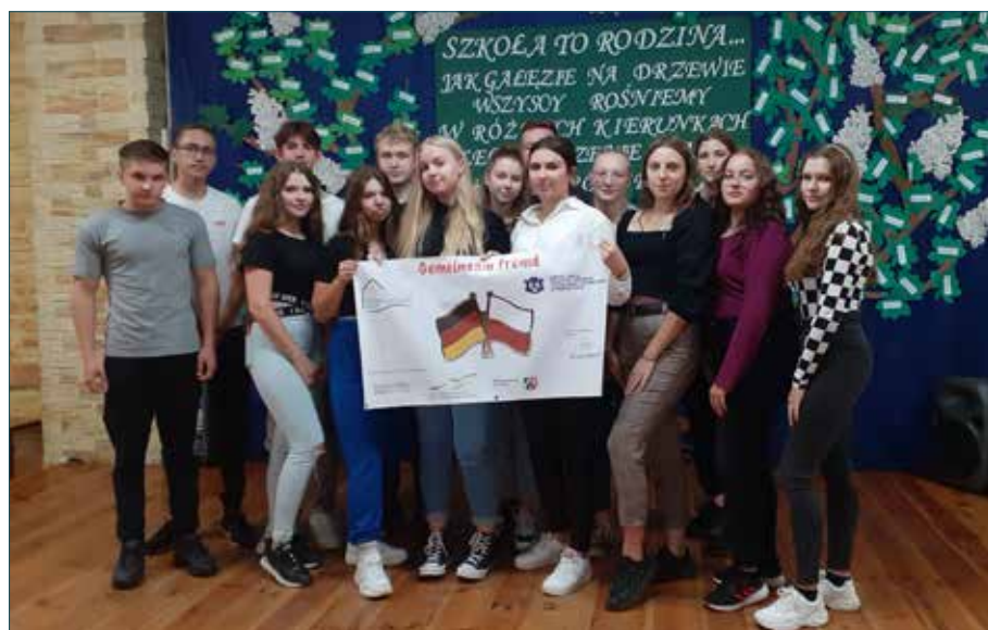
Młodzież biorąca udział w wymianie

Tekst/Foto: Magdalena Korzeniewska-Duszek