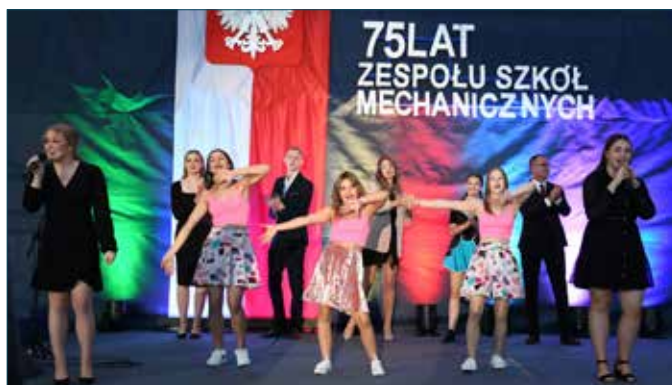
Część artystyczna uroczystej akademii