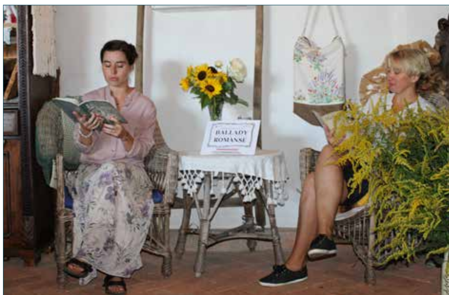
Lektorki tegorocznej akcji Narodowego Czytania