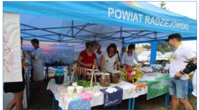
Stoisko gastronomiczne ze smakołykami kuchni kujawskiej