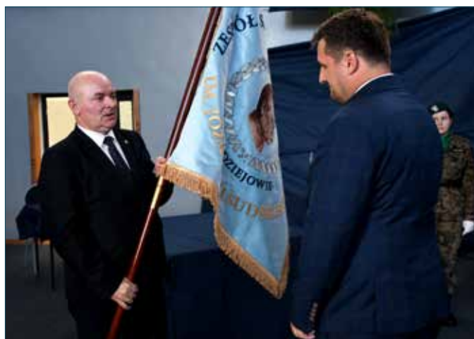
Przekazanie nowego poświęconego sztandaru