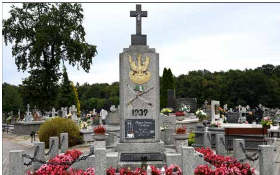
Pomnik poświęcony bohaterom za wolność i Ojczyznę (cmentarz w Osiecinach)