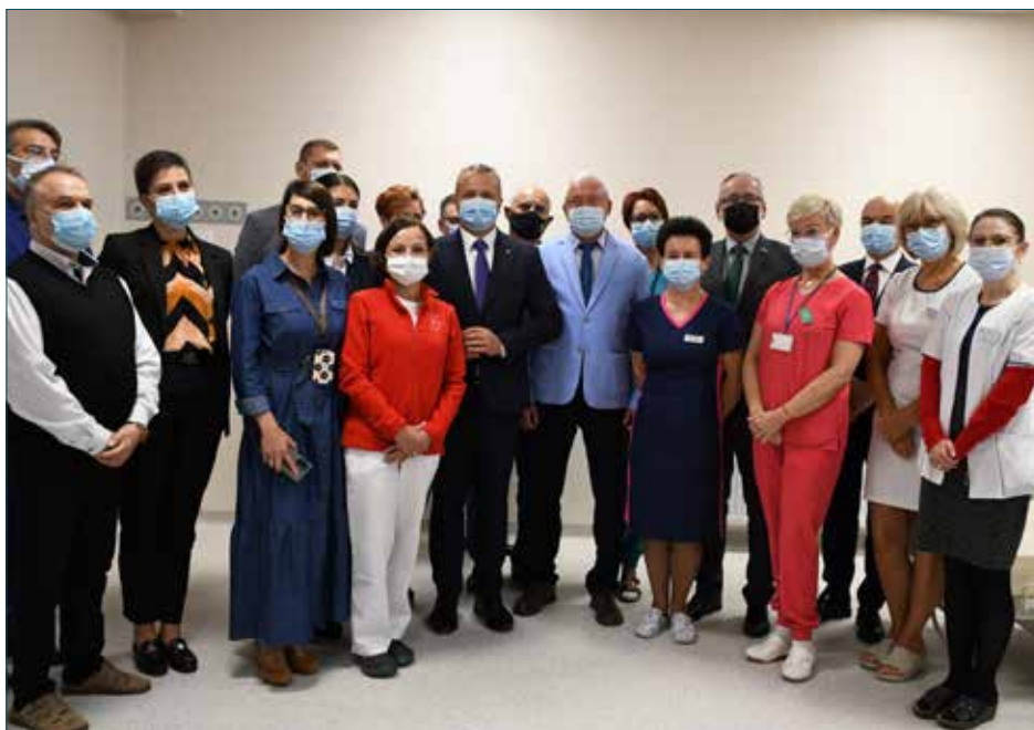
Pracownicy radziejowskiej lecznicy z ministrem zdrowia oraz przedstawicielami samorządu