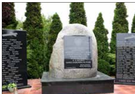
Tablica upamiętniająca poległych w walce za Ojczyznę mieszkańców gminy Radziejów (Czołowo)