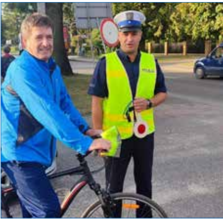
Jesteś widoczny – jesteś bezpieczny!

Mundurowi połączyli siły z uczniami i wspólnie przy szkole rozdawali odbłaski. Działania te wpisują się w ogólnopolską akcję informacyjno – edukacyjną pod nazwą „Świeć przykładem”.