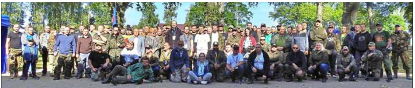
Badacze tajemnic pola bitwy z 1331 r.

Tekst/Foto: Stowarzyszenie Poszukiwawczo-Historyczne „Łokietek”