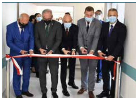
Symboliczne przecięcie wstęgi

Symbolicznego przecięcia wstęgi dokonali: minister Adam Niedzielski, starosta