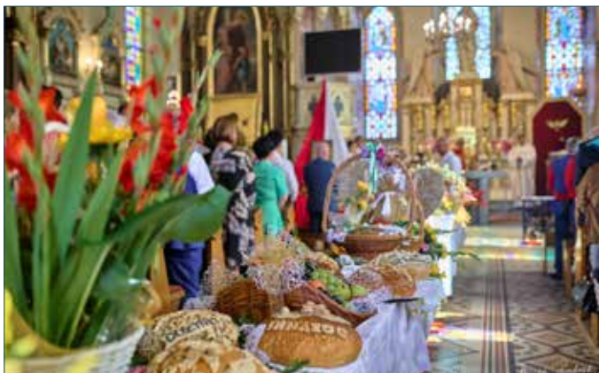
Prezentacja darów ziemi zebranych z pól w powiecie radziejowskim

W niedzielę, 4 września w Osiecinach odbyły się powiatowo-gminno-parafialne dożynki. Święto plonów było okazją, by podziękować rolnikom z powiatu za trud i nieustanny wysiłek związany z pracą na roli. W wydarzeniu uczestniczył starosta radziejowski Jarosław Kołtuniak.