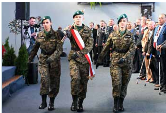
Prezentacja sztandaru przez nowy poczet