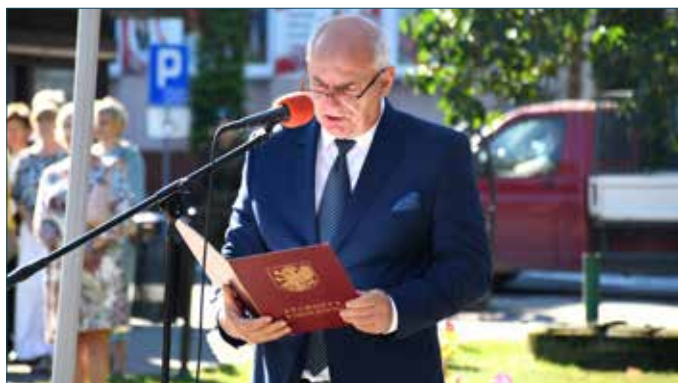
Przemówienie okolicznościowe starosty radziejowskiego

Obchody rocznicy wybuchu wojny odbyły się w Radziejowie. Rozpoczęła je msza święta w intencji tych, dzięki którym możemy żyć teraz w wolnym kraju oraz tych, którzy w czasie wojny stracili życie. Następnie uczestnicy nabożeństwa przemaszewali w defiladzie przed pomnik „Chwały Oręża Polskiego”, by tam wspólnie odśpiewać Mazurka Dąbrowskiego. Przemówienie okolicznościowe wygłosił starosta radziejowski, a przybyłe delegacje złożyły kwiaty przed pomnikiem, oddając cześć żołnierzom i cywilom, którzy stracili życie podczas tego największego i najbardziej krwawego kon-