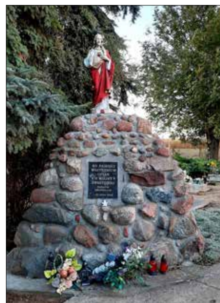
Pomnik poświęcony ofiarom II wojny światowej na cmentarzu w Bronisławiu