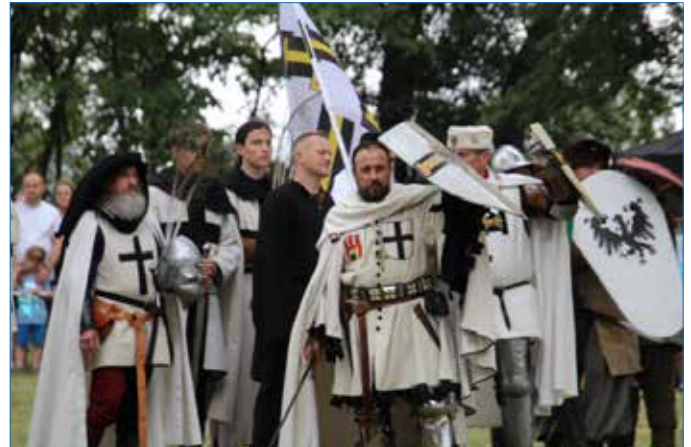
Przed bitwą – rycerze zakonu krzyżackiego

Tekst: Urszula Rosół