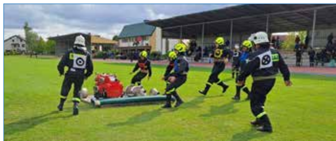
Powiatowe Zawody Sportowo-Pożarnicze

18. 09. br. na stadionie w Osiećcinach odbyły się Powiatowe Zawody Sportowo-Pożarnicze jednostek Ochotniczych Straży Pożarnych oraz Młodzieżowych Drużyn Pożarniczych OSP. Drużyny OSP i MDP rywalizowały ze sobą w dwóch konkurencjach: ćwiczenie bojowe oraz sztafeta pożarnicza 7x50 m z przeszkodami. W zawodach OSP I miejsce, z wynikiem 100,50 pkt., zajęła OSP Ruszki , II – OSP Plichowo (wynik: 107,03 pkt.), a III – OSP Topólka (wynik: 117,34 pkt.). IV miejsce uzyskała OSP Byczyna , uzyskując wynik 148,59 pkt. W klasyfikacji generalnej MDP wygrała Wola Skarbkowa (wynik: 117,40 pkt.). Za nimi na podium stanęła drużyna z Przemyski (wynik: 142,40 pkt.).