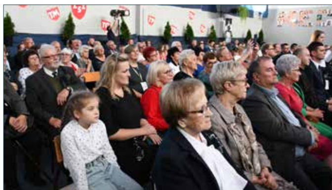
Absolwenci i zaproszeni goście