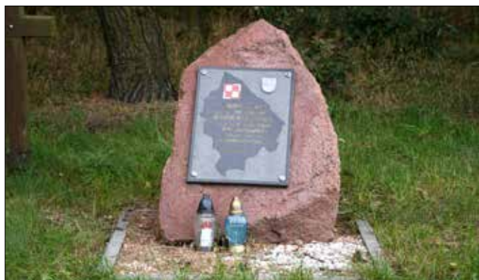
Kamień położony ku pamięci lotniska polowego 4. Toruńskiego Pułku Lotniczego ppor.pil. Stanisława Skalskiego. Lotnisko funkcjonowało tu od 4 do 7 września 1939 r. (kamień leży na skraju lasu przy drodze z Osiecin do Bartłomiejowic)