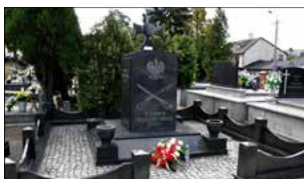
Pomnik „Bohaterom poległym w obronie Ojczyzny” (cmentarz w Radziejowie)