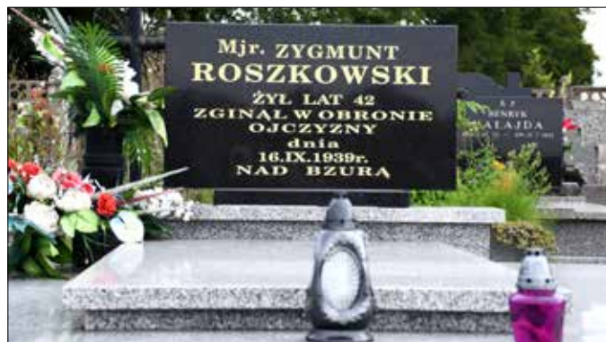
Grób majora Zygmunta Roszkowskiego na cmentarzu w Świerczynie (major zginął 16 września 1939 r.)