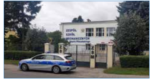
Kontrola w trosce o bezpieczeństwo uczniów