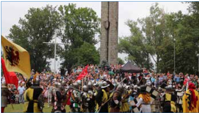
Inszenizacja bitwy zawsze cieszy się dużym zainteresowaniem publiczności