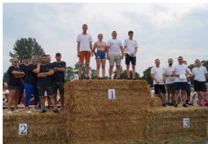
Zwycięskie drużyny I Turnieju Soleckiego