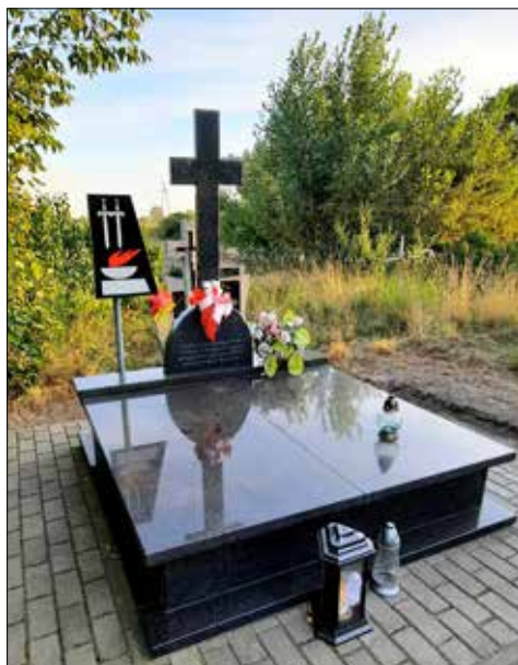
Nagrobek dwóch żołnierzy Wojska Polskiego poległych we wrześniu 1939 r. podczas walk z Niemcami (cmentarz w Piotrkowie Kujawskim)

Z okazji 83. rocznicy wybuchu II wojny światowej publikujemy zdjęcia pomników, mogił i tablic – miejsc pamięci o lokalnych bohaterach, którzy walczyli o wolność naszej Ojczyzny podczas najkrwawszej wojny w historii świata.