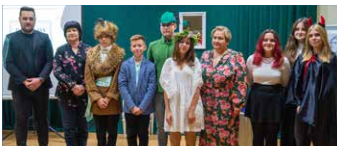
Uczestnicy spotkania z poezją Adama Mickiewicza

W sali piotrkowskiego domu kultury, 16 września, odbyła się kolejna edycja akcji Narodowe Czytanie, zainicjowanej przez Prezydenta RP w 2012 roku. Tegoroczną lekturą są „Ballady i romanse” Adama Mickiewicza. Do dziś wiersze tego cyklu są popularne, a ich współczesne znaczenie dla polskiej kultury