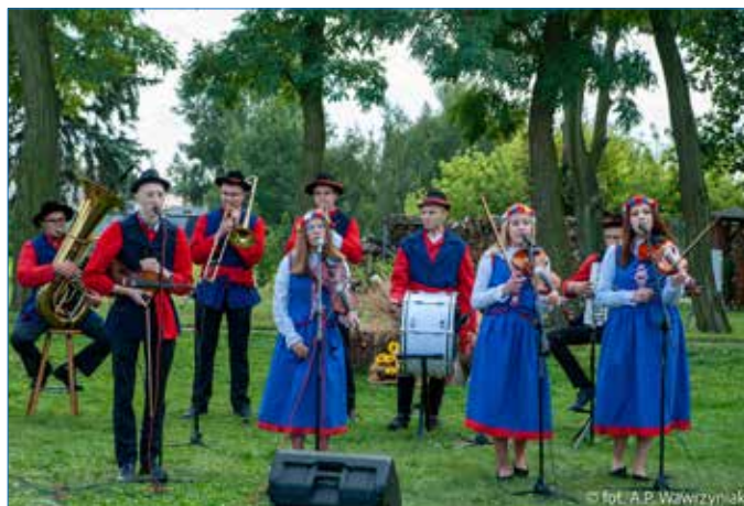
Zespół folklorystyczny Echo Kujaw