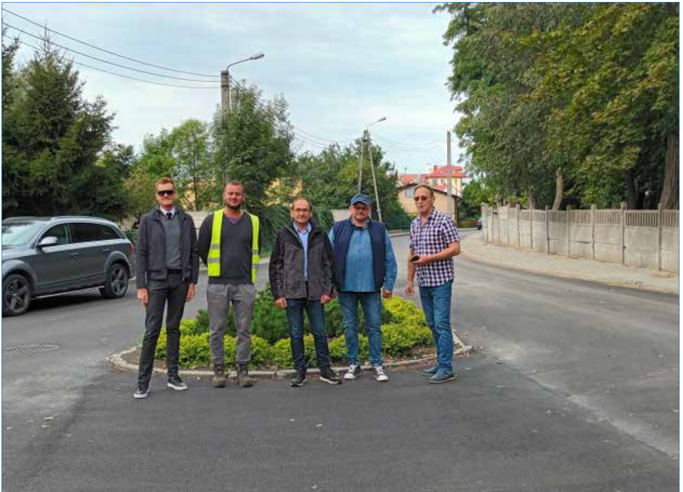
Odbiór zakończonej inwestycji drogowej

13 września 2022r. dokonano odbioru inwestycji pod nazwą: „Przebudowa dróg gminnych w miejscowości Osiecin: ul. Szkolna o dł. 173 mb i ul. Narutowicza o dł. 311 mb.”.