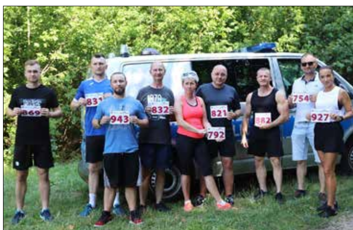
Przedstawiciele radziejowskiej komendy

Na terenie radziejowskiego kompleksu leśnego 17 sierpnia odbył się bieg charytatywny na rzecz Fundacji Pomocy Wdowom i Sierotom po Poległych Policjantach. Funkcjonariusze uczcili 25-lecie fundacji 25-minutowym biegiem lub marszem.