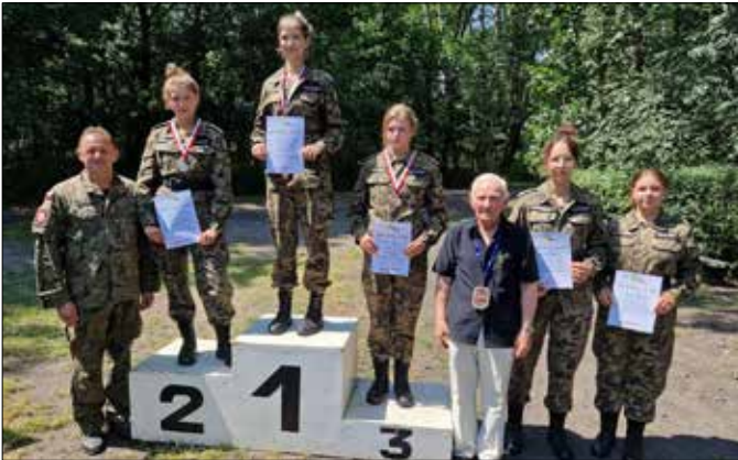
Reprezentacja Zespołu Szkół Mechanicznych w Radziejowie