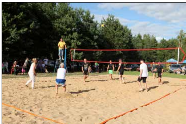
Mecz piłki siatkowej