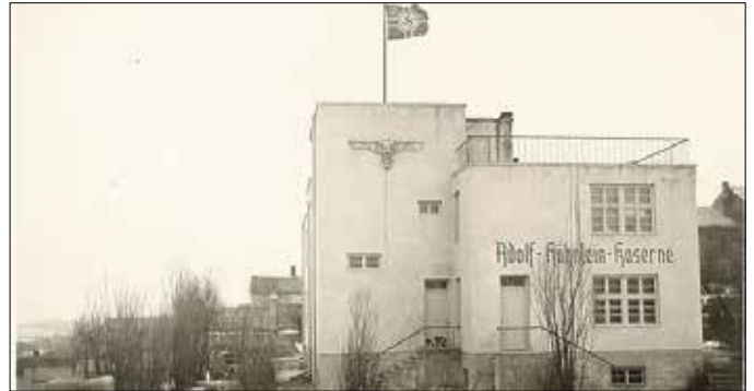
Siedziba Gestapo – dom ten w niezmienionej formie istnieje do dzisiaj

W czasie wojny nazwę miasta zmieniono na Radenberg, a później na Radichau. Zamknięto szkołę radziejowską i przekształcono w ośrodek szkolenia organizacji młodzieżowej „Hitelr Jugend”, niszczone symboliczne miejsca pamięci narodowej. W radziejowskiej farze Niemcy urządzili magazyn, a później – w 1942 r. – więziono w kościele Żydów, przed wywiezieniem do obozów zagłady. Część Żydów uchroniła się przed śmiercią dzięki pomocy rodzin polskich