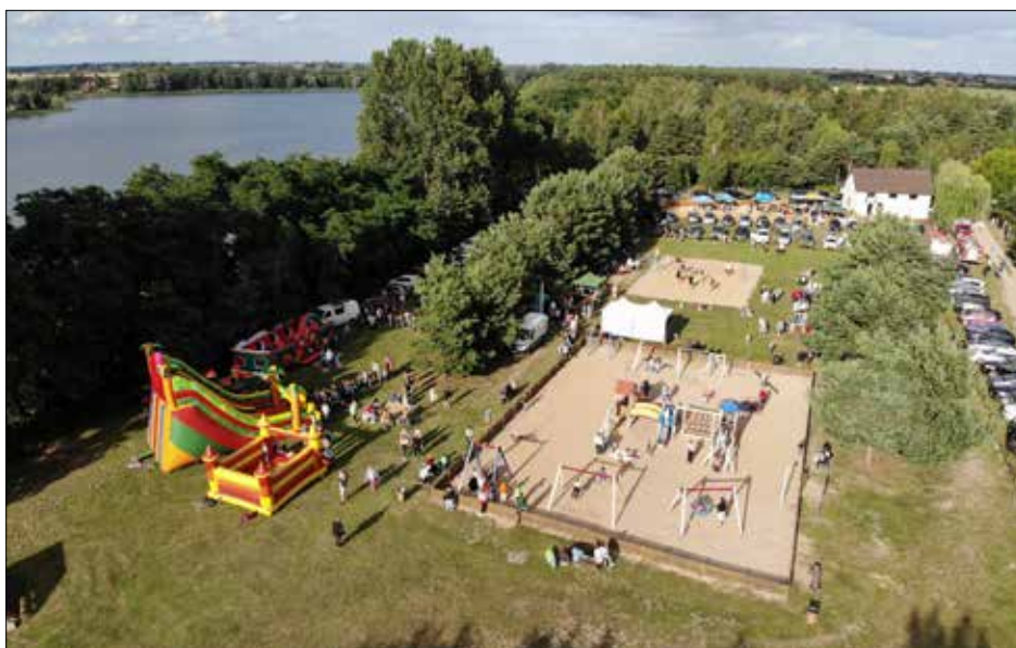
Plaża w Orlu – widok z drona