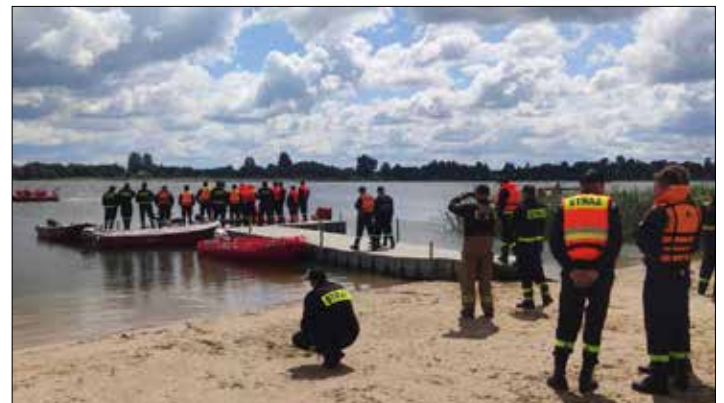
Ćwiczenia z zakresu ratownictwa wodnego