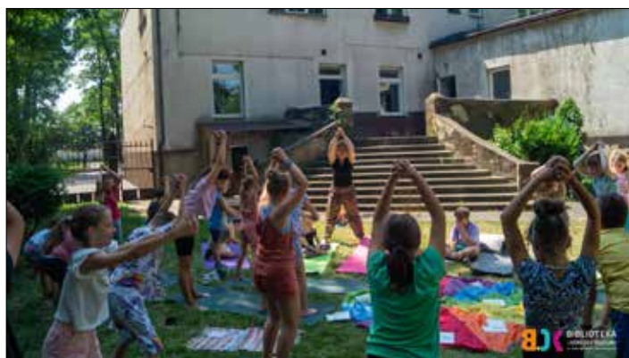
Yoga – ćwiczenia relaksacyjne

Środowe popołudnie grupy spędziły w Ośrodku Terapeutyczno-Wypoczynkowym „Ranczo u Lucy”, gdzie miały możliwość karmienia zwierząt, zabaw terenowych czy zjedzenia pysznej kiełbaski z ogniska. Kolejnym miejscem, które odwiedziliśmy, było ZOO w Płocku. Dzieci dowiedziały się wielu ciekawostek na temat życia czy zwyczajów zwierząt, zamieszkujących płocki ogród zoologiczny. Ponadto uczestnicy zajęć wakacyjnych wzięli udział w warsztatach z uważności z elefantami jogi. Zapoznali się ze swoimi emocjami i sposobami ich wyrażania.