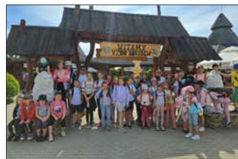
Uczestnicy wycieczki do ZOO Borysew

białe lwy i tygrysy. Dzieci były uczestnikami karmienia zwierząt. Widziały, jakie ilości pokarmu może zjeść tak duże zwierzę. Piękna foka o imieniu Dawid zaprezentowała swoje umiejętności i akrobacje. Wszystkim bardzo podobały się kozy i alpaki. Zwierzątka bardzo przyjazne, każdy mógł je pogłaskać, a także zobaczyć, jak są karmione. Byliśmy również w Figlarni, która jest na terenie ZOO, gdzie dzieci dobrze się bawiły. Słońce i piękna pogoda towarzyszyły nam cały czas. Wszyscy zmęczeni, ale zadowoleni wróciliśmy do domów. To była bardzo udana wycieczka.