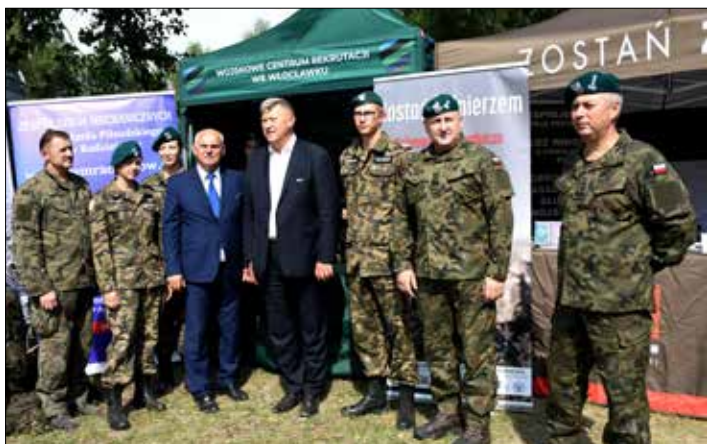
Przedstawiciele samorządu wojewódzkiego i powiatowego oraz Wojska Polskiego