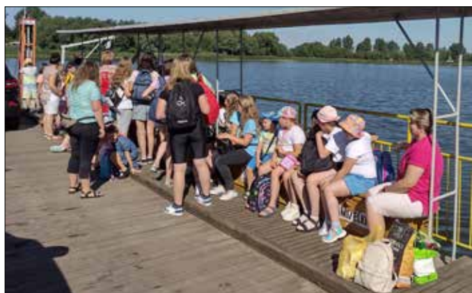
Na promie – w drodze na wyspę