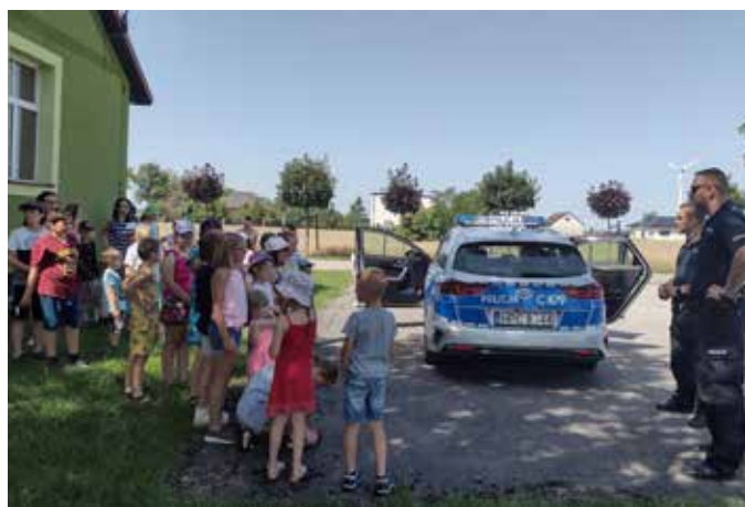
Pogadanka na temat bezpiecznego wypoczynku