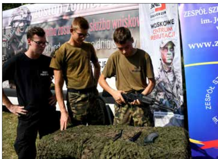
Uczniowie klas mundurowych „Mechanika”