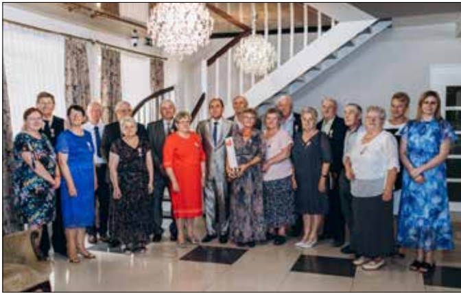
Jubilaci wraz z przedstawicielami samorządu lokalnego

W Restauracji „Szyk” w Osiecinach, 21 lipca, odbyła się uroczystość wręczenia medali Prezydenta Rzeczypospolitej Polskiej Andrzeja Dudy parom małżeńskim, które obchodziły 50-lecie