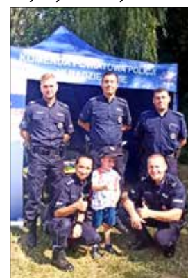
Zapraszamy w nasze szeregi!