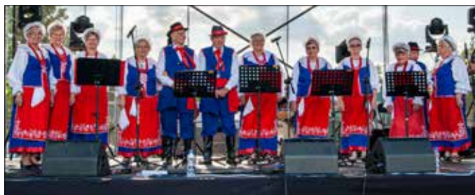
Zespół folklorystyczny „Piotrkowianie”