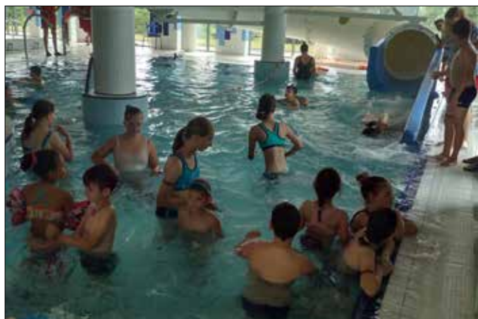
Pływalnia Plusk w Radziejowie

W GOK-B w Skibinie spotkania wakacyjne trwały od 6 lipca do 5 sierpnia 2022 r. Tematyka zajęć była różnorodna: warsztaty plastyczne, podczas których dzieci wykonywały swoją widokówkę z wakacji, lepienie z masy solnej, a także robienie bransoletek z kolorowego sznurka. Dużym zainteresowaniem cieszyły się zajęcia kulinarne: pieczenie ciasteczek kruchych i ich dekorowanie kolorowymi lukrami, wykonywanie cake pops (ciastko na patyku). Dbaliśmy też o aktywność fizyczną naszych podopiecznych, dlatego odbywały się zajęcia sportowe, takie jak: zumba, zabawy z chustą animacyjną, gra w piłkę nożną, różnego typu zawody sportowe czy przeciąganie liny. Najwięcej radości dzieciom sprawiły podchody i szukanie skrzyni ze skarbem, w której kryły się słodkie wafelki.