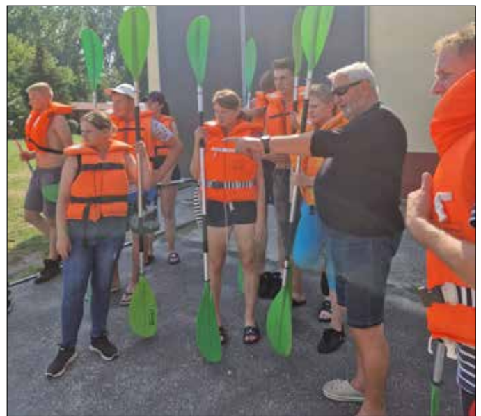
Z wizytą w klubie żeglarskim „Popiel”