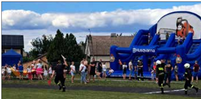
Atrakcje dla najmłodszych

W niedzielę, 7 sierpnia 2022 roku, na stadionie sportowym w Dobrem odbyła się kolejna edycja gminnych zawodów strażackich. Poprzednia odbyła się w sierpniu 2021 roku, podczas pikniku rodzinnego. Zawody zostały rozegrane w dwóch konkurencjach: sztafeta pożarnicza 7 x 50 m z przeszkodami oraz ćwiczenie bojowe.