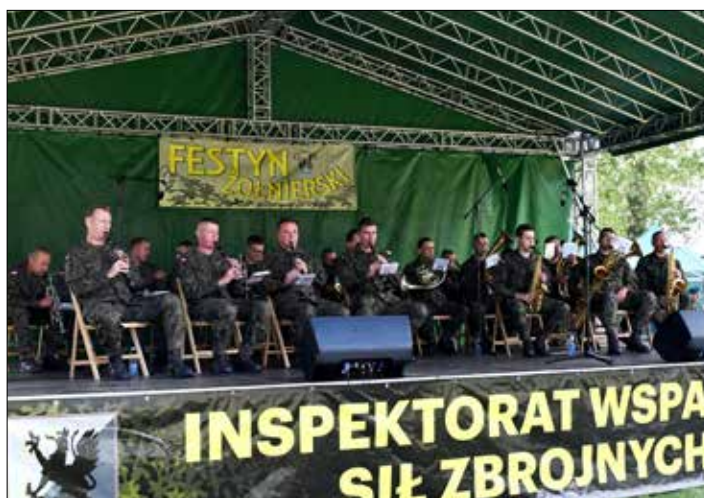
Orkiestra Wojskowa z Bydgoszczy