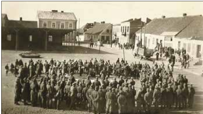
Radziejowski rynek w czasie okupacji nosił nazwę Hermann Goering Platz – niemieccy żołnierze podczas koncertu

W latach 1939-1945 Radziejów znajdował się na terenach okupowanych przez Niemcy. Został bezpośrednio przyłączony do III Rzeszy, w granicach tzw. Kraju Warty. Nikomu nie trzeba przypominać, że II wojna światowa miała wpływ na losy każdej polskiej rodziny i każdej polskiej miejscowości, a faszyzm i nazizm doprowadziły do cierpienia i śmierci wielu ludzi. Hitlerowcy również po wkroczeniu do naszego regionu stosowali brutalne działania wobec mieszkańców. W czasie wojny radziejowianie walczyli głównie w szeregach 14. Pułku Piechoty z Włocławka i 59. Pułku Piechoty z Inowrocławia. Wielu z nich bohatersko zginęło lub dostało się do niewoli (przez istniejący w Inowrocławiu w latach 1940–1945 obóz przesiedleńczy przeszło ok. 10 tysięcy Polaków, kilkuset z nich zamordowano na miejscu).