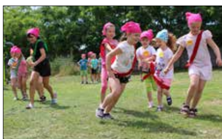
Bieg z przeszkodami

Celem akcji było zapewnienie czasu wolnego, integracja dzieci w różnym wieku i aktywne spędzenie czasu. Ciekawa, różnorodna oferta wyciągnęła z domu nie-