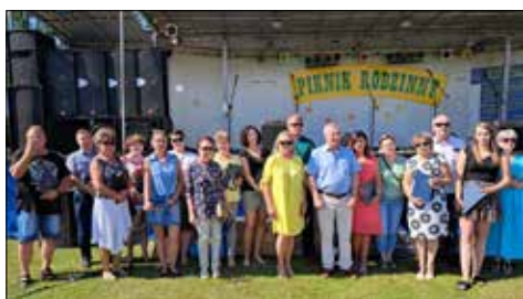
Rozdanie nagród w konkursie - Czysta zagroda

Wakacje w Gminnym Ośrodku Kultury w Dobrem rozpoczęły się bardzo wesoło, kolorowo i aktywnie. 3 lipca na Stadionie Sportowym w Dobrem odbył się piknik „Powitanie Wakacji”, który cieszył się bardzo dużym zainteresowaniem, po ostatniej długiej covidowej przerwie mogliśmy się spotkać bez żadnych ograniczeń.