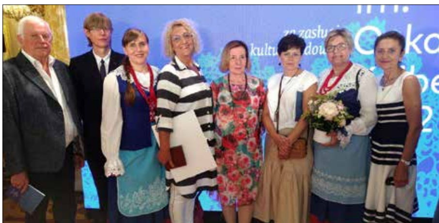
Reprezentacja radziejowskiego TMK

Nagroda im. Oskara Kolberga to najstarsze i najważniejsze wyróżnienie w dziedzinie kultury tradycyjnej w Polsce, ustanowione w 1974 roku. Jej patronem jest Oskar Kolberg (1814-1890), polski etnograf, folklorysta i kompozytor. Towarzystwo Miłośników