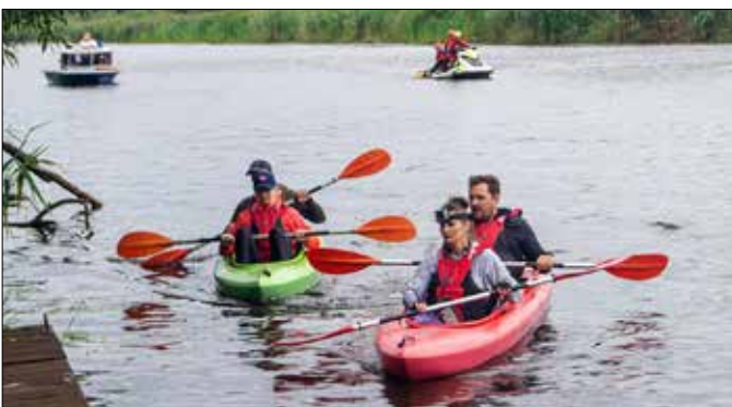
Na trasie spływu

Spływ kajakowy, zorganizowany przez BiOK w Piotrkowie Kujawskim, odbył się 31 lipca br. Celem wydarzenia było m.in.: aktywne spędzanie czasu przez mieszkańców gminy Piotrków Kujawski i ościennych, rozszerzanie aktywności i integracji społecznej, promocja walorów przyrodniczych oraz popularyzacja sportu i turystyki. Warunki pogodowe nie pozwoliły, aby spływ odbył się według planowanej trasy, dlatego organizatorzy zdecydowali o zmianie godziny spływu i skróceniu trasy.