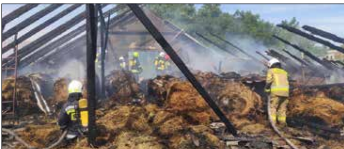
Pogorzelnisko w Topólce

5 sierpnia 2022 r. krótko przed południem przyjęto zgłoszenie o pożarze budynku inwentarskiego w Topólce. Służby ratownicze zastały na miejscu palące się baloty siana na poddaszu budynku. W oborze w chwili powstania pożaru znajdowało się 18 szt. bydła. Miejsce akcji zabezpieczono. Działania zastępów w pierwszej fazie polegały na podaniu prądów wody w natarciu na palące się pokrycie i konstrukcję dachu oraz palące się siano. Jednocześnie podawano prądy wody w obronie pozostałych budynków. Po przewietrzeniu obory przy użyciu wentylatora oddymiającego nie było konieczności ewakuacji zwierząt. Zaopatrzenie wodne realizowano z hydrantu nadziemnego zlokalizowanego na terenie posesji. Ze względu na duże zapotrzebowanie wody realizowano również dowożenie z innych hydrantów zlokalizowanych na terenie gminy Topółka. W drugiej fazie działań przystąpiono do przelewania wodą