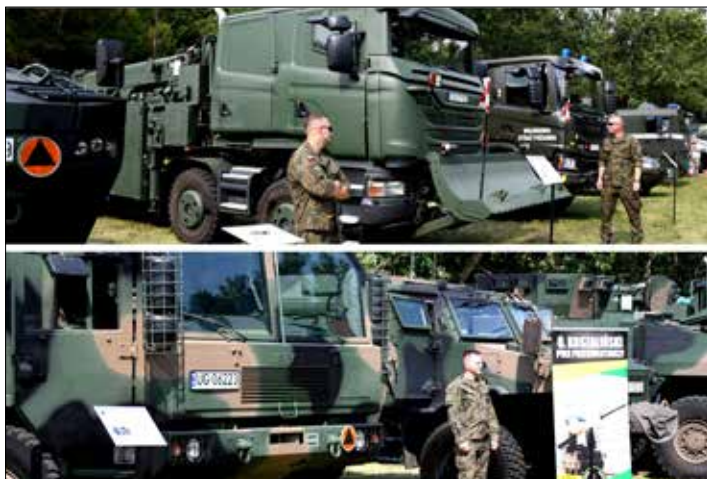
Wojskowy sprzęt bojowy

W sobotę, 13 sierpnia, z okazji Święta Wojska Polskiego oraz 102. rocznicy Bitwy Warszawskiej na tzw. radziejowskich uliczkach odbył się piknik wojskowy. Wydarzenie przyciągnęło wielu mieszkańców i gości powiatu radziejowskiego, którzy z radością korzystali z przygotowanych rozrywek i atrakcji.