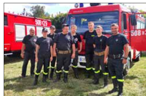
Zwycięska drużyna – OSP Byczyna

kacja przedstawia się następująco: 1. miejsce: OSP Byczyna , 2. miejsce: OSP Krzywosądz , 3. miejsce: OSP Bodzanowo , 4. miejsce: OSP Dobre , 5. miejsce: OSP Bronisław . Wszystkie jednostki otrzymały atrakcyjne nagrody rzeczowe, dyplomy i statuetki ufundowane przez wójta gminy Dobro Stefana Śpibidę.