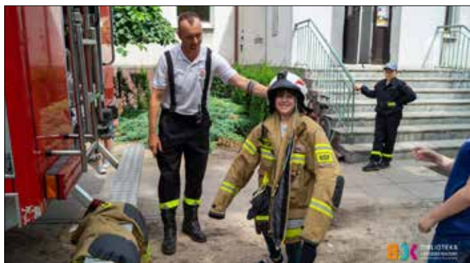
Oj, ciut za duży! Mierzenie stroju bojowego

Poniedziałkowy poranek nie obył się też bez kolorowych, bańkowo-balonowych animacji, w których dzieci bardzo chętnie uczestniczyły. Główną atrakcją była wycieczka do warszawskiego Centrum Nauki Kopernik. Uczestnicy wakacyjnych zajęć mogli osobiście doświadczać różnych ciekawych zjawisk, a także wziąć udział w wyprawie w kosmos podczas seansu w planetarium.