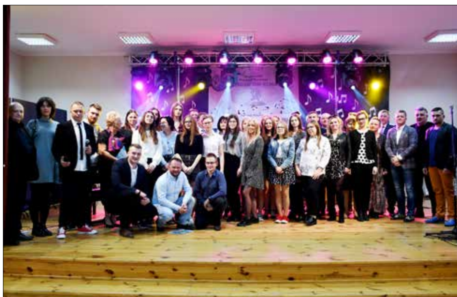
Uczestnicy, organizatorzy i sponsorzy jubileuszowego przeglądu