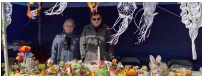
Stoisko wystawiennicze GOK-B w Skibinie

Tydzień wcześniej odbyły się warsztaty dla seniorów, podczas których ich uczestniczki wykonały różnego typu dekoracje wielkanocne, m.in.: koszyczki i kurki ze wstążki metodą kanzashi, jajka ze sznurka, wianki, dekoracje szydełkowe. Wszystkie prace zostały wystawione podczas niedzielnego jarmarku. Dziękujemy seniorom za zaangażowanie i przygotowanie stoiska, które cieszyło się wielkim zainteresowaniem. Podziękowania składamy także odwiedzającym nasze stoisko.