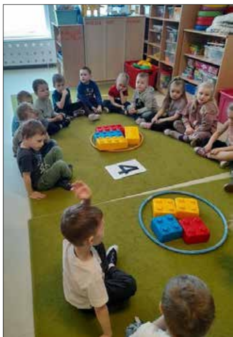
Nauka matematyki poprzez zabawę

Dzieci nigdy nie są za małe na spotkanie z matematyką, czują ją intuicyjnie, mają w sobie niezwykły, cenny, naturalny potencjał. Matematyka kształtuje i uczy dzieci, jest fundamentem logicznego myślenia. Pełni ważną funkcję w procesach poznania i rozumienia otaczającego świata.