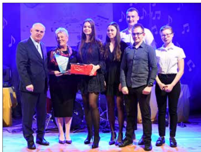
Zwycięski zespół True Life ze starostą radziejskim