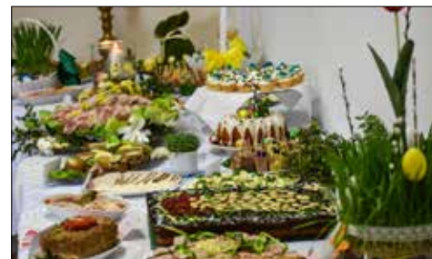
W oczekiwaniu na Wielkanoc