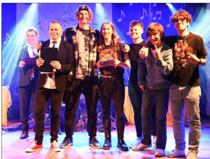
Wyróżniony zespół Dirty Foreskins z naszego ZSM