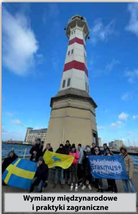
Wymiany międzynarodowe i praktyki zagraniczne