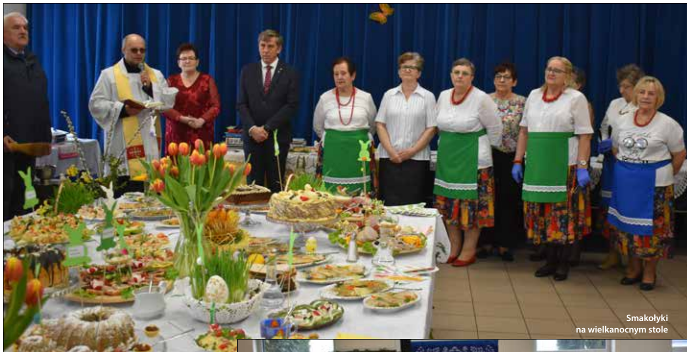
Smakotyki na wielkanocnym stole

Tak jak w wielu miejscowościach w całym kraju, również w Wiejskim Centrum Kultury i Bibliotece Publicznej w Bytoniu odbył się pokaz Stołu Wielkanocnego w Niedzielę Palmową. Przygotowany został przez Koło Gospodyń Wiejskich przy Klubie Seniora w Stróżewie.