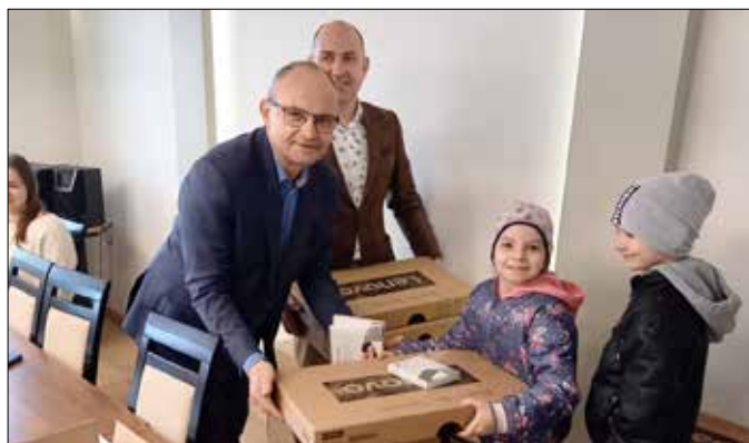
Wójt przekazuje dzieciom sprzęt komputerowy