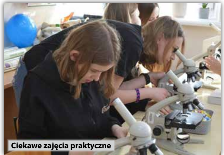
Ciekawe zajęcia praktyczne