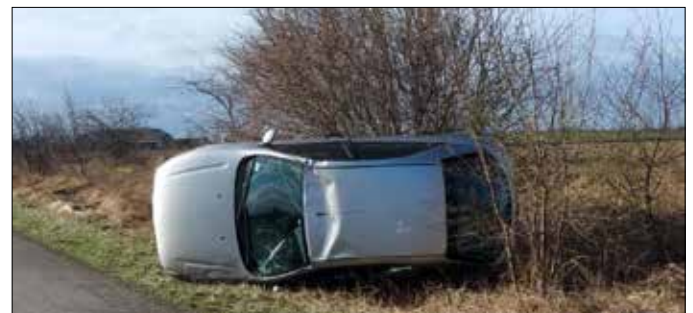
Efekt „spotkania” z sarną

Policjanci apelują o zachowanie ostrożności podczas jazdy, szczególnie w okolicach lasów, w których żyją dzikie zwierzęta. Każdy kierowca powinien pamiętać o zachowaniu szczególnej ostrożności i zwracaniu uwagi na znaki, które informują go o zagrożeniach. Wybiegająca na drogę zwierzęcina, może być bardzo