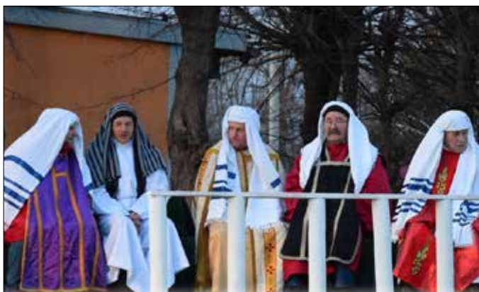
Aktorzy-amatorzy biorący udział w Misterium Męki Pańskiej

Mimo trudnych warunków atmosferycznych, 10 kwietnia br. w Osiecinach, byliśmy świadkami wielkiego widowiska, które zgromadziło blisko 800 widzów z różnych rejonów diecezji wrocławskiej i powiatu radziejowskiego.