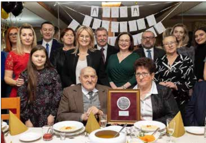
Jubilat z rodziną i przedstawicielami samorządu