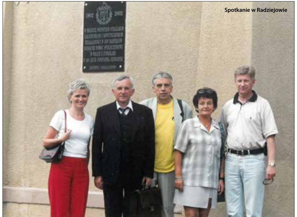
Spotkanie w Radziejowie