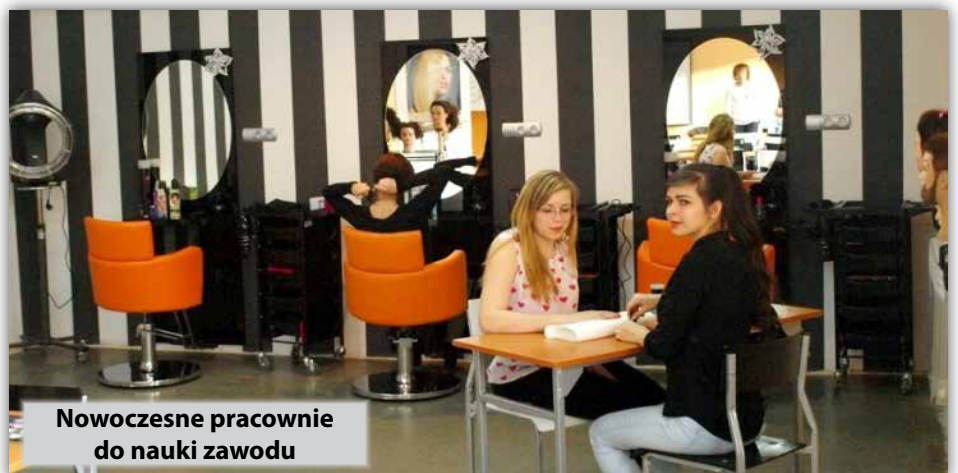
Nowoczesne pracownie do nauki zawodu

Czekamy na Ciebie z bogatą ofertą edukacyjną!