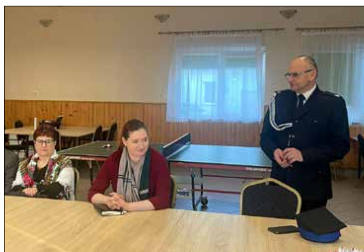
Wójt przywitał gości spotkania