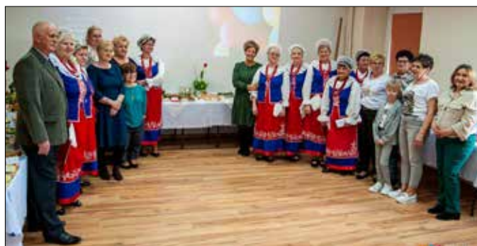
Organizatorzy prezentacji świątecznych stołów