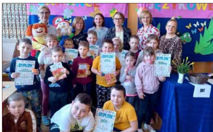
Zdolni uczestnicy językowych łamigłówek z opiekunkami