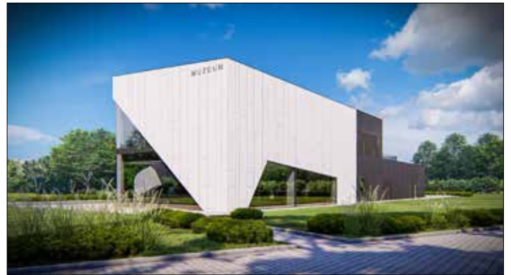
Wizualizacja Muzeum i Biblioteki Gminnej w Płowcach

Tekst: Joanna Kicińska