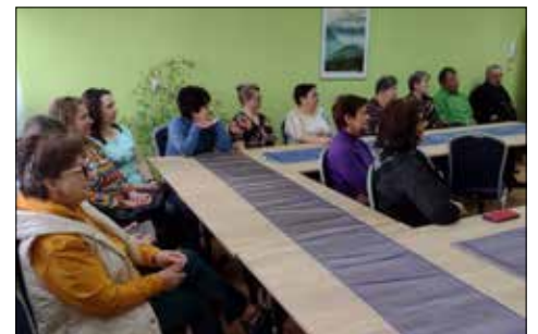
Uczestnicy spotkania o zdrowiu

Uczestnicy spotkania mogli zapoznać się z produktami firmy Duolife, które zawierają naturalne składniki, działające na układ kostno-stawowy, sercowy, cukrzycę, dolegliwości skórne, pasożyty oraz problemy nowotworowe. Mogli również wziąć udział w losowaniu nagród. Zachęcamy do korzystania z produktów tej firmy. Więcej informacji o produktach i kosmetykach firmy Duolife można uzyskać w GOK-B w Skibinie.