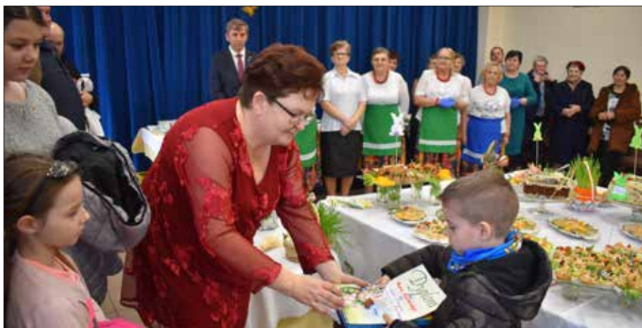
Dyrektor Wiejskiego Centrum Kultury i Biblioteki Publicznej wręcza nagrody laureatom konkursu