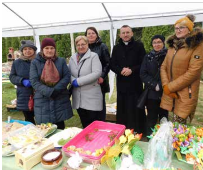
Stoisko charytatywne cieszyło się dużym zainteresowaniem mieszkańców gminy