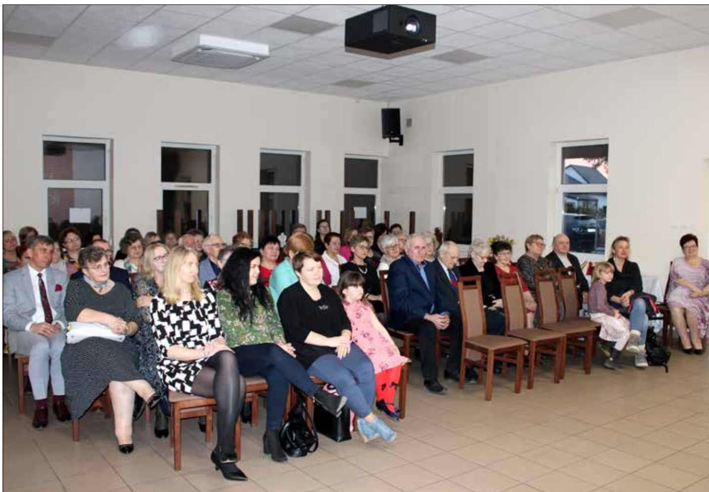
Publiczność zgromadzona na koncercie z okazji Dnia Kobiet

Tekst: Renata Szymborska