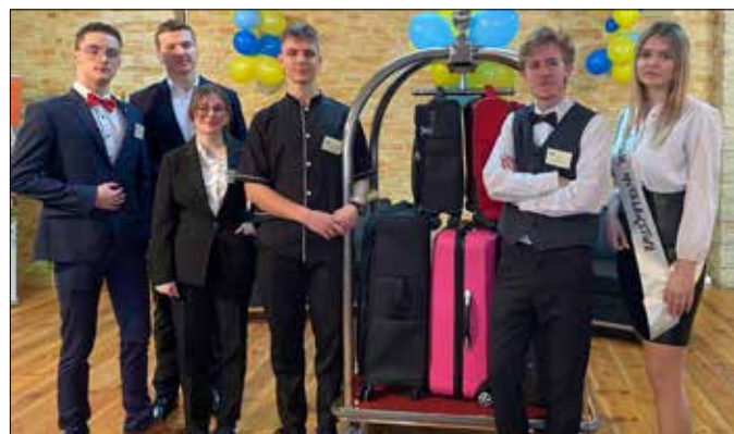
Uczniowie technikum hotelarskiego