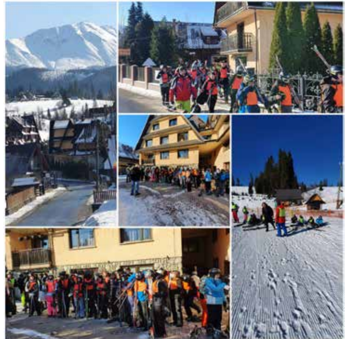
Wspomnienia z wyjazdu w góry

Tekst: Zespół nauczycieli ZS RCKU w Przemyslcie