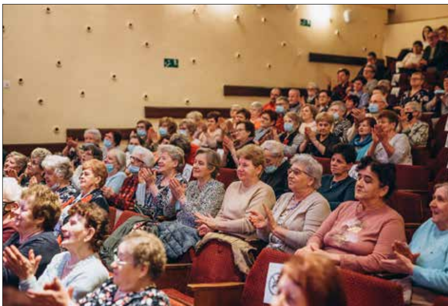
Panie gromkimi brawami dziękowały artyście za występ