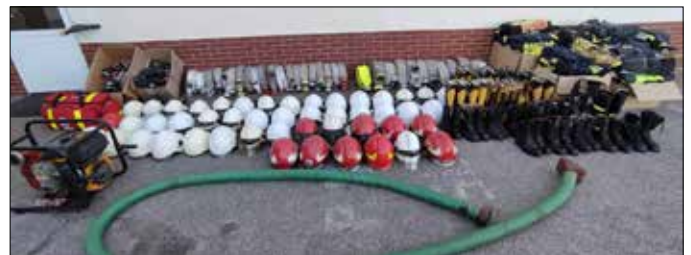
Dary dla ukraińskich strażaków

27 lutego 2022 r. strażacy radziejowskiej komendy oraz druhowie Ochotniczych Straży Pożarnych z terenu powiatu radziejowskiego czynnie włączyli się w zbiórkę sprzętu pożarniczego zorganizowaną z inicjatywy Komendanta Głównego Państwowej Straży Pożarnej.