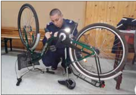
Znakowanie roweru w miejscowości Osięcin