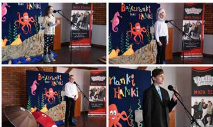
Młodzi recytatorzy w swoich artystycznych prezentacjach