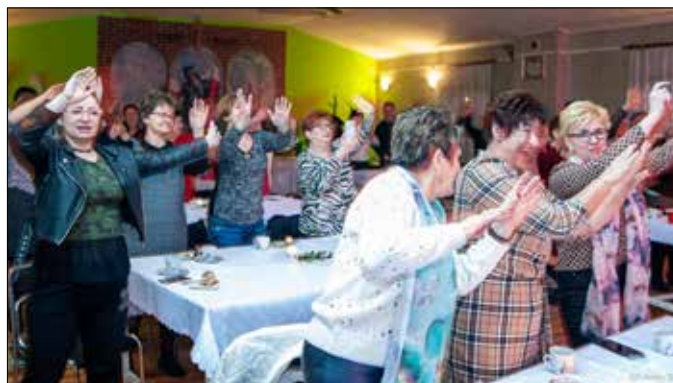
Rozbawione piotrkowianki w czasie występu