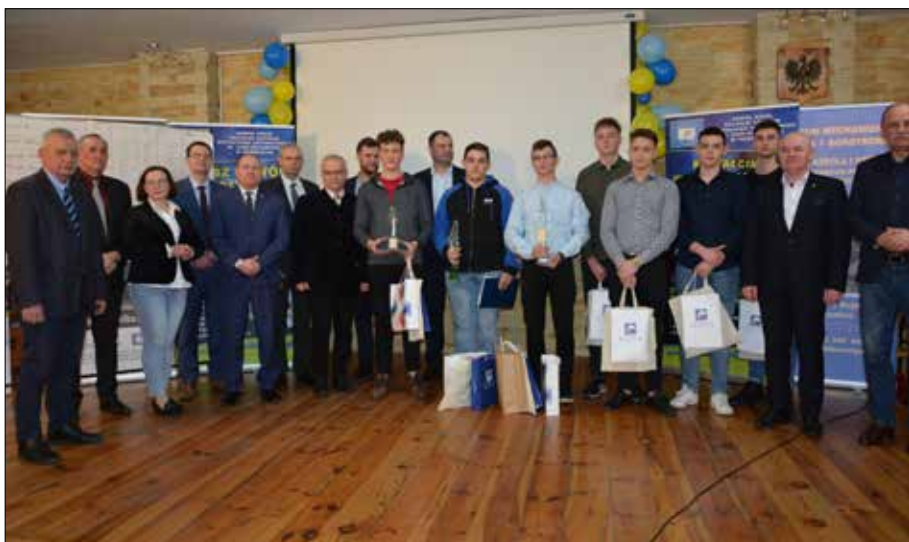
Uczestnicy i organizatorzy tegorocznej Olimpiady Młodych Producentów Rolnych

Finał tegorocznej XXXIX Olimpiady Młodych Producentów Rolnych na poziomie wojewódzkim odbył się 10 marca br. w Zespole Szkół RCKU w Przemystce, która była współgospodarzem wydarzenia. Głównym organizatorem olimpiady jest Związek Młodzieży Wiejskiej. Honorowy patronat nad olimpiadą obejmuje Ministerstwo Rolnictwa i Rozwoju Wsi.