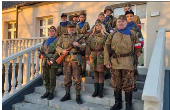
GRH AK „Kolumbowie” z Piotrkowa Kujawskiego