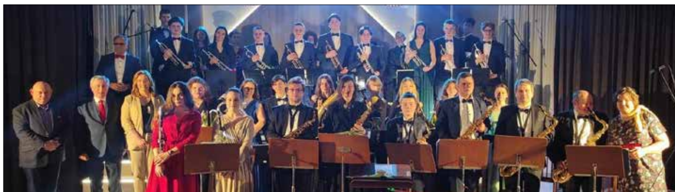
Wspólne zdjęcie orkiestry z przedstawicielami samorządu gminnego