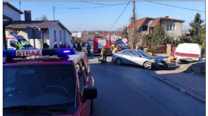
Kolizja drogowa (skrzyżowanie ulicy Dolnej i Franciszkańskiej)

11 marca 2022 r. w miejscowości Radziejów doszło do kolizji drogowej. Stanowisko Kierowania Komendanta Powiatowego Państwowej Straży Pożarnej w Radziejowie otrzymało zgłoszenie o godz. 14:50. Na miejsce zdarzenia zadysponowano służby ratownicze. Po przybyciu zastępów na miejsce zastano dwa samochody osobowe, marki Polonez oraz Mazda, po zderzeniu na skrzyżowaniu ul. Dolnej z ul. Franciszkańską. Pojazdy blokowały drogę. Ruch został zamknięty. Miejsce akcji zabezpieczono. Kierujący samochodem marki Polonez opuścił pojazd o własnych siłach, nie uskarżając się na żadne dolegliwości, natomiast podróżująca samochodem marki Mazda, również znajdująca się poza pojazdem wraz z miesięcznym dzieckiem w nosidełku, uskarżała się na ból nogi. Strażacy udzielili kobiecie kwalifikowanej pierwszej