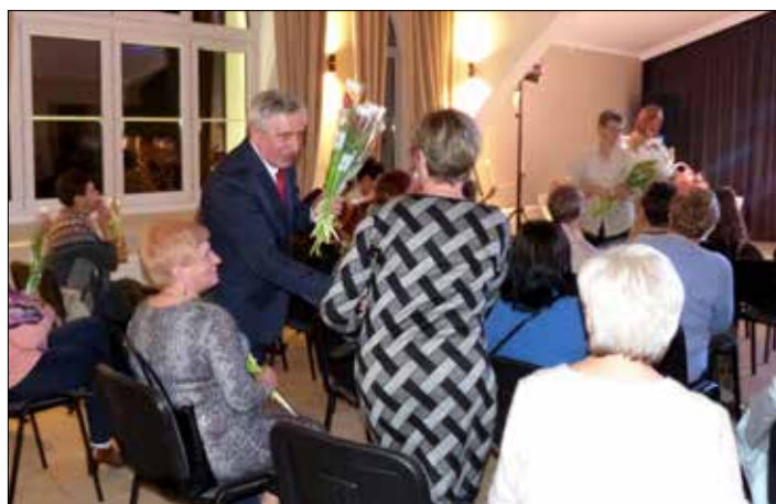
Kwiatki i życzenia dla każdej z pań