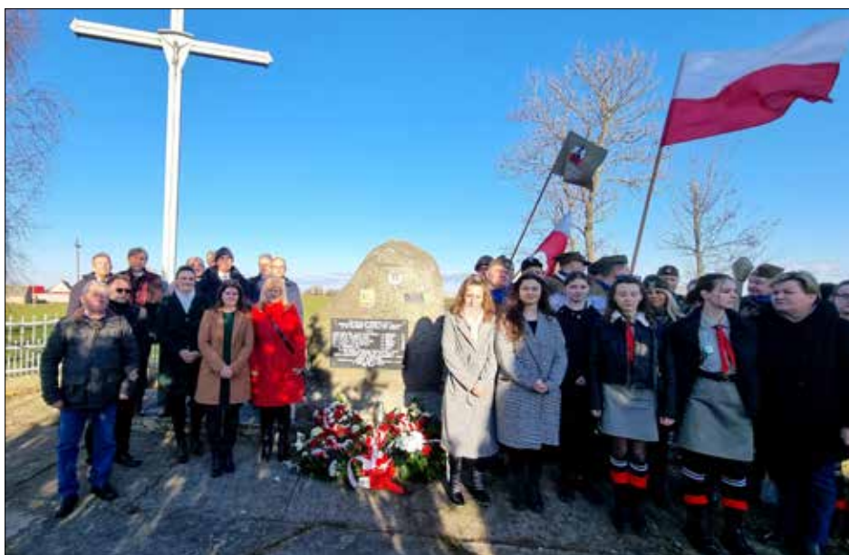
Uczestnicy uroczystości obchodów święta żołnierzy wyklętych