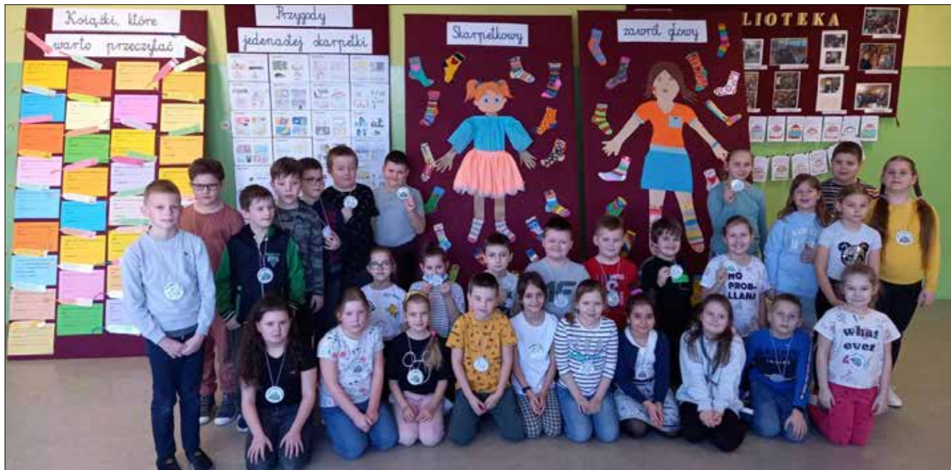
Mali uczestnicy projektu

Rozwijanie umiejętności czytania ze zrozumieniem i troska o poprawę stanu czytelnictwa stała się inspiracją do opracowania projektu edukacyjnego pt. „Skarpetkowy zawrót głowy” realizowanego przez uczniów kl. 2a i 2b. Trwał on od 10 do 28 lutego 2022 r.