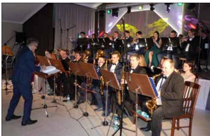
Występ gości z Bydgoszczy

Wójt gminy Dobre oraz dyrektor Gminnego Ośrodka Kultury w Dobrem, 5 marca, zaprosili wszystkie mieszkanki gminy na koncert z okazji Dnia Kobiet. W sali widowiskowej GOK - u wystąpiła Młodzieżowa Orkiestra Dęta „Kujawia”, działająca przy klubie 1 Pomorskiej Brygady Logistycznej w Bydgoszczy.