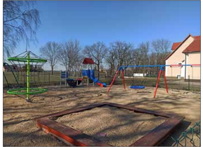
Plac zabaw w Skibinie

Tekst: Joanna Kicińska