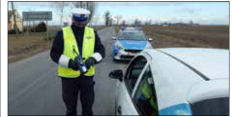
Działania policyjne w ramach trwającej akcji

Kolejna akcja radziejowskich policjantów, mająca na celu poprawę bezpieczeństwa na drogach. Tym razem zwracali szczególną uwagę na przekroczenia prędkości.