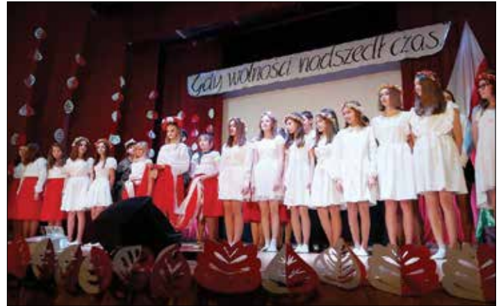
Występ szkolnej młodzieży

Tekst: Monika Gutowska