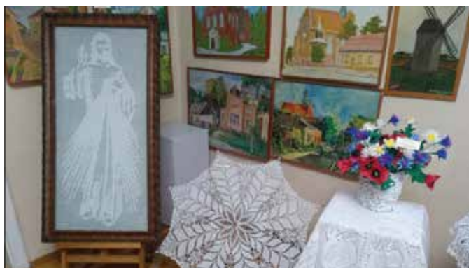
Exponaty z wystawy pokonkursowej