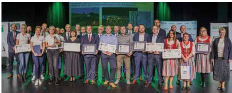
Sołectwa wyróżnione i nagrodzone w konkursie

W konkursie mogły wziąć udział sołectwa, które w latach 2010–2020 sfinalizowały projekty finansowane ze środków wyodrębnionych w ramach funduszu sołectkiego lub, w których fundusz ten stanowił wkład własny. W IV edycji konkursu uczestniczyło 186 przedsięwzięć zrealizowanych przez wspól-