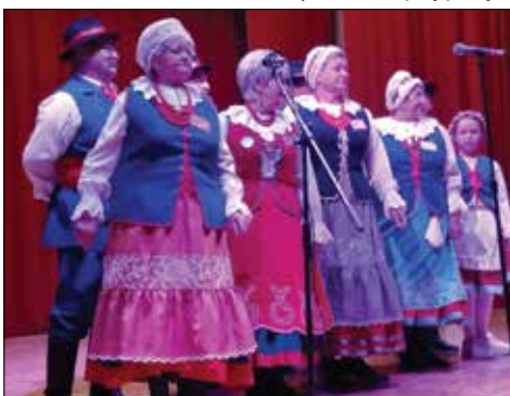
Goście spotkania – zespół „Kujawioki”

Gości powitała przewodnicząca Stowarzyszenia Kreatywnych Seniorów słowami – Bardzo wszystkim dziękuję, że jesteście i możemy spotykać się w miłej atmosferze.