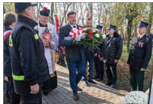
Składanie wiązanek pod pomnikiem

skim domu kultury. Wydarzenie rozpoczęło się od rozstrzygnięcia konkursu pt. „Kotyliion w barwach narodowych”. Celem konkursu było kształtowanie postaw patriotycznych wśród mieszkańców miasta i gminy, włączanie ich w