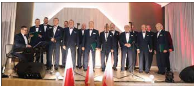
Koncert w wykonaniu Chóru Męskiego Osiecinę

W piątek, 12 listopada 2021 r. o godz. 18.00 odbyło się uroczyste otwarcie zmodernizowanego budynku Gminnego Ośrodka Kultury w Dobrem. Na realizację tego zadania gmina Dobre pozyskała