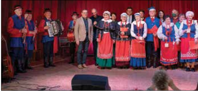
Zdobywcy pierwszej nagrody – Zespół Folklorystyczny „Kujawy Bachorne Nowe”