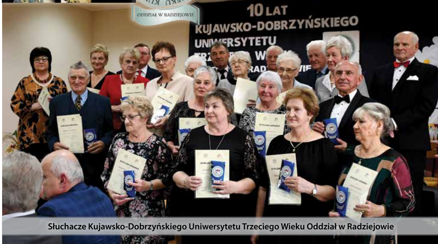
Słuchacze Kujawsko-Dobrzyńskiego Uniwersytetu Trzeciego Wieku Oddział w Radziejowie