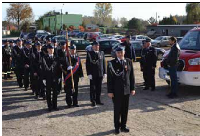
Jednostka OSP w Topólce

Jest to w historii funkcjonowania gminy, po reformie ustrojowej, pierwszy nowy samochód zakupiony dla jednostki straży pożarnej. Jego wartość to 307 131,00 zł . Ufundowany przez Oddział Wojewódzki Związku Ochotniczych Straży Pożarnych RP w kwocie 230 348,25 zł oraz Urząd Gminy Topólka w kwocie 76 782,75 zł .