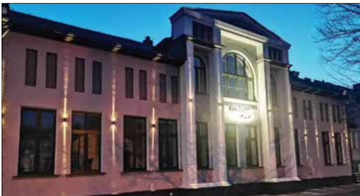
Budynek Gminnego Ośrodka Kultury po przebudowie