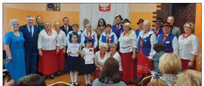
Uczestnicy spotkania podsumowującego projekt