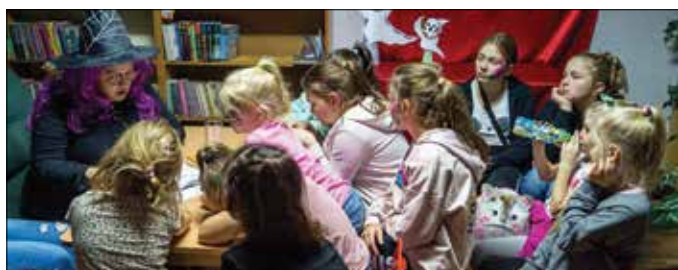
Dzieci w skupieniu wysłuchiwały opowiadania z gatunku „Strasznych opowieści”