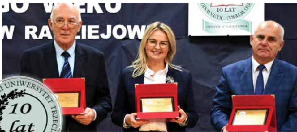
Patroni honorowi uroczystości