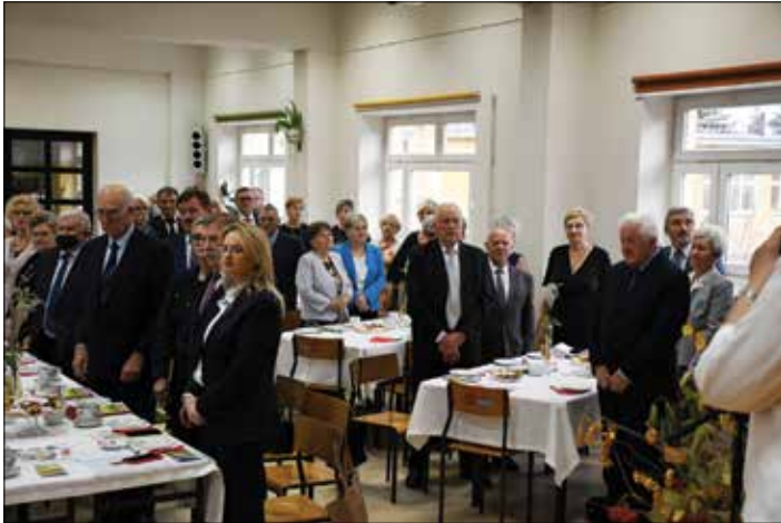
Odśpiewanie hymnu akademickiego

W czwartek, 4 listopada br. w auli Zespołu Szkół Mechanicznych odbyła się uroczystość 10-lecia Kujawsko-Dobrzyńskiego Uniwersytetu Trzeciego Wieku Oddział w Radziejowie. Z powodu pandemii, wydarzenie miało roczne opóźnienie, jednak nie przeszkodziło to seniorom w świętowaniu jubileuszu.