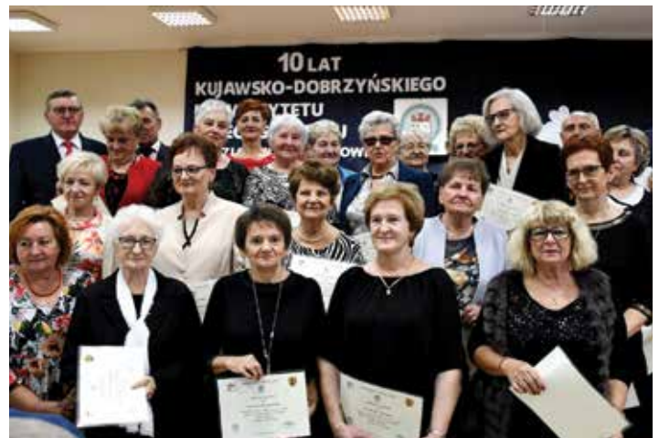
Aktywni słuchacze radziejowskiego oddziału