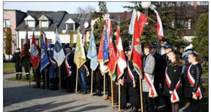
Poczty sztandarowe powiatowych instytucji

radziejowski. W swoim przemówieniu podkreślił, że po raz kolejny spotykamy się na uroczystości poświęconej Ojczyźnie i Wolności. – 11 listopada to symbol miłości Ojczyzny, walki o wolność, symbol wiary i symbol zwycięstwa. Przed chwilą odśpiewaliśmy hymn państwowy, z dumą kadeci jednej ze szkół wciągnęli flagę państwową na maszt. Oddając szacunek symbolom narodowym, oddajemy go wszystkim Polakom, którzy odeszli i tym, którzy żyją obecnie (...). Przywołał też słowa poety: – Czym jest wolność? ... wie ten... kto ją stracił./ Ten, kto przeżył niewolę i śmierć widział braci. Wolność – zwykle krzyżami się mierzy/ Bohater narodowy Polski walczył o wolność naszą ... i waszą, moją... i twoją.