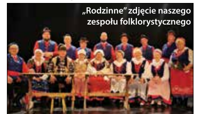
„Rodzinne” zdjęcie naszego zespołu folklorystycznego

Nasi uczestnicy swym występem otworzyli trzecią część Sejmiku Teatru Wsi Polskiej. Rada Artystyczna uhonorowała „Kujawy Bachorne Nowe” nagrodą Instytutu Kultury i Dziedzictwa Wsi za niezłomne pełnienie roli strażnika regionalnej kultury, repertuar taneczny oraz bogatą oprawę muzyczną. Jeszcze raz wszystkim członkom zespołu serdecznie gratulujemy!