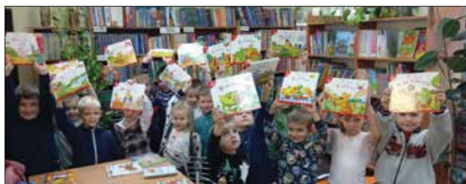
Mali czytelnicy z dziecięcą lekturą

Gościliśmy w dzieci w Gminnym Przedszkolu w Skibinie, aby promować akcję, w której bierzemy od wielu lat udział tj. „Mała książka – wielki człowiek”. W tym roku wydajemy wyprawki rocznikom 2015–2018. Beneficjentami są zarówno dzieci, które już są czytelnikami, jak i te, które nimi zostaną. Dzieciom, które otrzymały „Pierwsze czytanki” w poprzedniej edycji, wydajemy nową kartę do zbierania naklejek. Po uzbieraniu dziesięciu naklejek dziecko otrzymuje