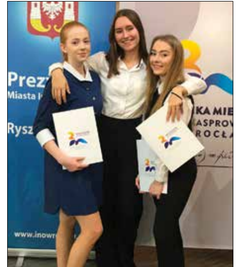
Wyróżnione uczennice „Łokietka”

Tekst: Magdalena Bugalska