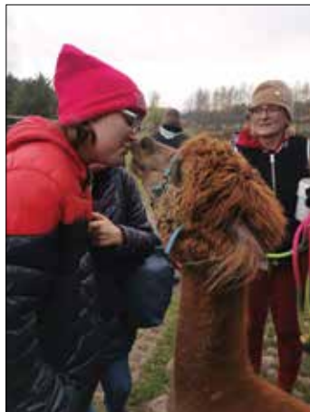
Uczniowie nawiązali przyjacielskie relacje ze zwierzętami