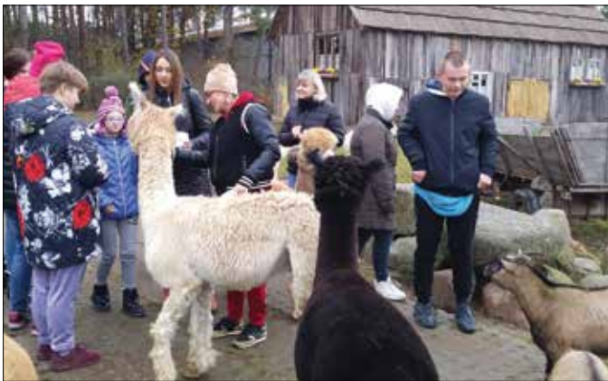
Wśród przyjaznych alpak

Uczniowie klas V-VIII ze spektrum autyzmu oraz V-VI SPUZ Specjalnego Ośrodka Szkolno-Wychowawczego w Radziejowie 8 listopada 2021 r. udali się na spotkanie z alpakami.