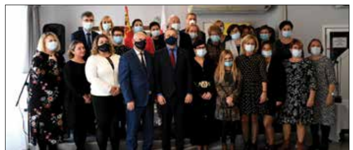
Odnaczeni medycy w towarzystwie przedstawicieli samorządu powiatowego i wojewódzkiego