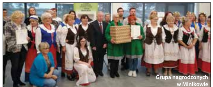
Grupa nagrodzonych w Minikowie