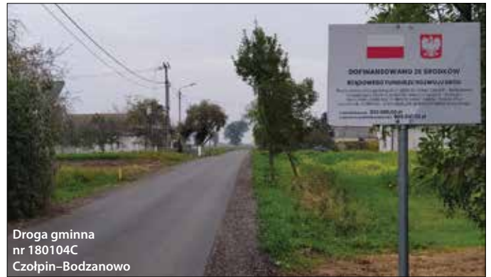
Droga gminna nr 180104C Czołpin–Bodzanowo

Przebudowa kolejnych odcinków dróg gminnych, to następny krok w tworzeniu przyjaznej mieszkańcom infrastruktury drogowej.