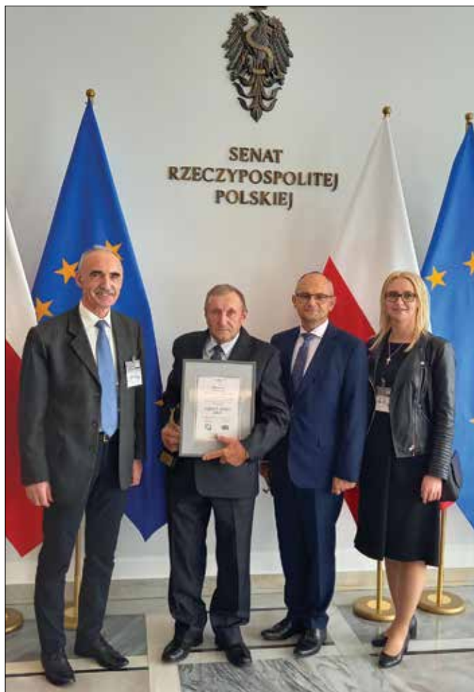
Laureat z przedstawicielami gminy Topólka