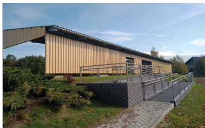
Likwidacja barier architektonicznych – podjazd na trybunę