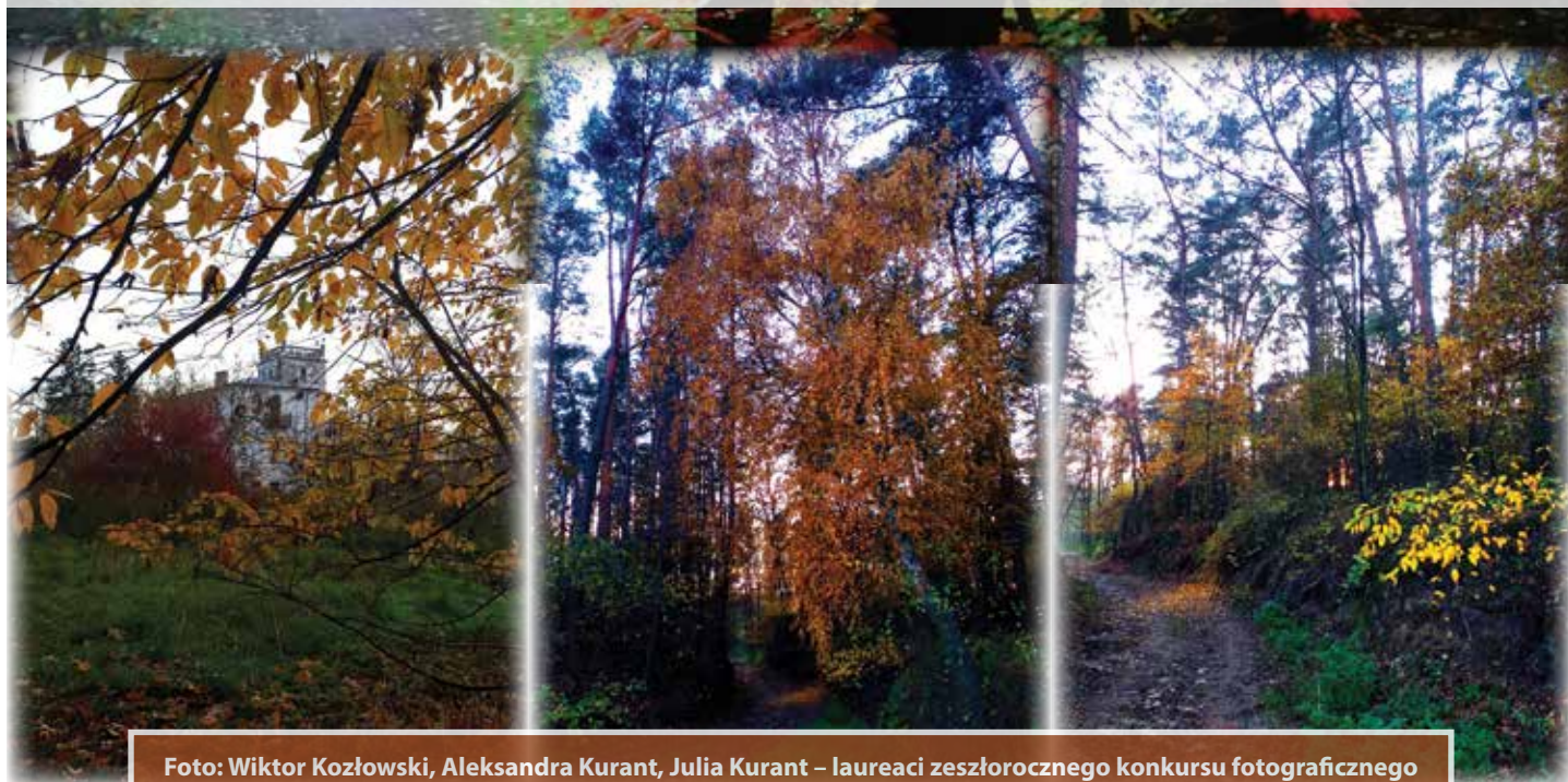
Foto: Wiktor Kozłowski, Aleksandra Kurant, Julia Kurant – laureaci zeszłorocznego konkursu fotograficznego pn. „Cztery pory roku w powiecie radziejowskim”, organizowanego przez Starostwo Powiatowe w Radziejowie