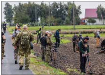
Wydarzenie wzbudziło duże zainteresowanie archeologów