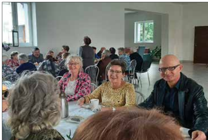
Przy kawie i słodyczach rozmowom nie było końca