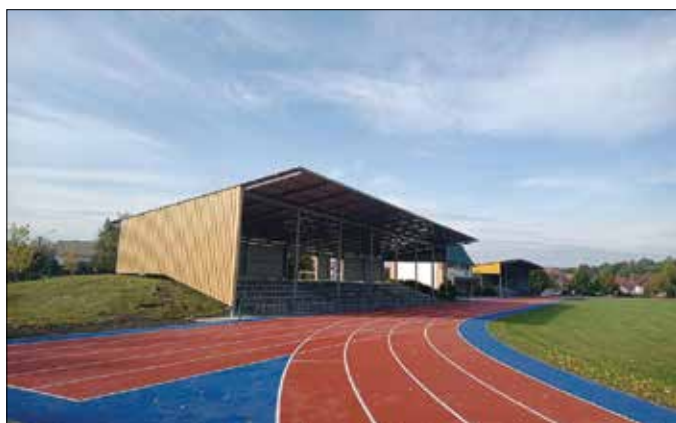
Trybuna dla gości z fragmentem nowej bieżni