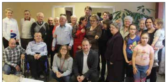
PZN – Koło w Radziejowie (zdjęcie archiwalne)