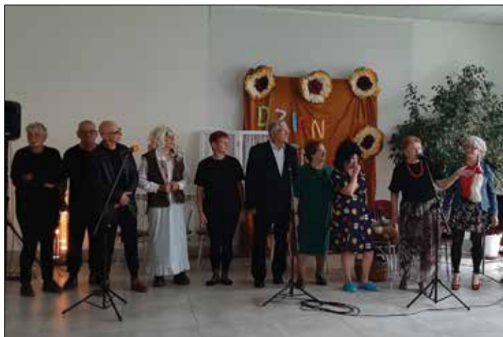
Seniorzy z Lubrańca podczas występu artystycznego