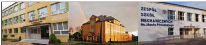
Powiatowe szkoły średnie

Po wakacyjnej przerwie, 1 września uczniowie i grono pedagogiczne z trzech szkół średnich naszego powiatu, Szkoły Muzycznej I stopnia w Radziejowie oraz Specjalnego Ośrodka Szkolno-Wychowawczego rozpoczęło nowy rok szkolny w sposób tradycyjny. Uroczyste inauguracje połączone były z organizowanymi powiatowymi uroczystościami związanymi z 82. rocznicą wybuchu II wojny światowej.