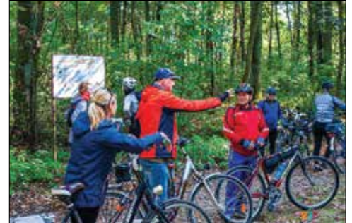
Na trasie rajdu rowerowego

Mimo chłodnego poranka, 18 amatorów aktywnego wypoczynku wzięło udział w rajdzie na trasie Bycz, Orle, Topólka, Sarnowo; łączna długość 54 km. O godz. 9.30 rowerzyści spotkali się przy piotrkowskim domu kultury, gdzie po sprawdzeniu listy