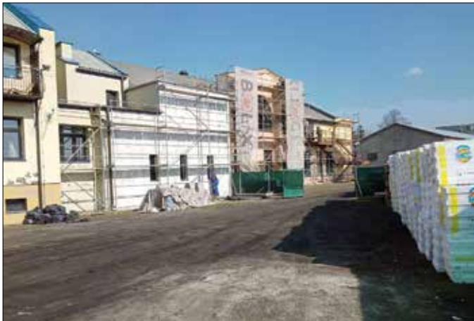
Elewacja budynku od strony południowej

Trwają prace przy przebudowie Gminnego Ośrodka Kultury w Dobrem. Na ten czas siedziba GOK została przeniesiona do pomieszczeń znajdujących się w jego poprzedniej lokalizacji przy ulicy Dworcowej 6 przy Gminnej Bibliotece Publicznej.