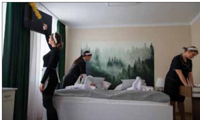
Pracownia zaaranżowana na pokój hotelowy

Nie od dziś wiadomo, że najlepszą formą nauki zawodu jest praktyczne działanie. A jeżeli może ono być realizowane w dobrze przygotowanym do tego miejscu, to sukces jest na przysłowiowe „wyciągnięcie ręki”. Takie warunki zostały stworzone w Zespole Szkół RCKU w Przemystce dzięki udziałowi placówki w projektach angażujących środki unijne.