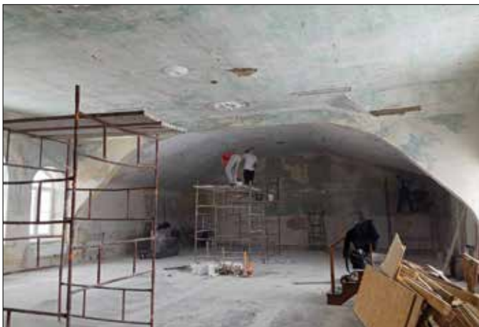
Prace w sali koncertowej