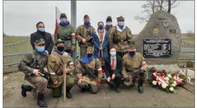
Grupa rekonstrukcyjna wraz z harcerzami przy miejscu pamięci w Znaniewie