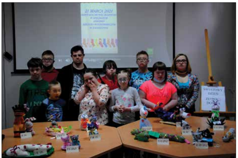
W świecie „skarpetkowych” cudzeniek

Zespół Downa to zespół wad wrodzonych, wywołany nieprawidłową liczbą chromosomów. Charakteryzuje się m.in. niepełnosprawnością intelektualną w stopniu lekkim lub średnim oraz cechami dysmorfii, czyli zmianami w wyglądzie. Oprócz tego w przebiegu choroby występuje szereg zaburzeń w budowie i funkcjonowaniu organizmu. Nazwa choroby pochodzi od nazwiska odkrywcy - lekarza Johna Langdonai Haydona Downa, który odkrył ją i zidentyfikował w 1862 roku. Był pionierem w dziedzinie edukacji i treningu osób niepełnosprawnych intelektualnie.