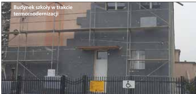
Budynek szkoły w trakcie termomodernizacji

Wykonane zostaną roboty budowlane polegające na dociepleniu ścian zewnętrznych budynku styropianem. Termomodernizacja obejmie także ściany fundamentowe w obrębie cokołu oraz stropodach budynku. Przy wykonaniu prac dociepleniowych niezbędna będzie również wymiana lub naprawa uszkodzonych elementów elewacji. W ramach zadania zaprojektowano dodatkowo wymianę wyeksploatowanych i nieszczelnych okien zewnętrznych na nowe, o korzystnych wartościach współczynnika przenikania ciepła. Do wykonania są także roboty towarzyszące, obejmujące demontaż, wymianę na nowe wszystkich rynien i rur spustowych, wykonanie obróbek blacharskich i parapetów, podniesienie kominów, odtworzenie instalacji odgromowej, jak również wymiana drabiny zewnętrznej na nową, zgodną z obowiązującymi przepisami.