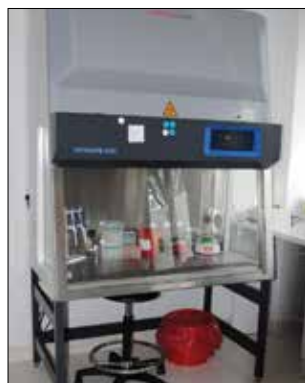
Jedna z komór laminarnych, będących w wyposażeniu laboratorium

Zgrany i dynamicznie rozwijający się zespół doświadczonych specjalistów lokalnego laboratorium składa się z lekarzy, diagnostów laboratoryjnych i biotechnologów. Stosowana przez niego technika badawcza Real-Time PCR to najczulsza ze wszystkich metod biologii molekularnej, używana w diagnostyce mikrobiologicznej. Wykonywanie testów jest świadczone zarówno dla pacjentów prywatnych, jak również dla tych ze skierowaniem z NFZ. Wyniki udostępniane są na platformie EWP 3.0 oraz