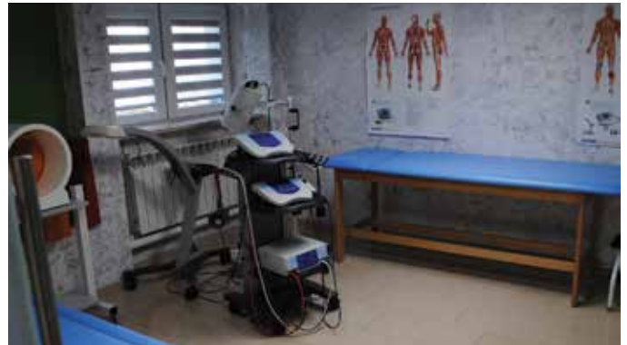
Sala do zabiegów z fizykoterapii

W ramach Stowarzyszenia Na Rzecz Osób Niepełnosprawnych „PrzytULAnka” realizują różne projekty, m.in. z Funduszu Inicjatyw Obywatelskich, PFRON-u czy naszej LGD, a pozyskane środki finansowe przeznaczają na uatrakcyjnienie i powiększenie oferty zajęć i ćwiczeń dla niepełnosprawnych pacjentów. Stowarzyszenie także w tym roku złożyło do Urzędu Marszałkowskiego trzy projekty, w ramach których w pracowni będą realizowane zajęcia bezpłatne. Mają one odciążyć finansowo rodziców dzieci, które korzystają z kilku rodzajów zajęć, organizowanych w Szostce. Członkowie stowarzyszenia mówią, że ciągle mają „pomysły, zapał i chęć do pracy”. Obecnie realizują projekt „Aktywni z przytULAnką”. W czerwcu 2017 roku stowarzyszenie otrzymało wyróżnienie w XVII edycji ogólnopolskiego konkursu „Sposób na Sukces” w kategorii inicjatywy na rzecz społeczności lokalnych m.in. od Prezydenta Rzeczypospolitej Polskiej i Marszałka Województwa Kujawsko-Pomorskiego.