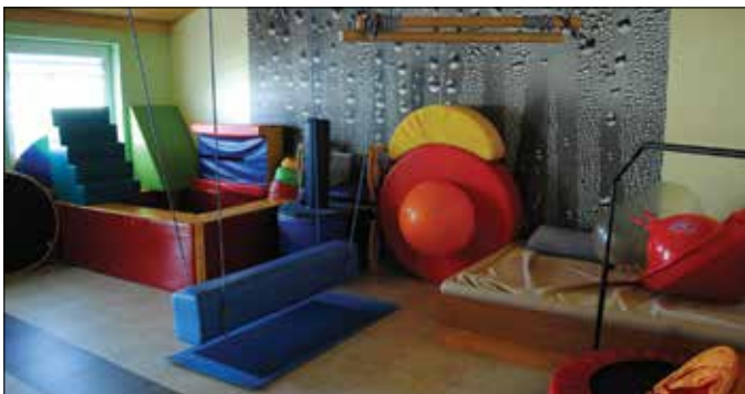
Sala integracji sensorycznej

Ośrodek oferuje m.in. zajęcia psychologiczne i pedagogiczne oraz oligofrenopedagogiczne, masaże i ćwiczenia indywidualne, terapię niemowląt metodą NDT Bobath, kinezyterapię, czyli gimnastykę leczniczą. Specjaliści prowadzą również muzykoterapię oraz fizykoterapię. Oprócz tego oferta pracowni obejmuje zajęcia