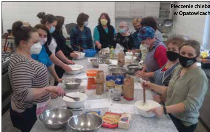
Pieczenie chleba w Opatowicach