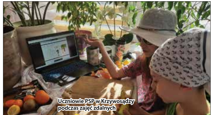
Uczniowie PSP w Krzywosądku podczas zajęć zdalnych

Kolejnym zagadnieniem, którym udało się zainteresować uczestników były wybrane kwasy. Beneficjenci nauczyli się bezpiecznie identyfikować te substancje, poznali ich właściwości i zastosowanie. Dopełnieniem tego przedsięwzięcia był udział wybranych nauczycieli w warsztatach: „Eksperymentowanie online – zaangażuj się” organizowanych przez warszawskie CNK.