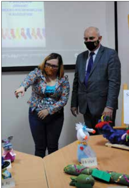
Przedstawicielka podopiecznych Specjalnego Ośrodka Szkolno-Wychowawczego w Radziejowie prezentuje staroście „skarpetkowe” prace

Wychowankowie wspólnie z opiekunami i gośćmi obejrzeli zrealizowany przez podopiecznych ośrodka filmik „Nasi bohaterowie”, podczas nagrywania którego każdy mógł poczuć się przez chwilę aktorem. Film prezentował różnorodne zainteresowania bohaterów. W trakcie uroczystości, zorganizowanej z zachowaniem obowiązującego reżimu sanitarnego, wszyscy mogli się przyjrzeć również wystawie prac konkursowych pn. „Co można zrobić ze skarpetki?” oraz rozdano przyznane w nim nagrody. Ekspozycja prezentowała piękne maskotki, przedstawiające m.in. zwierzęta. Na koniec tego miłego przedpołudnia, starosta powiatu wręczył bohaterom dnia upominki. Po części oficjalnej uczniowie ustawili się do wspólnych zdjęć.