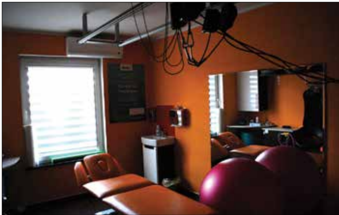
Sala do kinezyterapii