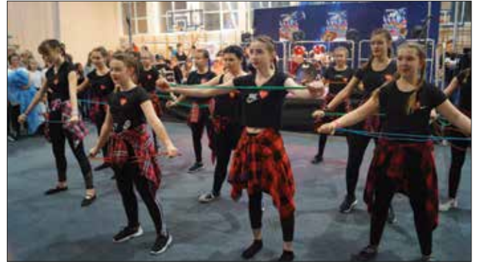
Występ zespołu tanecznego działającego przy piotrkowskim Domu Kultury

Podczas tegorocznego Finału WOŚP, po raz pierwszy, możliwe było zarejestrowanie się jako potencjalny dawca szpiku w ogól-