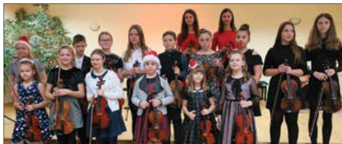
Młodzi i utalentowani skrzypkowie