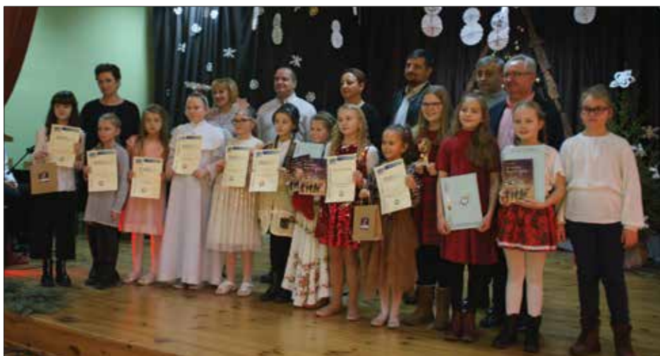
Uczestnicy Regionalnego Konkursu Kolęd i Pastorałek z organizatorami i opiekunami

Zwieńczeniem przesłuchań był koncert galowy, w trakcie którego laureaci otrzy-