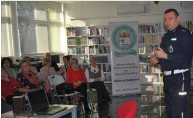
Słuchacze UTW z zainteresowaniem wysłuchali wykładu o bezpieczeństwie w ruchu drogowym

Ze słuchaczami Uniwersytetu Trzeciego Wieku spotkali się radziejowscy policjanci z ogniwa ruchu drogowego. Była mowa