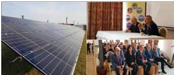
Mikroinstalacje fotowoltaiczne w OHZ Osiećcin

Fotowoltaika to innowacyjne i przyszłościowe rozwiązanie pozyskiwania źródła energii odnawialnej niezbędnej do obniżania kosztów