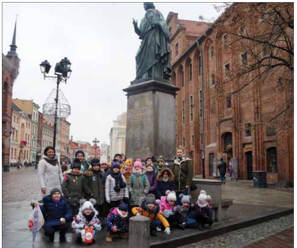
Z wizytą w pięknym mieście Toruniu

Ostatniego dnia Ośrodek Kultury gościł wszystkie chętne dzieci, między innymi z przedszkola „Kujawiaczek”, na przedsta-