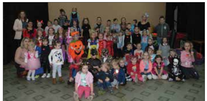
Uczestnicy balu karnawałowego

W drugim tygodniu ferii atrakcją był bal karnawałowy zorganizowany 4 lutego. Wszyscy mali uczestnicy przybyli w pięknych strojach karnawałowych i sprawili, że sala widowiskowa GOK-u wypełniła się różnorodnymi bajkowymi postaciami. W środę amatorzy zajęć plastycznych wraz z rodzicami – pod czujnym okiem instruktora – wykonywali prace w różnych technikach plastycznych. Także w tym dniu zorganizowany został turniej tenisa stołowego o puchar dyrektora