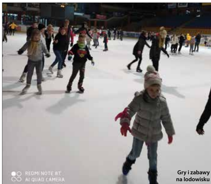
Gry i zabawy na lodowisku

Tekst: Renata Szymborska