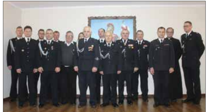
Druhowie ochotnicy z Broniewa i zaproszeni goście