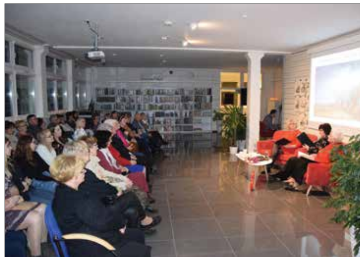
Publiczność w skupieniu wysłuchała programu poetyckiego