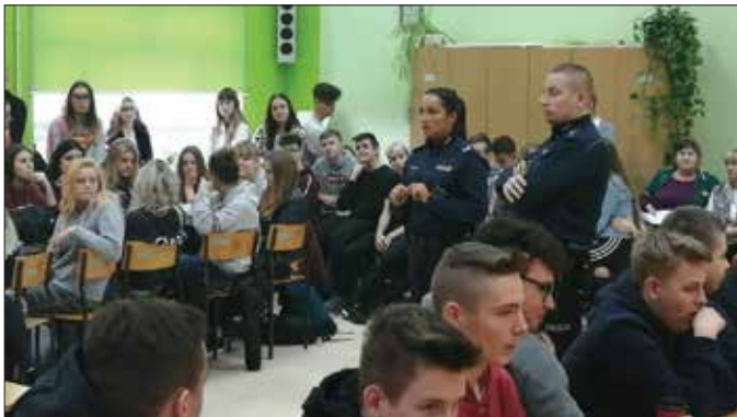
Funkcjonariusze z radziejowskiej komendy policji rozmawiali z młodzieżą na temat używek i konsekwencji ich zażywania

W poniedziałek uczniowie spotkali się z funkcjonariuszami Komendy Powiatowej Policji w Radziejowie, a tematem przewodnim było bezpieczeństwo podczas ferii i przeciwdziałanie zachowaniom ryzykownym. Wtorek to dzień poświęcony uzależnieniom od narkotyków, dopalaczy i innych substancji zastępczych. Młodzież wzięła udział w zajęciach z pracownikiem Powiatowej Stacji Sanitarno-Epidemiologicznej w Radziejowie na temat zagrożeń związanych z eksperymentowaniem z substancjami psychoaktywnymi. Mieli także okazję sprawdzić – w bezpiecznych warunkach – jaki wpływ wywiera spożywanie tych substancji na zachowanie człowieka, testując alkohole i narkotyczne.