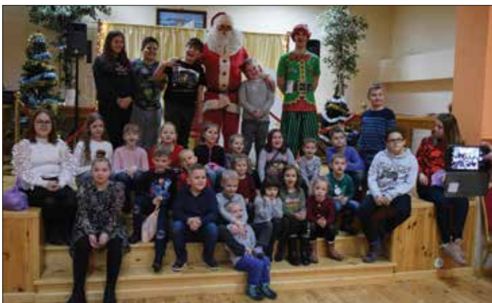
Pamiątkowe zdjęcie ze św. Mikołajem

Tekst: Mirosław Moliński