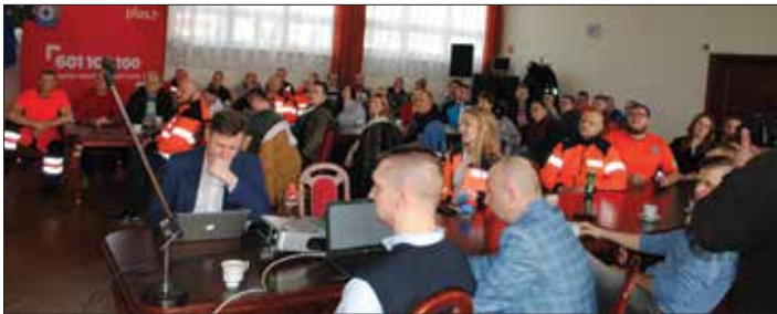
Szkolenie cieszyło się dużym zainteresowaniem ratowników powiatu radziejowskiego i miejscowości ościennych

W sali konferencyjnej Urzędu Miasta w Radziejowie, 17 lutego br., odbyło się szkolenie dla służb ratowniczych dotyczące zasad postępowania w wypadkach masowych. Organizatorem szkolenia był Samodzielny Publiczny Zakład Opieki Zdrowotnej w Radziejowie, a patronat nad nim objął starosta radziejowski.