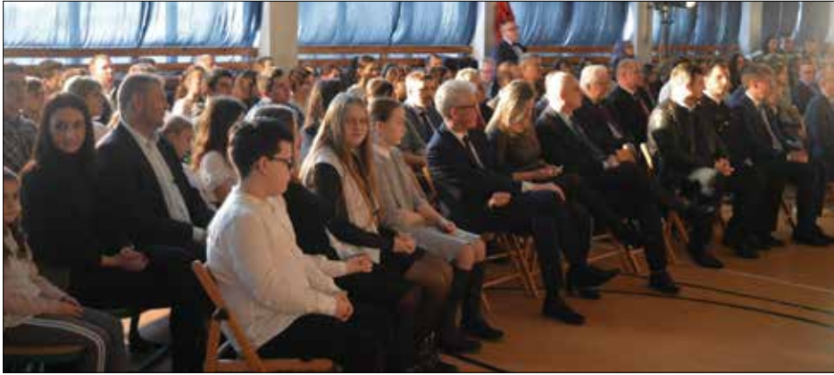
Licznie zgromadzeni goście i uczniowie z zainteresowaniem wysłuchali programu spotkania