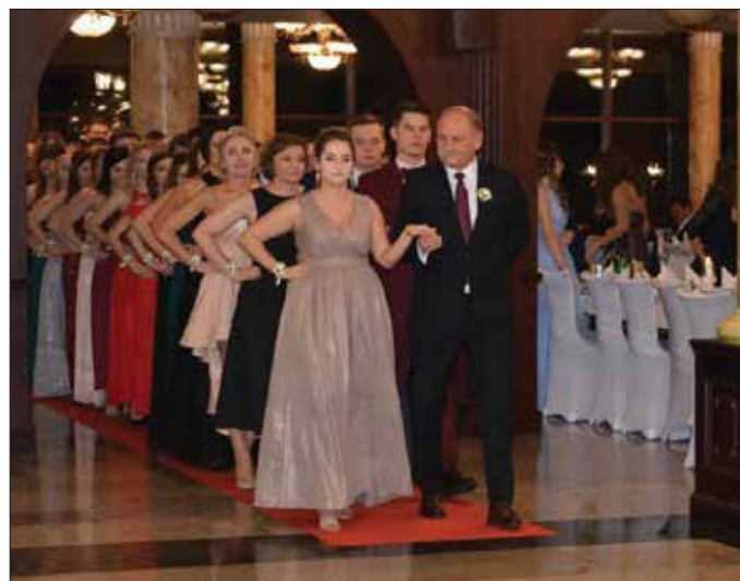
Poloneza czas zacząć...

Kilka ostatnich lat minęło nam wszystkim zadziwiająco szybko. Pozostało już tylko sto dni do matury... Uczniowie ZS RCKU w Przemystce zdobywali wiedzę i spełniali swoje marzenia. Ciężko pracowali, by osiągnąć wyznaczone cele. W sobotni wieczór, 25 stycznia 2020 roku, zapragnęli jednak odłożyć na bok wszelkie troski