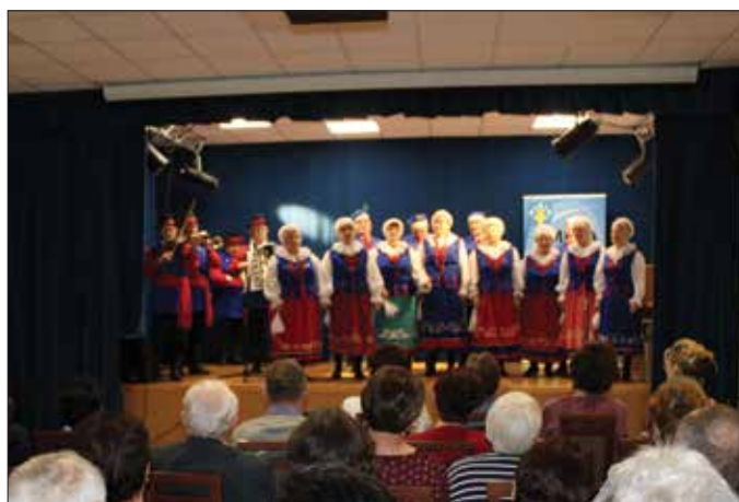
Zespół folklorystyczny „Kujawy Bachorne”

Mimo, że styczeń jest zimowym miesiącem, są takie dwa dni, kiedy każdemu robi się cieplej na sercu. To święto naszych kochanych babć i dziadków. W naszej placówce zapraszanie babć i dziadków na uroczystość z okazji ich święta jest już tradycją. To dzień pełen uśmiechów, wzruszeń i radości.