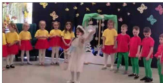
Pszczółki pożegnały Panią Zimą

Powitanie wiosny w naszym przedszkolu to nie tylko przedstawienie, ale też spacer po okolicy i do parku w poszukiwaniu oznak nowej pory roku oraz wykonywane przez dzieci zasiewy w kącikach przyrody, dzięki którym pięknie zazieleniły się przedszkolne parapety.