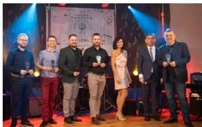
Organizatorzy przeglądu muzycznego i członkowie jury