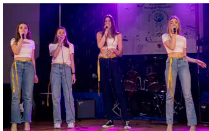
Zespół „September” z Liceum Ogólnokształcącego w Kruszwicy