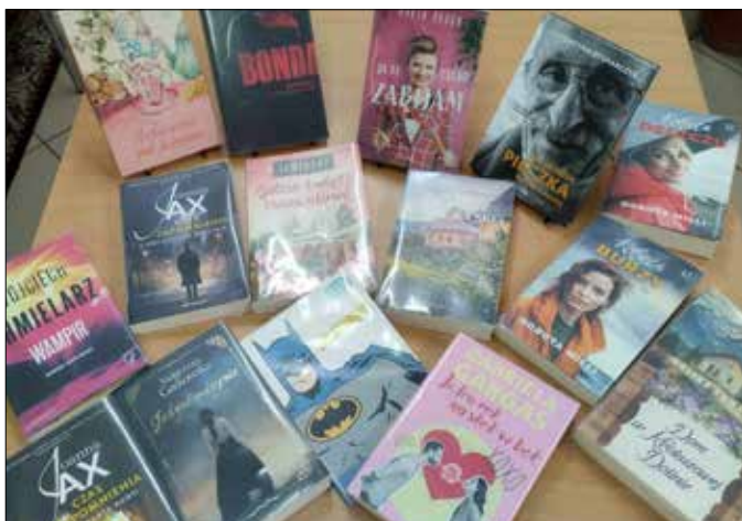
Nowości zakupione w 2024

Nasze biblioteki działające na terenie gminy Radziejów to: Gminna Biblioteka Publiczna w Płowcach i filia biblioteczna w Skibinie. Placówki te starają się spełniać swoje zadania statutowe i przede wszystkim kierować się potrzebami oraz zainteresowaniami naszych czytelników. To ich propozycje są głównie brane pod uwagę przy zakupie książek. Corocznie powiększamy nasz księgozbiór. Zakupów dokonujemy ze środków budżetowych, korzystamy także z dofinansowania Ministerstwa Kultury i Dziedzictwa Narodowego, biorąc od lat udział w projekcie „Zakup nowości wydawniczych do bibliotek publicznych”. W roku ubiegłym przyznano nam 7269 zł, razem z wkładem własnym zakupiliśmy 734 woluminy za 20768 zł. W bieżącym roku w naszej placówce już pojawiły się nowe książki, z czego bardzo się cieszymy, gdy nasi czytelnicy mogą sięgać po wyczekiwane nowości. Niektóre z nich zostały przeczytane i zwrócone, kolejne są w trakcie czytania. W trosce o czytelnika już od 4 lat korzystamy z aplikacji Legimi tzn. dostępu do tysięcy e-booków i audiobooków. Korzystanie ze zbiorów elektronicznych dostępnych zdalnie cieszy się coraz większym zainteresowaniem.