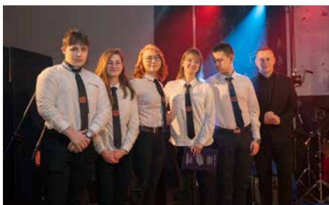
Zespół „True life” z Zespołu Szkół Technicznych w Toruniu