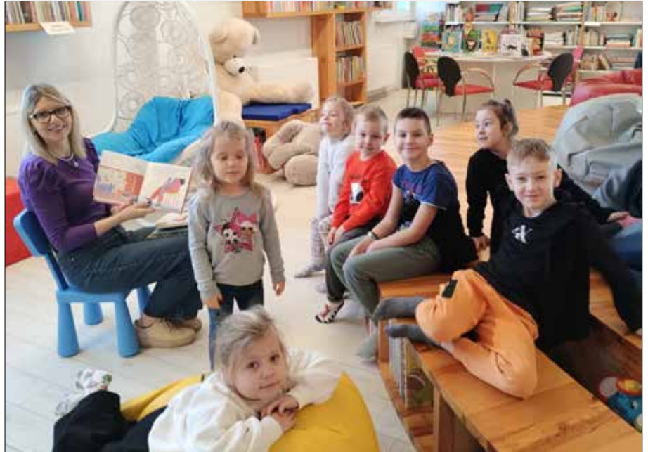
Spotkanie głośnego czytania