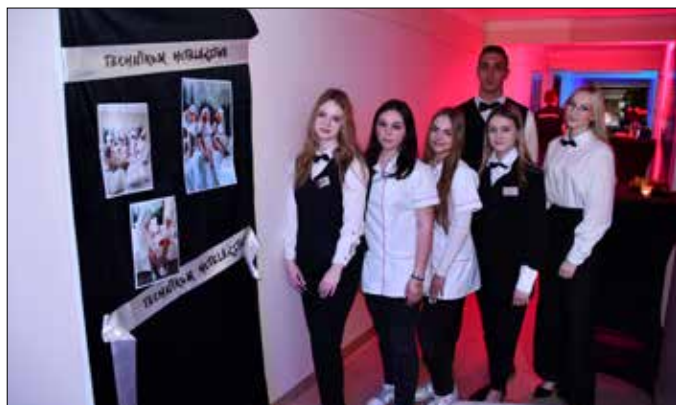
Uczniowie Technikum Hotelarstwa

Nasza oferta jest bardzo różnorodna. Ośmoklasiści, którzy wybiorą „Przemystkę”, będą mogli – w zależności od zainteresowań – kształcić się w zawodach: technik ekonomista, technik spedytor, technik hotelarstwa, technik żywienia i usług gastronomicznych, technik rolnik, technik mechanizacji rolnictwa i agrotechniki oraz w nowym kierunku – technik informatyk. Tym, którzy nie wybiorą konkretnego kształcenia zawodowego, proponujemy liceum ogólnokształcące z innowacją pożarnictwo i ratownictwo medyczne lub bez niej.