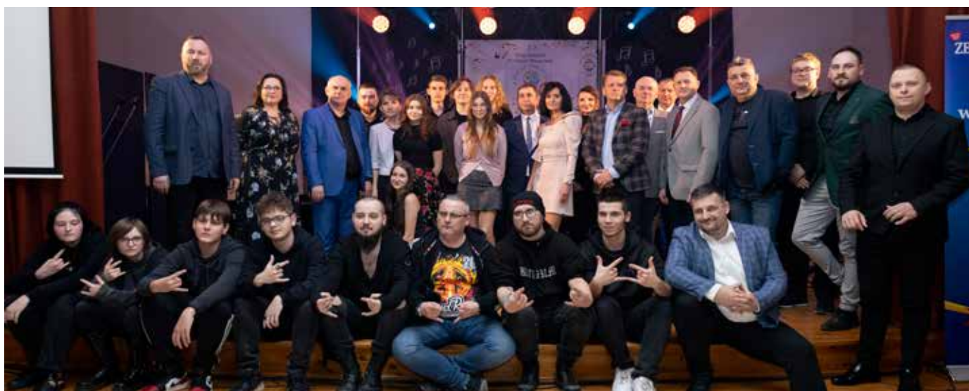
Pamiętkowe zdjęcie uczestników wydarzenia