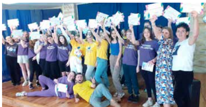
Animatorzy z certyfikatem

Końcówka marca to czas na szlifowanie praktycznych umiejętności zawodowych. W dniach 25–26 marca br. 40 uczniów klas