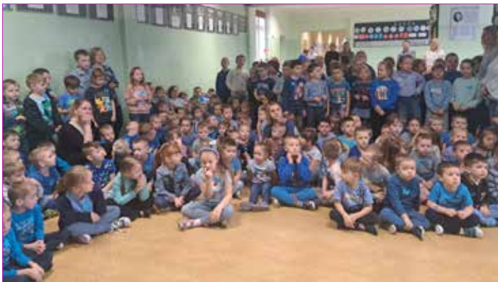
W tym dniu w szkole obowiązywał kolor niebieski

W Zespole Szkolno-Przedszkolnym w Osiecinach, 3 kwietnia, obchodziliśmy Światowy Dzień Świadomości Autyzmu. Znakiem solidarności z osobami z autyzmem i ich rodzinami jest kolor niebieski, dlatego w tym dniu przyszliśmy do przedszkola i szkoły ubrani na niebiesko.