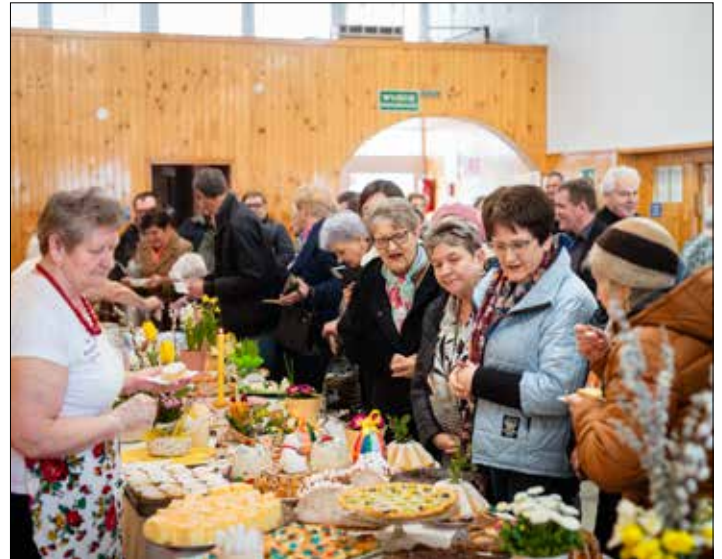
Licznie przybyli mieszkańcy chętnie degustowali prezentowane potrawy

Tekst/Foto: Małgorzata Mosakowska UG Osiecin