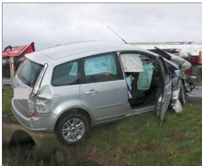
Uszkodzone pojazdy po zdarzeniu w Broniewku

Po uderzeniu samochodu wpadły do rowów. Kierująca osobówką oraz jej 54-letnia pasażerka trafiły do szpitala. Uczestnicy wypadku byli trzeźwi. Policjanci zatrzymali 38-latkę prawo jazdy i będą wyjaśniać szczegóły tego zdarzenia.