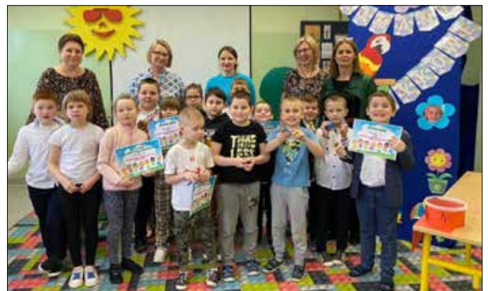
Organizatorzy i uczestnicy konkursu

Oto wyniki konkursu. W kategorii grup zerowych i klas pierwszych: I miejsce – „Mistrzem logopedii” została drużyna z grupy SÓWKI , II miejsca – „Wicemistrzami logopedii” zostały drużyny