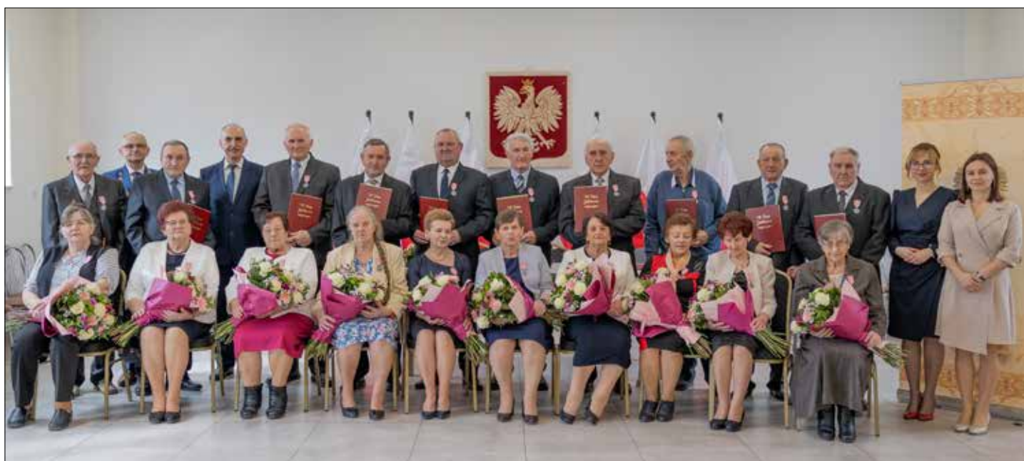
Pamiątkowe zdjęcie Jubilatów z władzami gminy Topólka

Marszem Mendelzona rozpoczęła się uroczystość wręczenia Medali za Długoletnie Pożycie Małżeńskie w gminie Topólka. Każda rocznica ślubu, to okazja do świętowania, jeśli zaś jest to pięćdziesiąta rocznica to nabiera ona szczególnego znaczenia nie tylko dla Jubilatów, ale również dla całej społeczności gminnej.