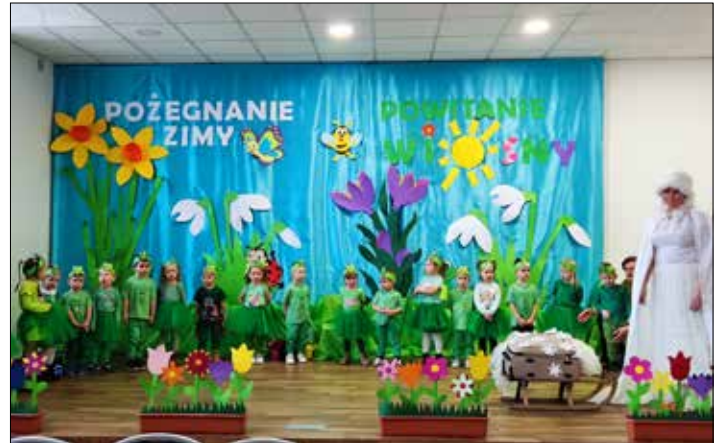
Wiosna już na dobre u nas zagościła