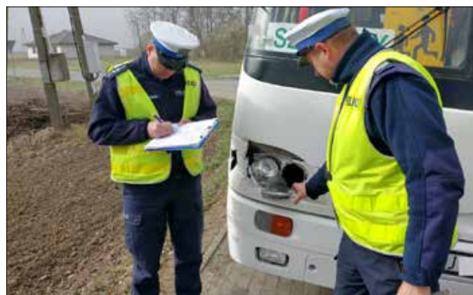
Oględziny autobusu biorącego udział w kolizji

Kierujący autobusem szkolnym, jak wstępnie ustalili policjanci, wymusił pierwszeństwo przejazdu na kierowcy mitsubishi. Jeden z uczniów trafił do szpitala na badania. Za rażące naruszenie przepisów ruchu drogowego mundurowi zatrzymali mężczyźnie prawo jazdy.