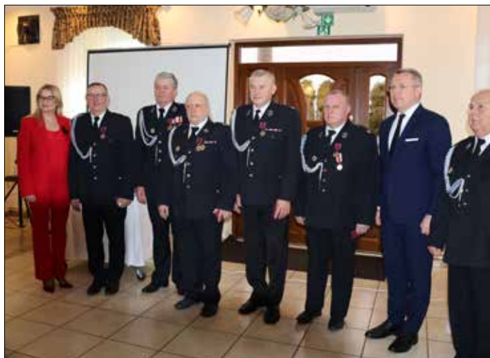
Druhowie odznaczeni Srebrnym i Brązowymi Krzyżami Zasługi

Tekst: Wanda Wiatrowska