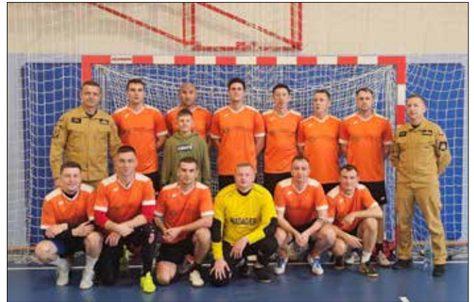
Piłkarze reprezentujący KPPSP w Radziejowie