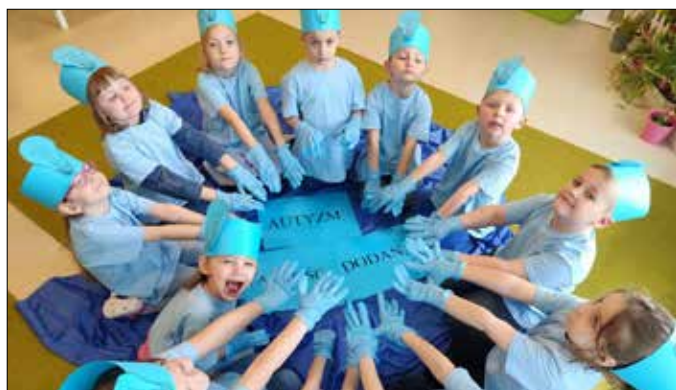
Ten dzień wyglądał u nas inaczej niż zwykle

Dzień Świadomości Autyzmu w piotrkowskim przedszkolu to szczególny dzień. To, czego nauczą się dzieci na tym etapie jest niezwykle ważne. Na znak solidarności, jedności, akceptacji i zrozumienia przedszkolaki, nauczyciele i pracownicy przedszkola założyli w tym dniu ubrania w kolorze niebieskim.